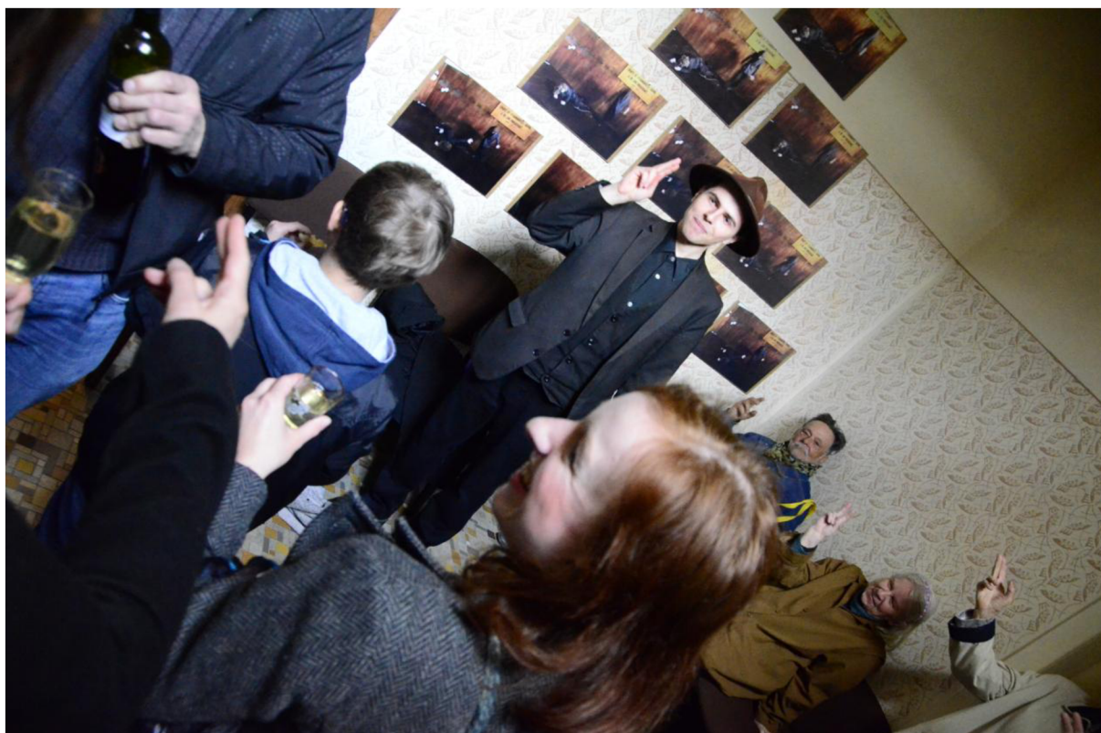
Sdílení situace, Církev československá husitská v Hodoníně, 30. 4. 2017 (výměna pokrývek hlav)