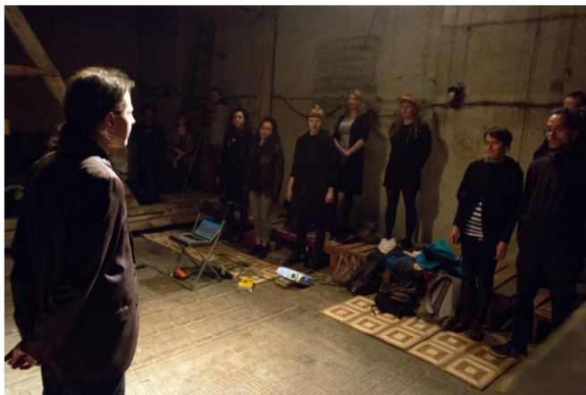
Practice, Performance Crossings vol. 0 v Praze, 9. 5. 2017 (viz transkripce, str. 16 - 20)