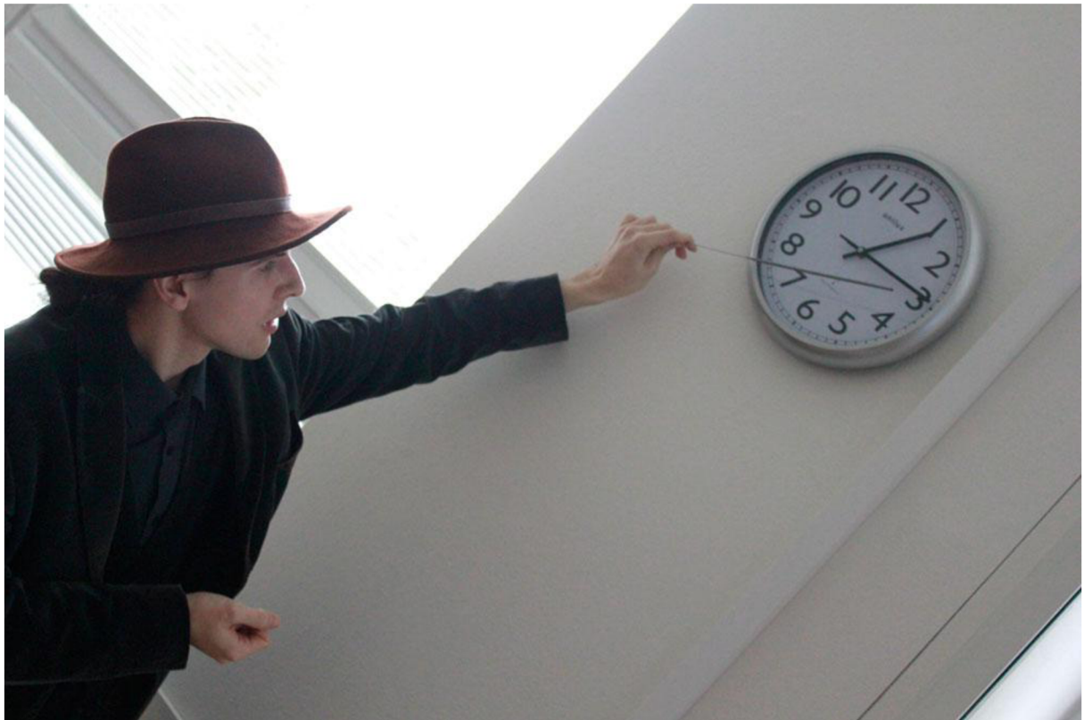
Čas, Střední škola Strážnice, 20. 12. 2016