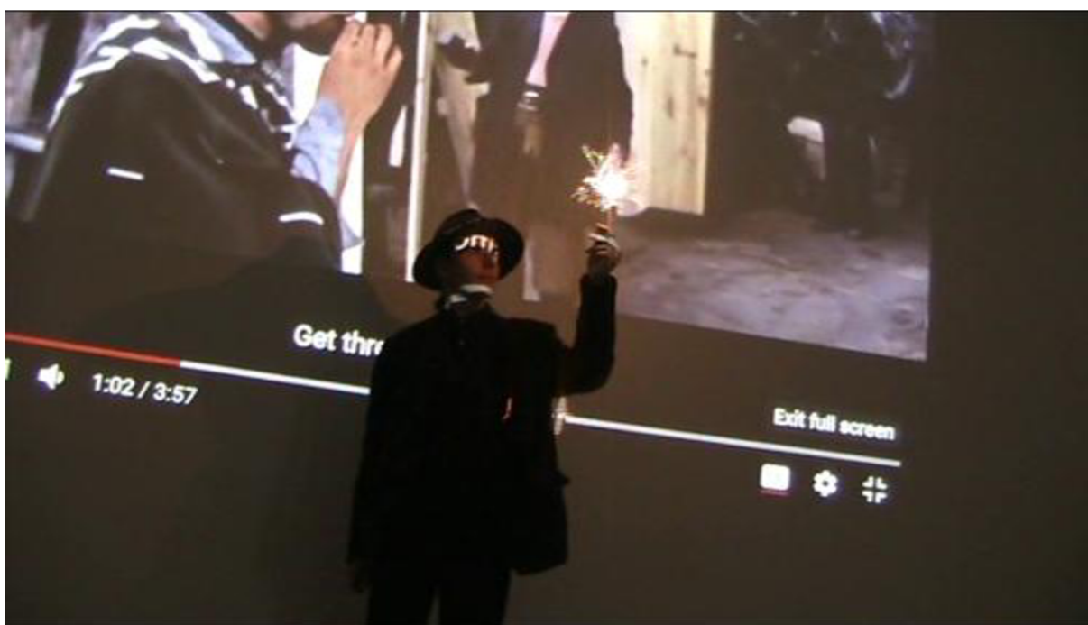
Rychlost a pomalost , FaVU VUT v Brně, 15. 12. 2016 (video dokumentace)