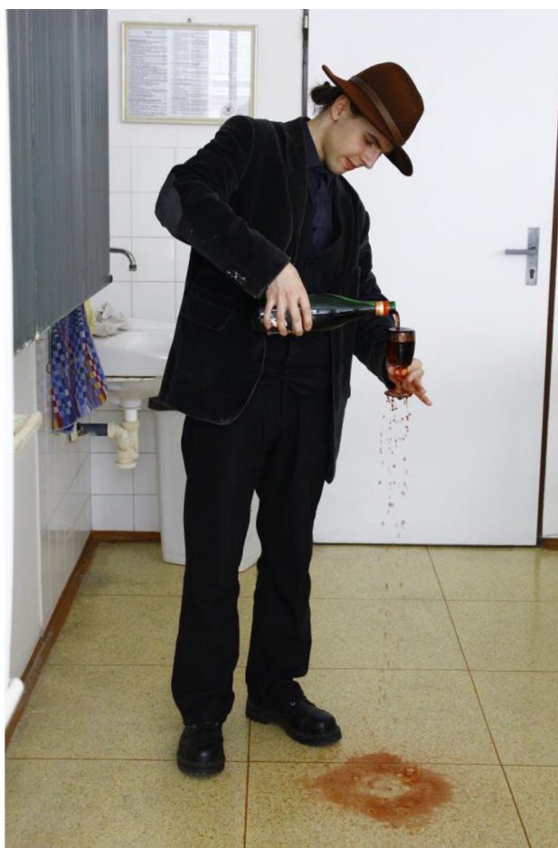
Odkaz středověkého umění a myšlení, Střední škola Strážnice, 24. 3. 2017