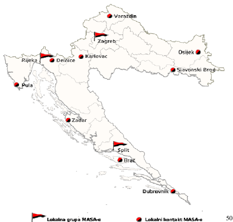
Obrázek č. 2: Lokální skupiny MASA:

V současné době fungují lokální skupiny v Záhřebu, Rijece a Splitu, aktivní buňky se pak vyskytují v obcích Varaždin, Karlovac, Osijek, Slavonski Brod, Pula, Delnice, Zadar, Brač a Dubrovnik. MASA je tedy v rámci zemí bývalé Jugoslávie anarchistická organizace s největším lokálním pokrytím.