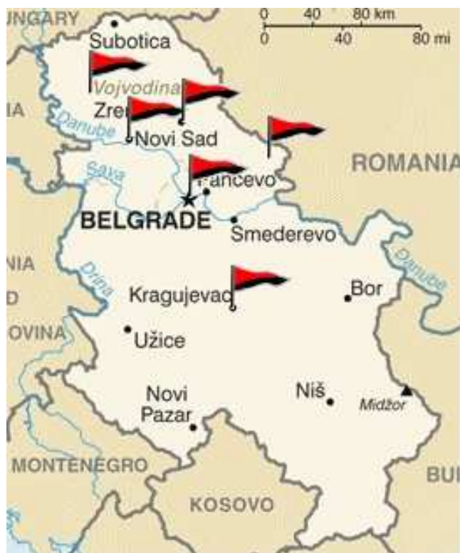
Obrázek č. 4: Lokální skupiny ASI: