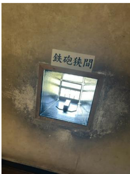
Příloha č. 9 Střílna ve zdi hlavní tvrže hradu Macumoto