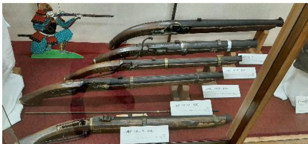
Příloha č. 9 Arkebuzy s rozdílnou ráží (Muzeum hradu Nagašino, foto – archív autora)