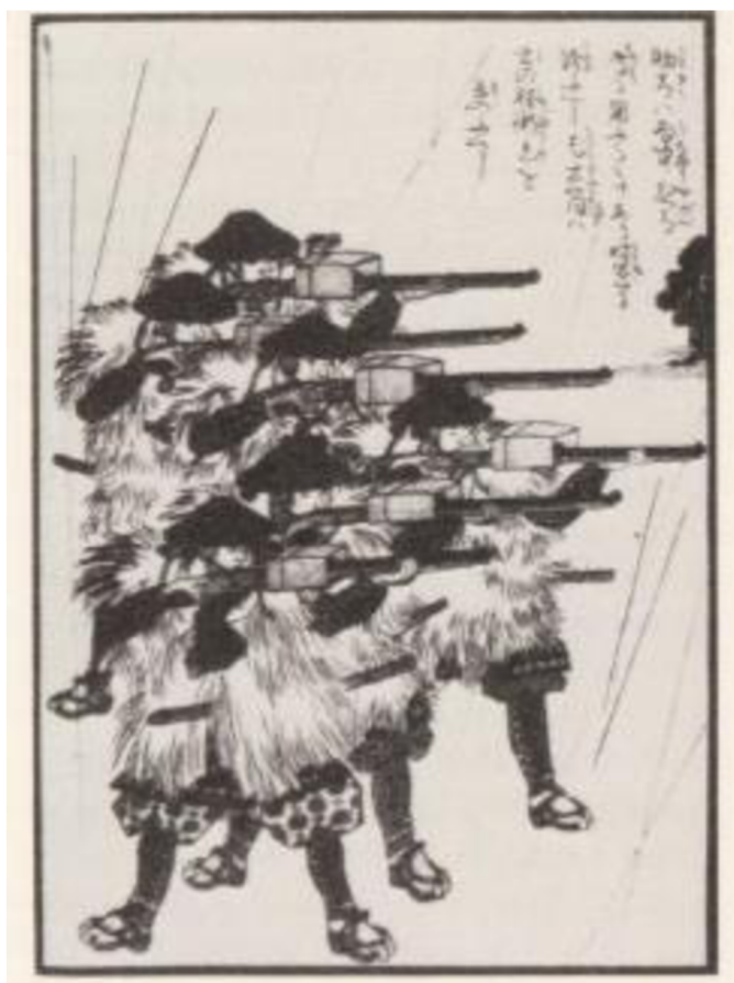
Příloha č. 11 Mušketýři s krytkami proti dešti (Podle Perrin. Giving up the Gun . str. 18)