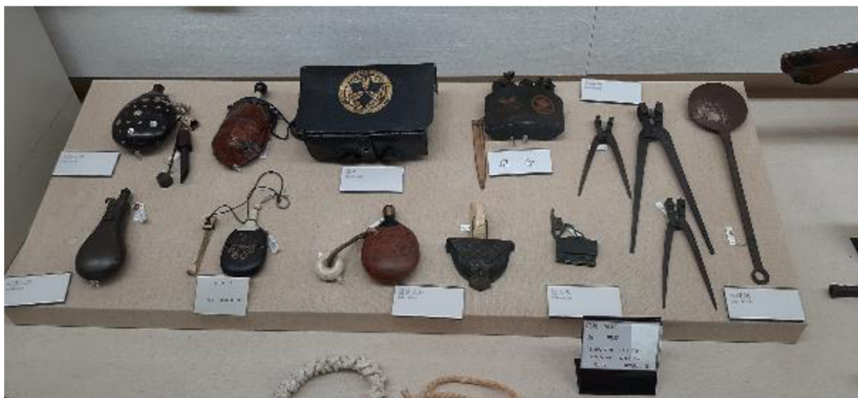
Příloha č. 10 Nádoby na uschování střelného prachu (Muzeum teppó města Kunitomo)