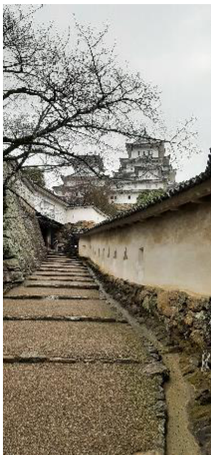
Příloha č. 8 Úzká ulička obehnaná zdí s otvory pro střelbu z arkebuz (Hrad Himedži)