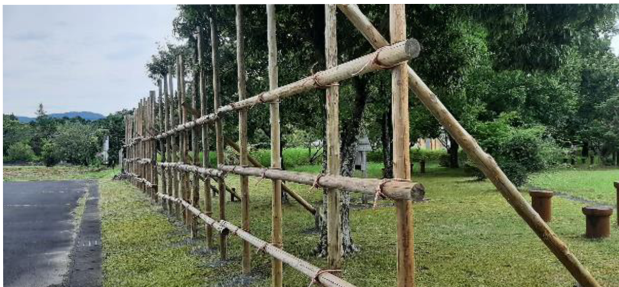
Příloha č. 12 Replika palisády, kterou Oda Nobunaga nechal postavit před své mušketýry v bitvě u Nagašina. (Muzeum bitvy u Nagašina, foto – archiv autora)