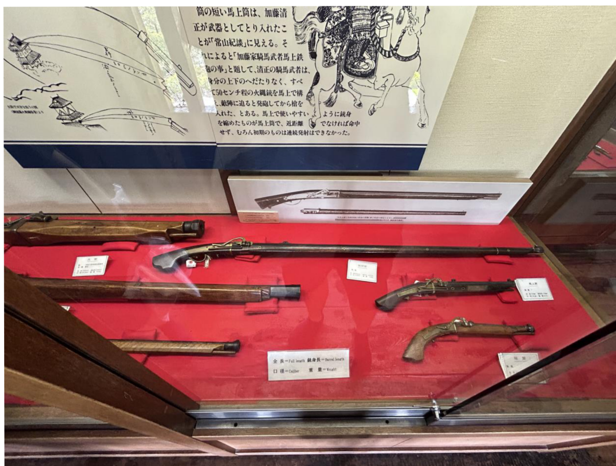
Příloha č. 7 Srovnání obyčejné arkebuzy s pistolovými arkebuzami. (Hrad Macumoto)