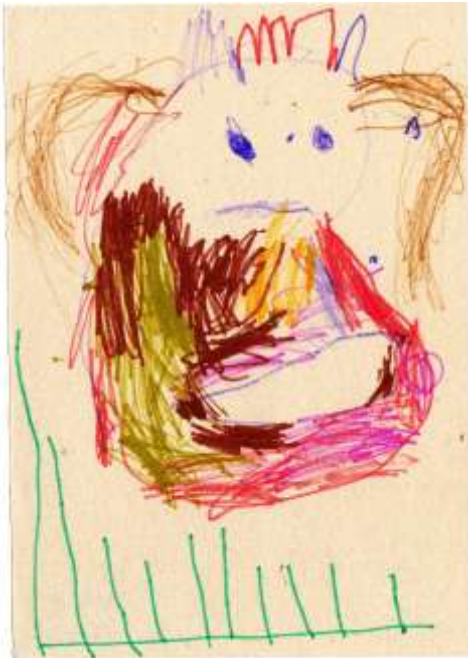
Lenička 4 roky - královna