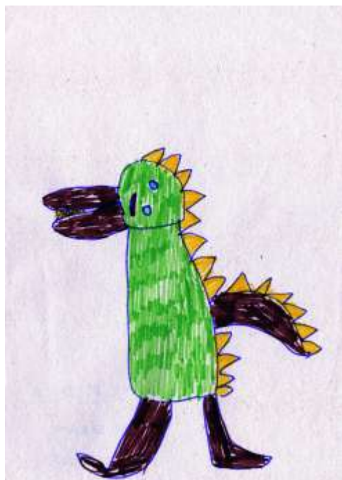
Martinka 5 let – dráček Barborka