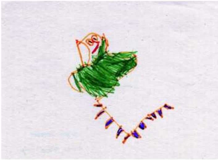
Simonka 4 roky – dráček Barborka