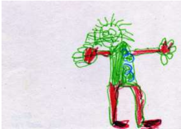
Vojtík 5 let - hudebník