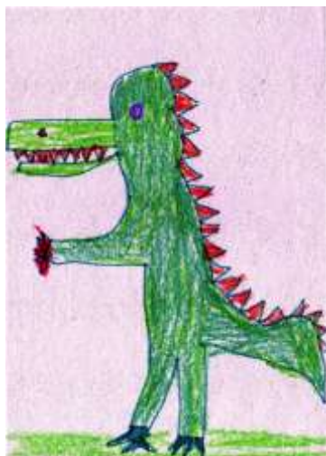
Matěj 5 let – drak Jonáš