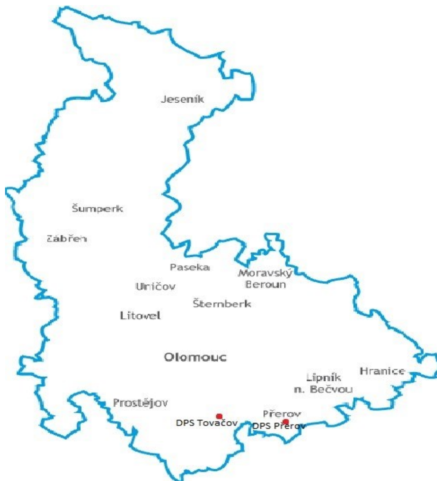
Obr. 2.1 Umístění domovů pro seniory v Přerově a Tovačově