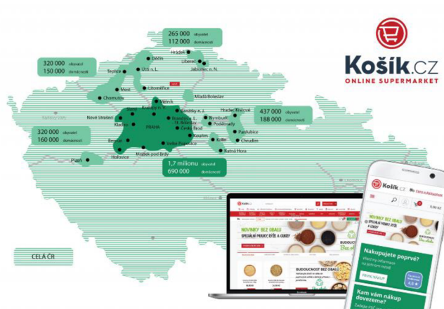
Obrázek 2 Košík.cz - Mapa pokrytí