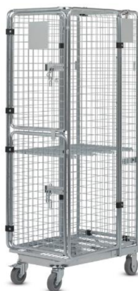
Obrázek 1 Roltejner