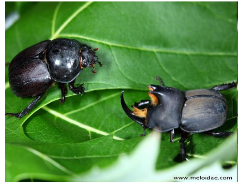
Obr. č. 2; bicho candado