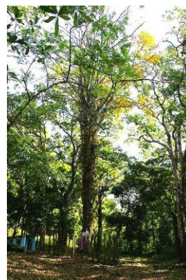
Obr. č. 12; granadillo