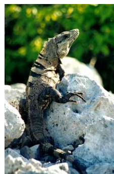
Obr. č. 8; garrobo