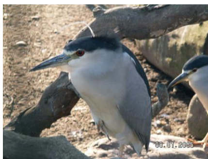
Obr. č. 16; guairabo