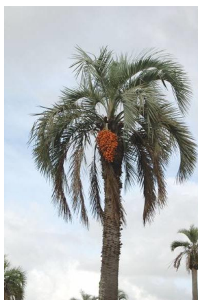
Obr. č. 5; butiá