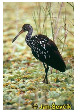
Obr. č. 24; guariao