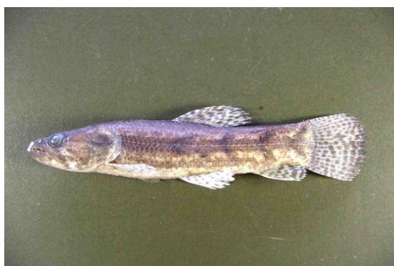
Obr. č. 13; guabina