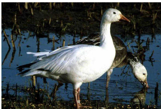
Obr. č. 19; guanana