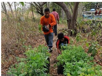
Obr. č. 15; guachapelí