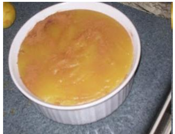
Obr. č. 4; boniatillo