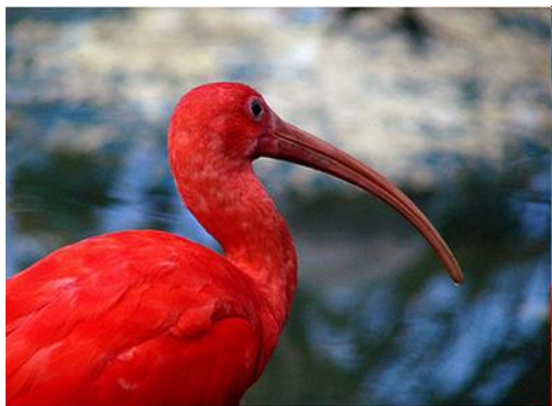
Obr. č. 23; guara