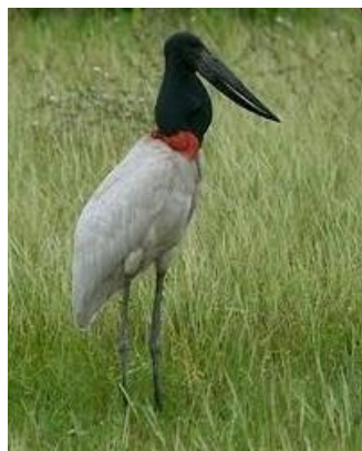
Obr. č. 9; garzón