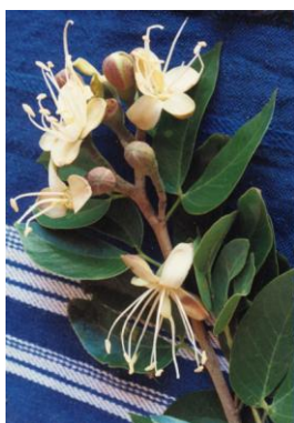
Obr. č. 21; guapinol