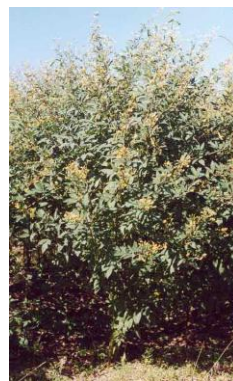
Obr. č. 20; guandú