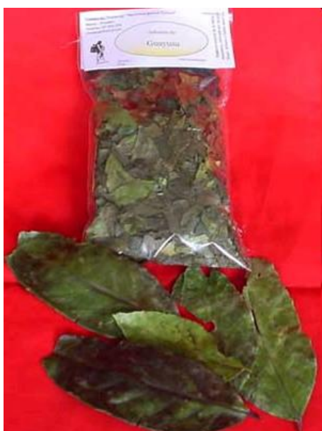
Obr. č. 27; guayusa