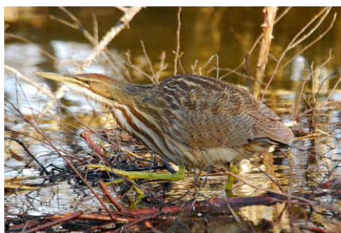
Obr. č. 18; guanabá