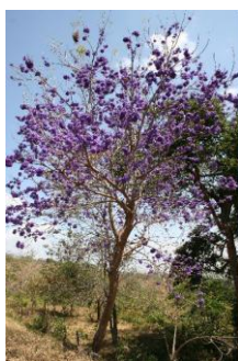
Obr. č. 17; gualanday