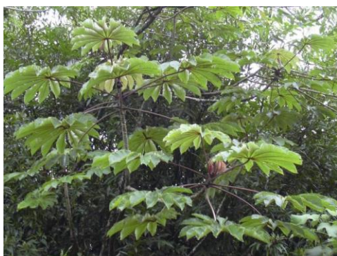
Obr. č. 25; guarumo