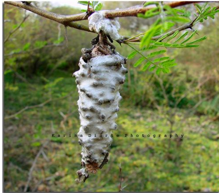
Obr. č. 1; bicho canasto