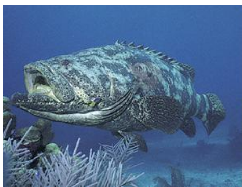
Obr. č. 26; guasa