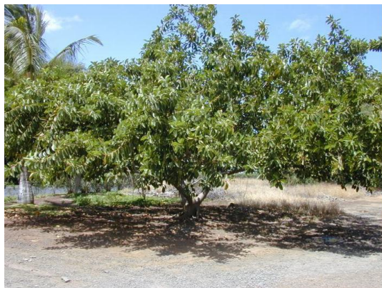
Obr. č. 11; gomero