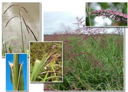
Obr. č. 7; gamelote