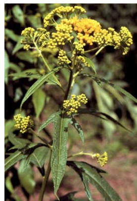
Obr. č. 10; gaviłana