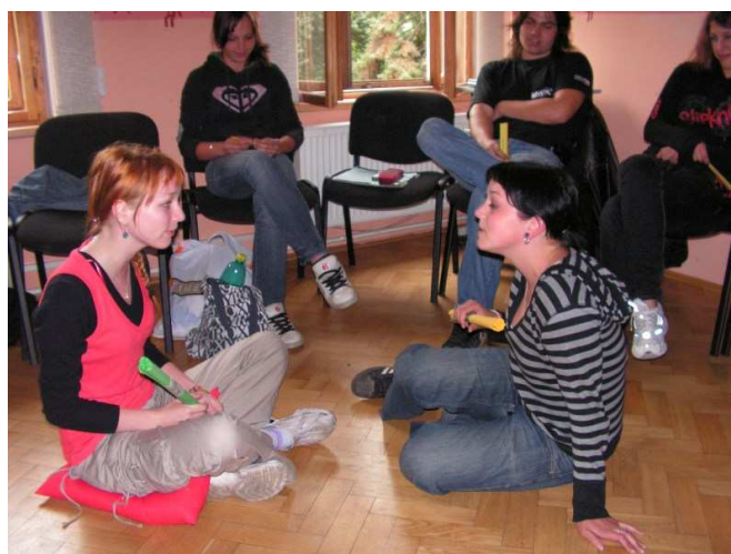
Obrázek č. 6: Hraní rolí při výcviku dobrovolníků

Odbornou fází přípravy tvoří již zmíněný praktický nácvik sociálně psychologických dovedností. Podle Tošnera a Sozanské (2006) se v této fázi podrobněji pracuje s obavami dobrovolníků, jejich strachy, motivací, očekáváními. Při metodě přehrávání rolí je pro dobrovolníky důležitým zážitkem to, že si mohou vyzkoušet nejen svou budoucí roli, ale také roli klientů, rodičů, případně spolupracovníků (Obrázek č. 6).