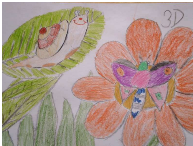
Obrázek č. 4: Výtvarná práce jedné z dvojic