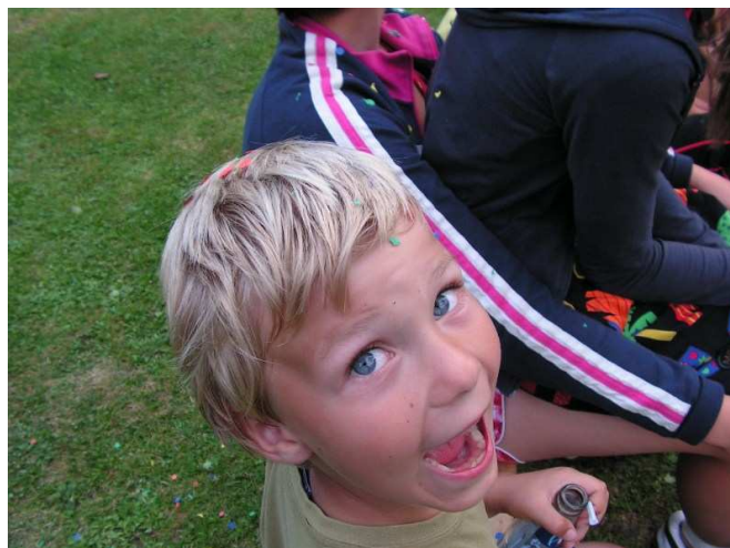
Obrázek č. 5: Dítě zařazené v programu Pět P