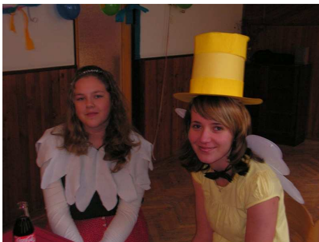
Obrázek č. 3: Dvojice programu Pět P

Právě o pozitivní emoce a důvěru dítěte v dobrovolníka v programu Pět P jde především (Obrázek č. 3).