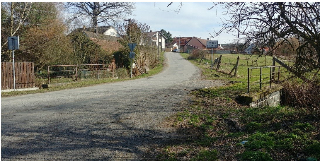
obr. 23.3: pohled na trasu stoky A před zaústěním do ČOV, severovýchodní pohled