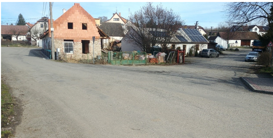
obr. 23.5: pohled na místo budoucího zaústění stoky C do stoky A, vpravo se nachází náves obce, severovýchodní pohled