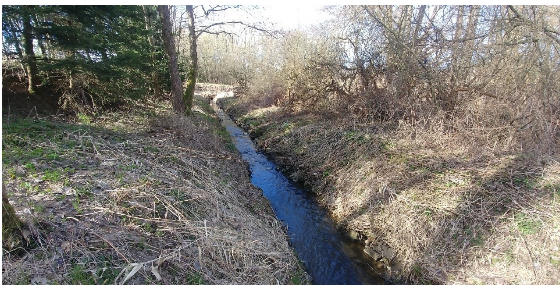
obr. 23.2: pohled ve směru toku na bezejmenný potok do kterého bude zaústěn výustní objekt ČOV