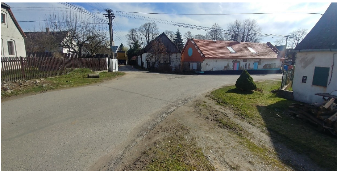
obr. 23.4: pohled na místo budoucího zaústění stoky B do stoky A, jihovýchodní pohled