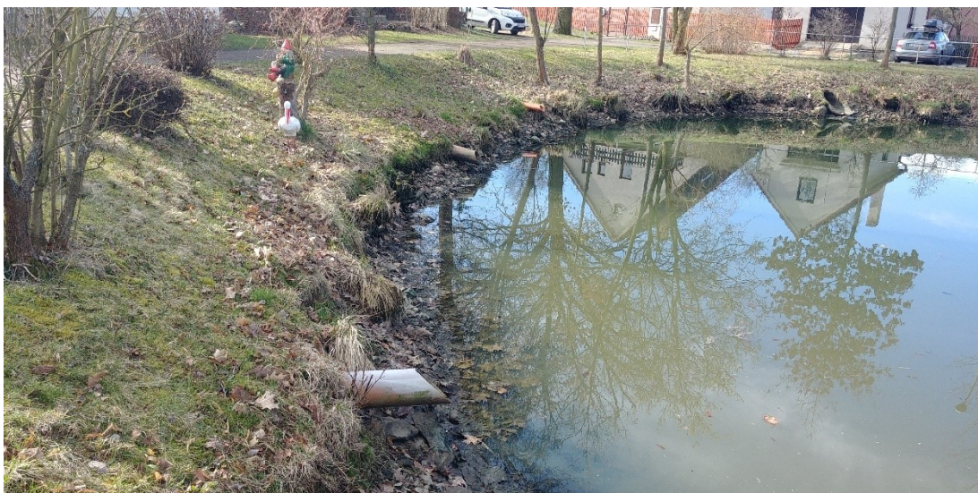
obr. 23.6: pohled na současné vyústění stávající kanalizace do návesního rybníku