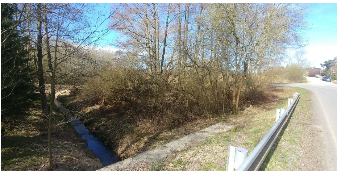
obr. 23.1: pohled na místo umístění budoucí ČOV v zářezu komunikace III/00347h, severozápadní pohled