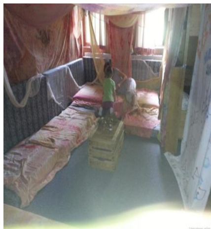
Obrázek 1 Chýška, komunitní pokoj

Cílem této bakalářské práce je navrhnout víkendový program environmentální výchovy pro rodiče s dětmi předškolního věku a vyhodnotit jeho úspěšnost. Program má být realizován s jednou skupinou rodičů s dětmi. Místem pobytu je horská chalupa v Harrachově, na příjemném, nerušeném a bezpečném místě na pokraji vzrostlého lesa. Chalupa má 11 pokojů s celkovou kapacitou 30 osob, velkou společenskou místnost, kterou využijeme pro společné aktivity. V jednom z pokojů je vytvořená oblíbená „chýška“, komunitní pokoj vyzdobený lehkými obarvenými závěsy z fáčoviny, na zemi jsou matrace a všude, na palandách, postelích i na zemi jsou velké pohodlné polštáře a plyšové hračky. Kvalitní ozvučení spolu s intimním osvětlením dává místu kouzelnou atmosféru pro poslech pohádek nebo hudby k relaxaci. Pokoj využíváme také jako místo pro večerní reflexe programů.