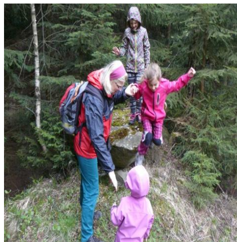
Obrázek 2 Příroda je bezpečné prostředí pro hru

Rodiče dětí v předškolním věku ještě nenechávají své potomky venku bez doprovodu, často tráví společný čas venku dohlížením na jejich bezpečí, komentují, co děti smí a co nesmí, limitují dětský projev, ale nenabízí náhradní řešení. Občas sami tápou nad výběrem hry, nevědí jakou zábavu dětem nabídnout, jaké dobrodružství by s dětmi mohli realizovat, tak se procházka často stává hrou na všechno, co nesmíš, s nejasnými pravidly pro děti, jejímž jediným cílem je, aby se neumazaly, neodřely, neupadly, nesedaly si na zem, nelezly na strom, nelítaly, nesahaly..., je škoda, že si dospělí časem zapomenou hrát.