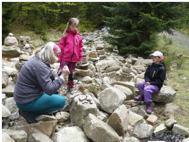
Obrázek 4 Putování za vodní vílou

S ohledem na cílovou skupinu, rodiče s malými dětmi, prostředí horské chalupy, snadno přístupný les, volný prostor na louce u koupaliště a