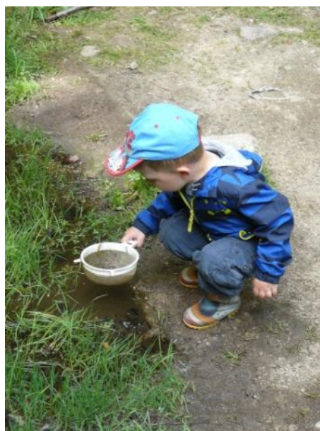
Obrázek 5 Nadšený badatel

Inspirací k přípravě další části programu mi byla práce J. Cornella (2012 s. 15), metodika plynulého učení, učení hrou a prožitkem, kterou