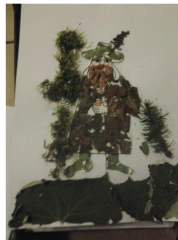
Obrázek 3 Práce s přírodním materiálem

V rámci evaluace programu budu sledovat, jaké výjevy z přírody se nejčastěji při reflexi objeví.