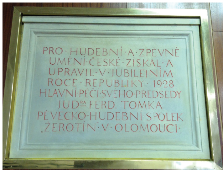
Pamětní deska z roku 1928 v budově na Slovenské ulici