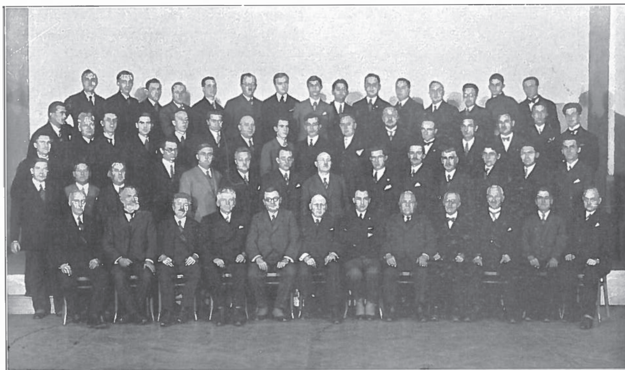
MUŽSKÝ SBOR NA JUBILEJNÍM KONCERTĚ (SV. VÁCLAV) DNE 21. LISTOPADU 1930