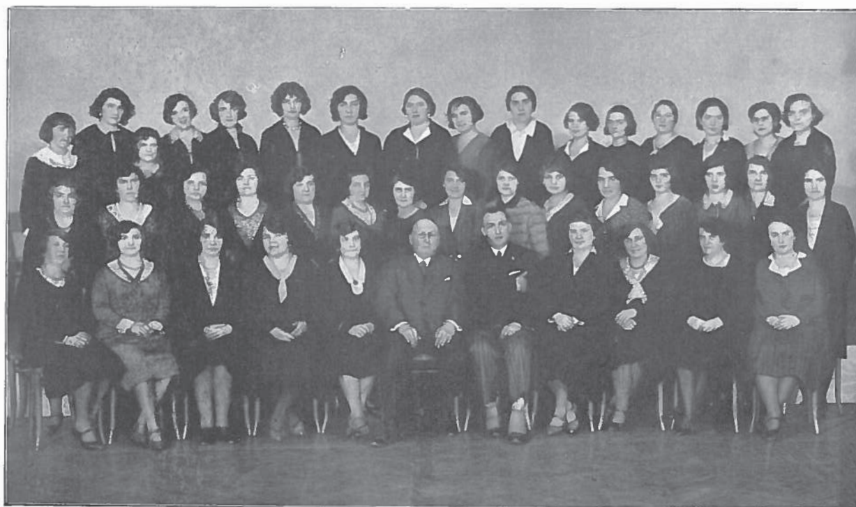
ŽENSKÝ SBOR NA JUBILEJNÍM KONCERTĚ (SV. VÁCLAV) DNE 21. LISTOPADU 1930