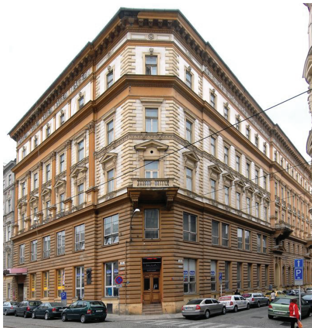
Národní dům na tř. 8. května v Olomouci