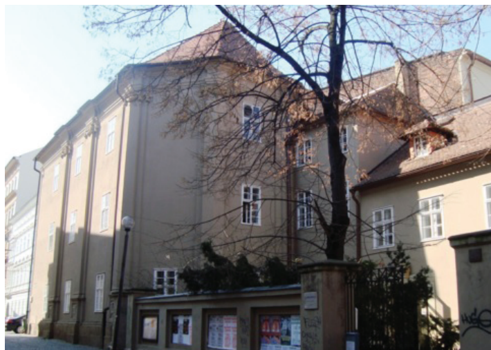
Budova Žerotína (bývalý německý učitelský ústav) na Slovenské ulici v Olomouci