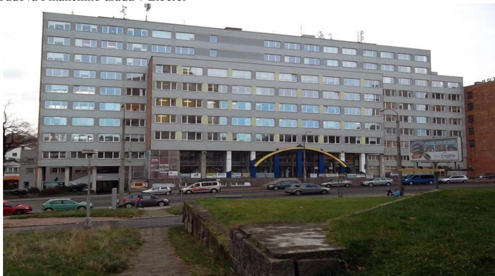
Obr. 1 Budova Finančního úřadu v Liberci