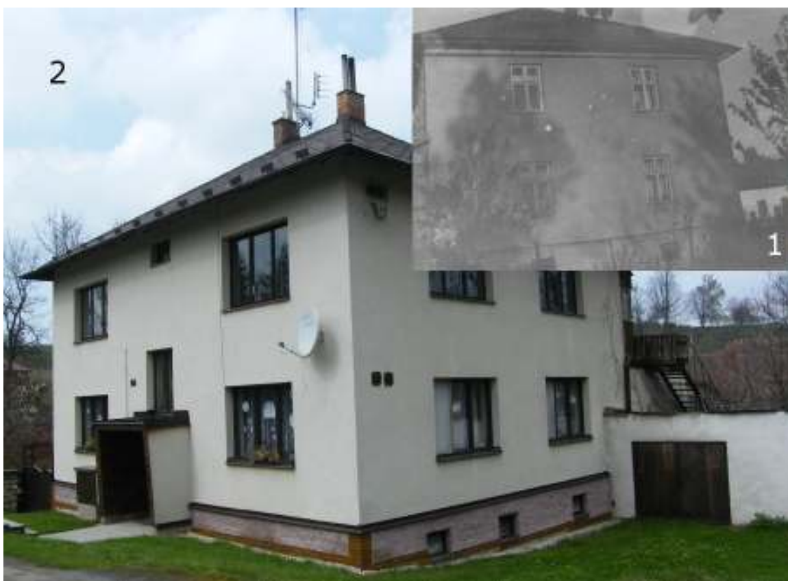
Obchod se smíšeným zbožím Josefa Krejsy na nedatovaném fotu (1) a stejný dům dnes (2)