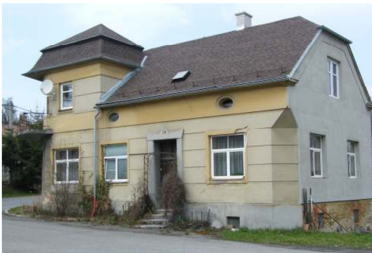
Bývalé řeznictví Severa