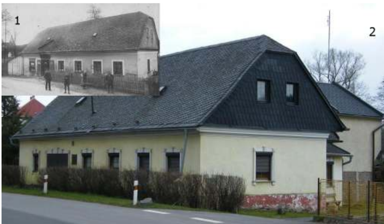
Bývalé pekařství Laštovička 1945 (1) a nyní (2)