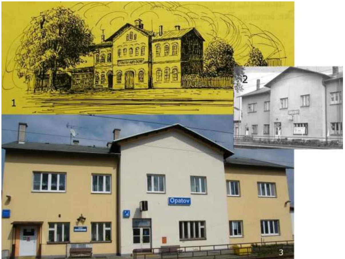
Železniční stanice v Opatově na kresbě z 30. let (1), blíže nedatovaném fotu (2) a dnes (3)