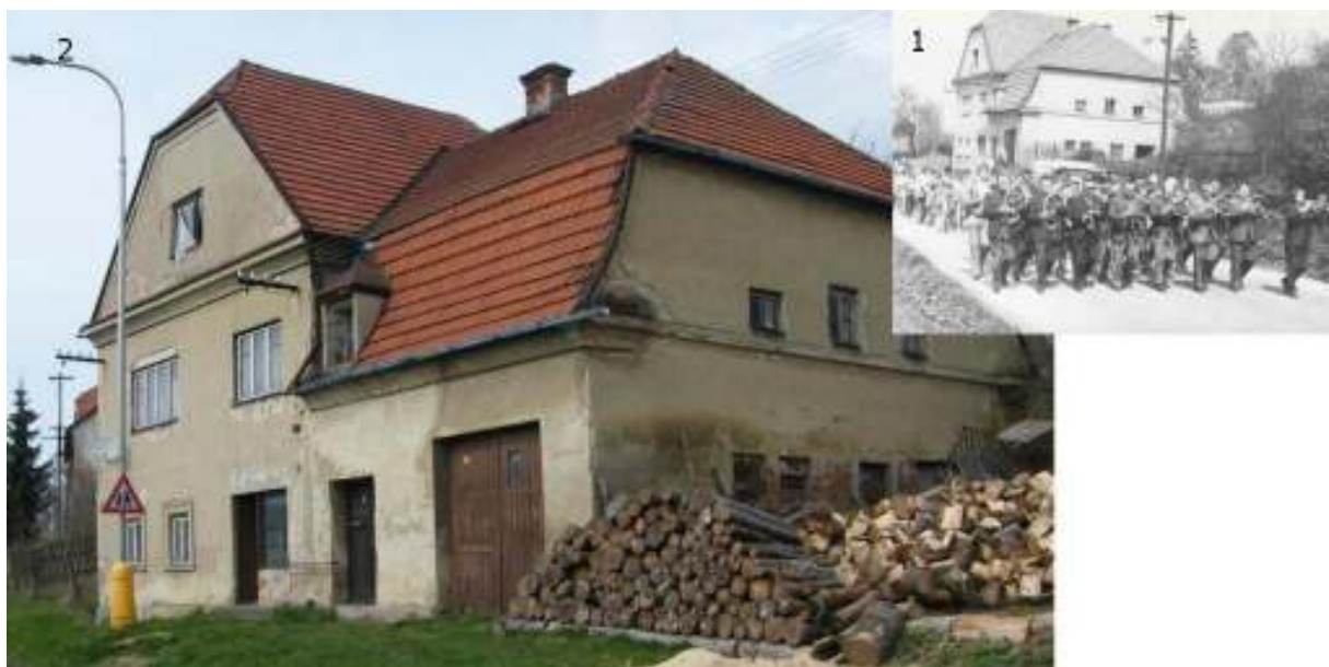
Knihařství a papírnickví Macek na blíže nedatovaném fotu (1), stejná budova nyní (2)