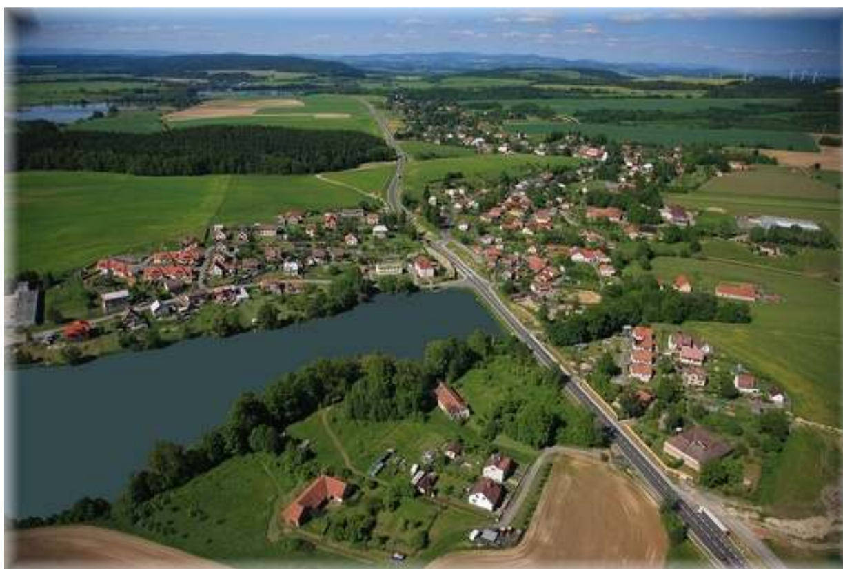
Letecká fotografie Opatova