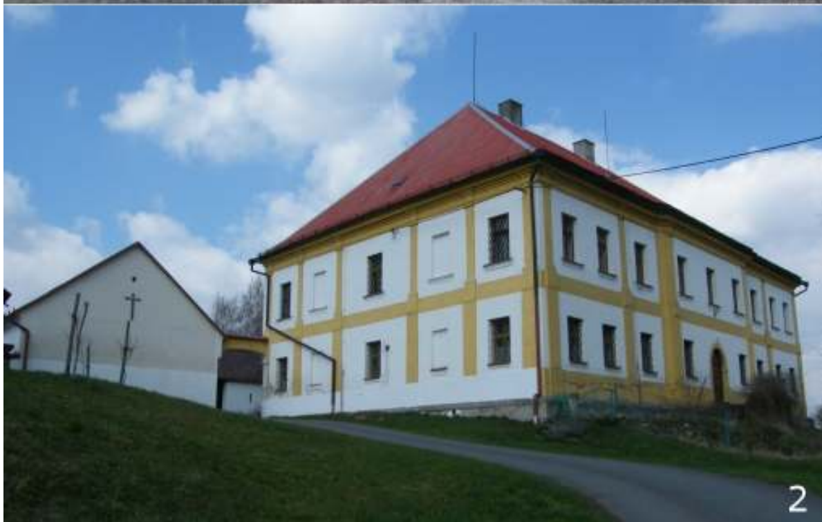
Farní budova 1842 (1) a nyní (2)