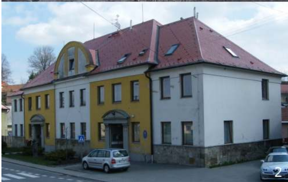
Radnice 1924 (1), první sídlo MNV, pošty, SNB a zemědělské školy, dnes obecní úřad (2)