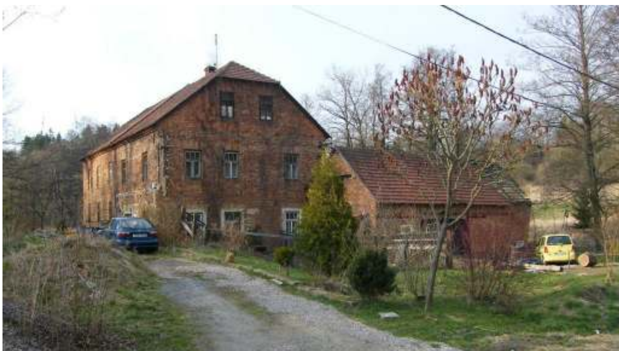
Mlín u Macáků