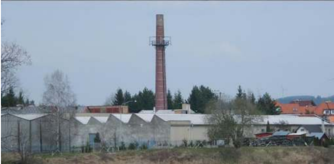
Areál bývalé textilní továrny, dnes Bellitex