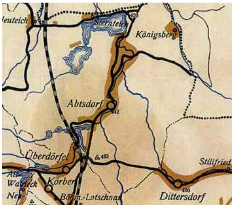
Výřez ze staré mapy okresu Svitavy