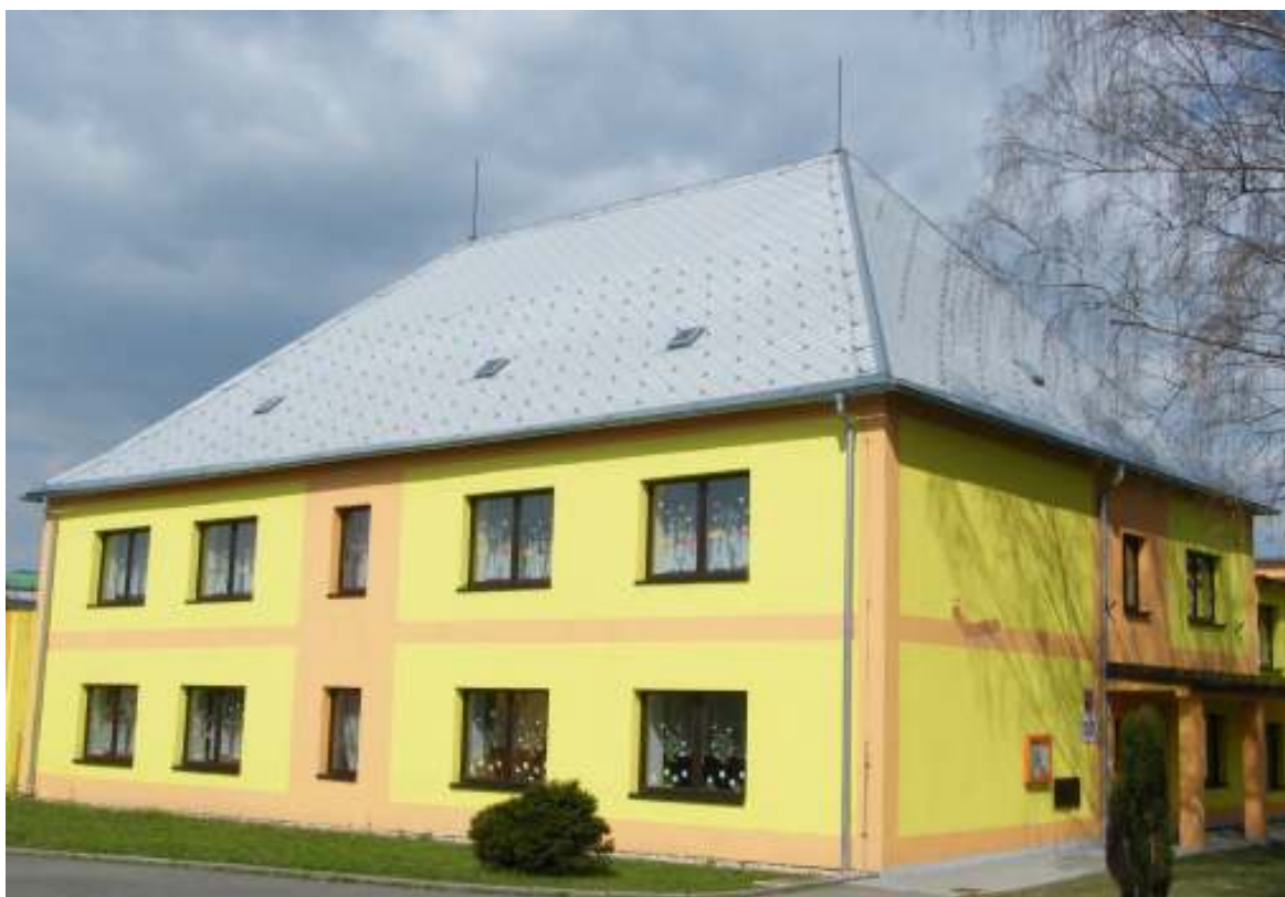
Obecná a měšťanská škola, stav dnes