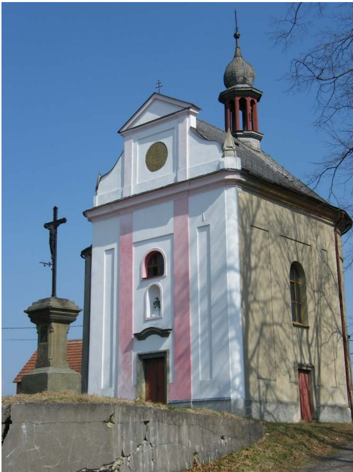
Kaple sv. Jana Nepomuckého