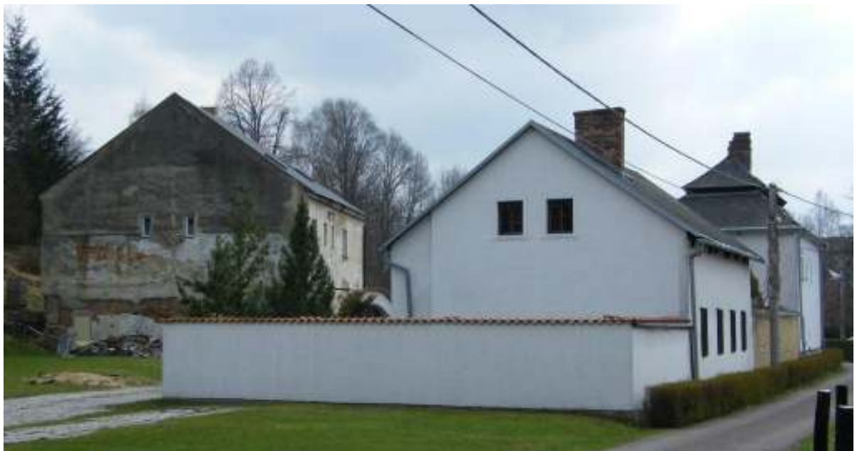
Pozůstatky mlékárny, dnes obytná stavení