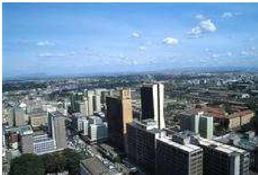
Obr. č. 1: Moderní část Nairobi