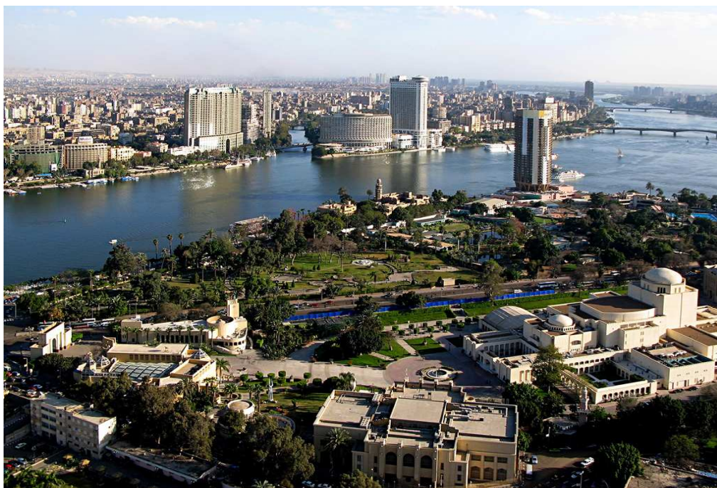
Obr. č. 3: Pohled na Káhiru