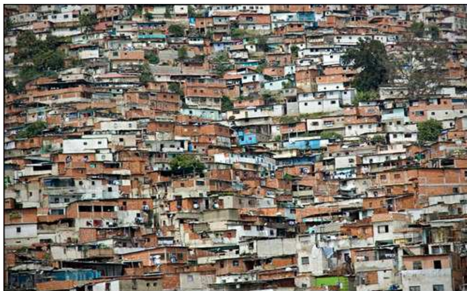
Obr. č. 8: Slum v Caracasu