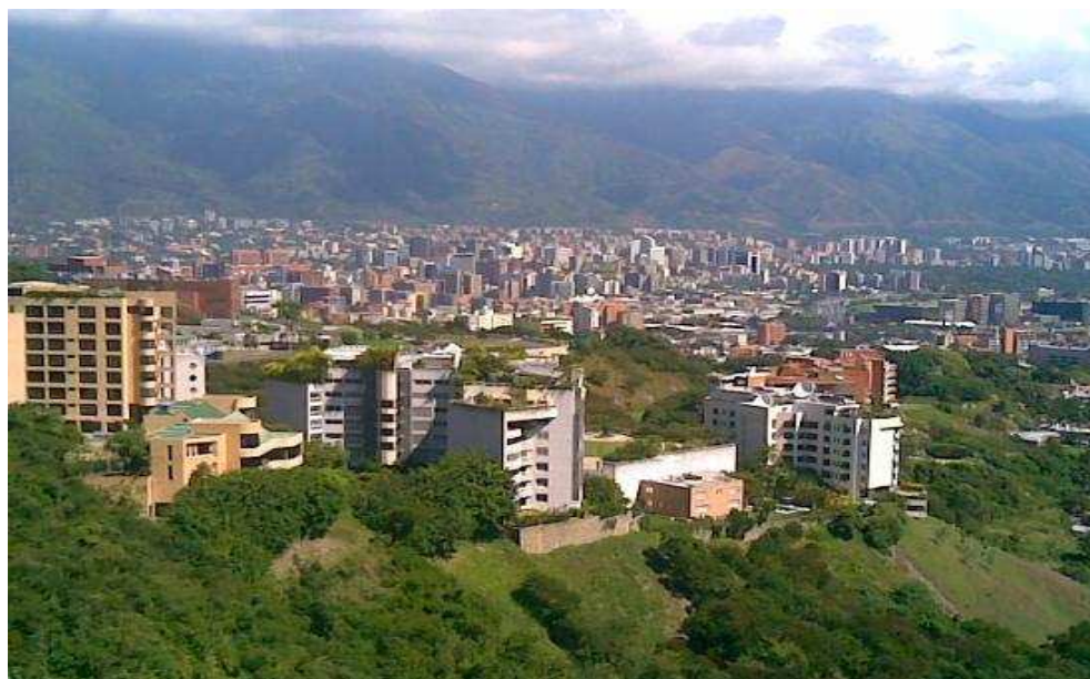
Obr. č. 7: Caracas