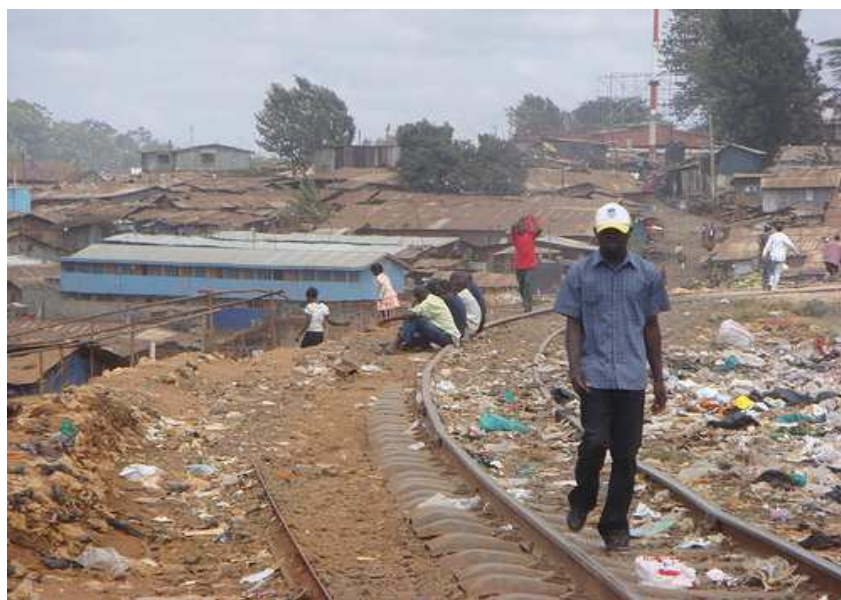
Obr. č. 2: Jeden z pohledů na periferii hlavního města Nairobi na slum Kibera

http://www.world66.com/africa/kenya/nairobi/lib/image/change?newimage=/africa/kenya/nairobi/nairobi_city >.