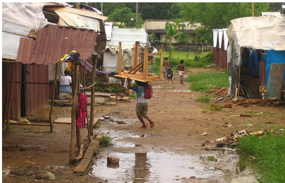
Obr. č. 6: Část slumu v Colombu