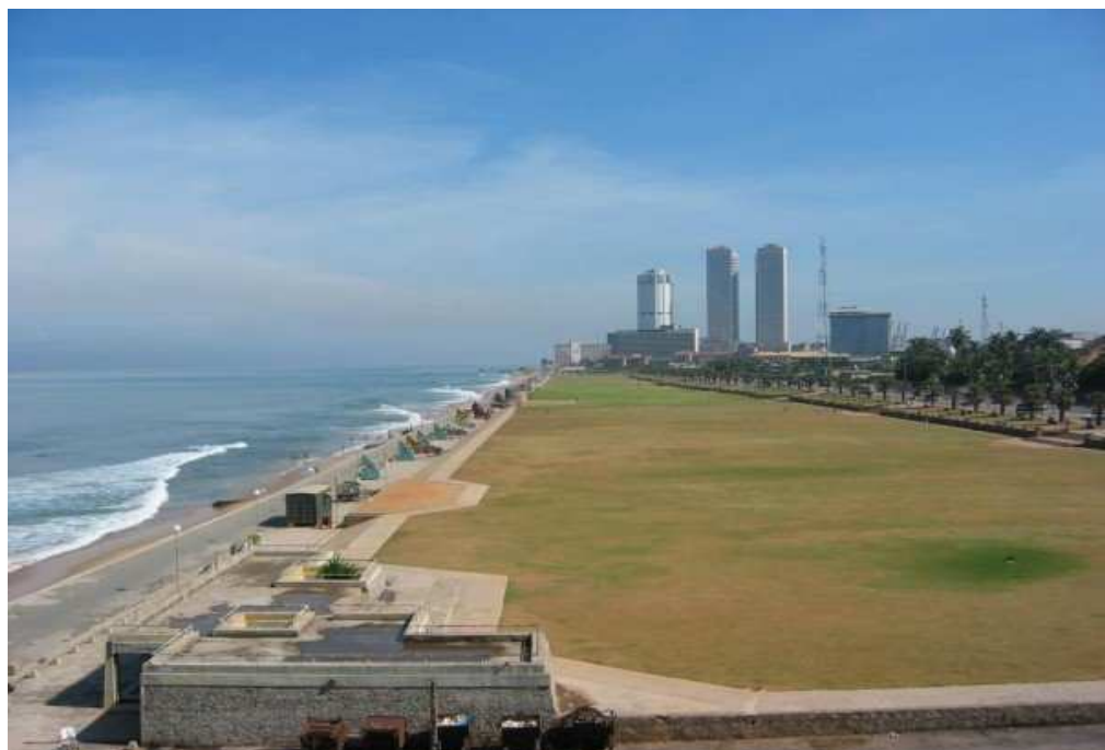
Obr. č. 5: Pohled na Colombo