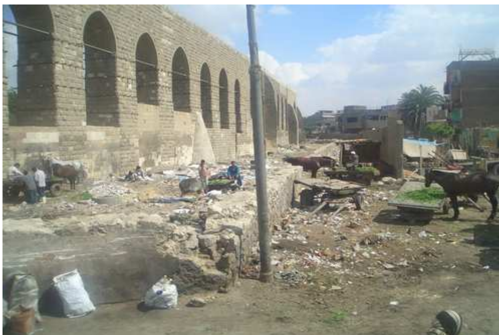
Obr. č. 4: Část slumu v Káhiře