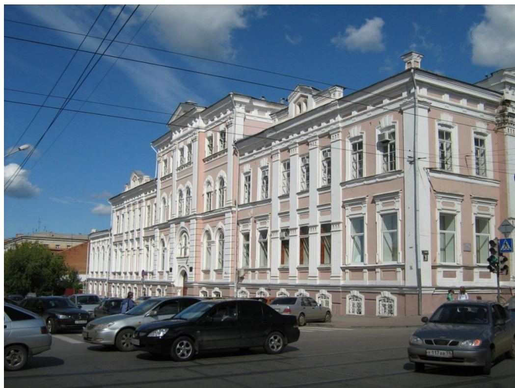
Obr. č. 4: Permská státní akademie umění a kultury.