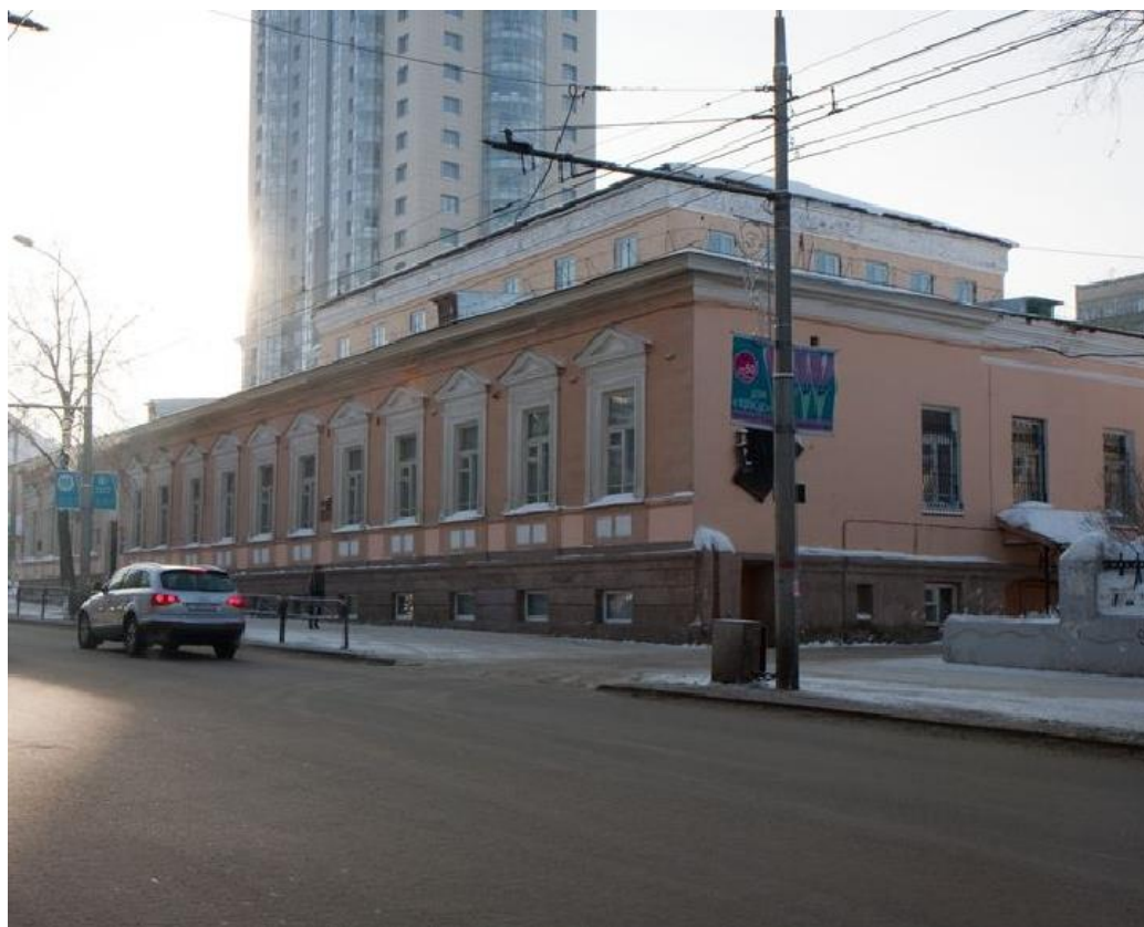
Obr. č. 7: Ďagilův dům