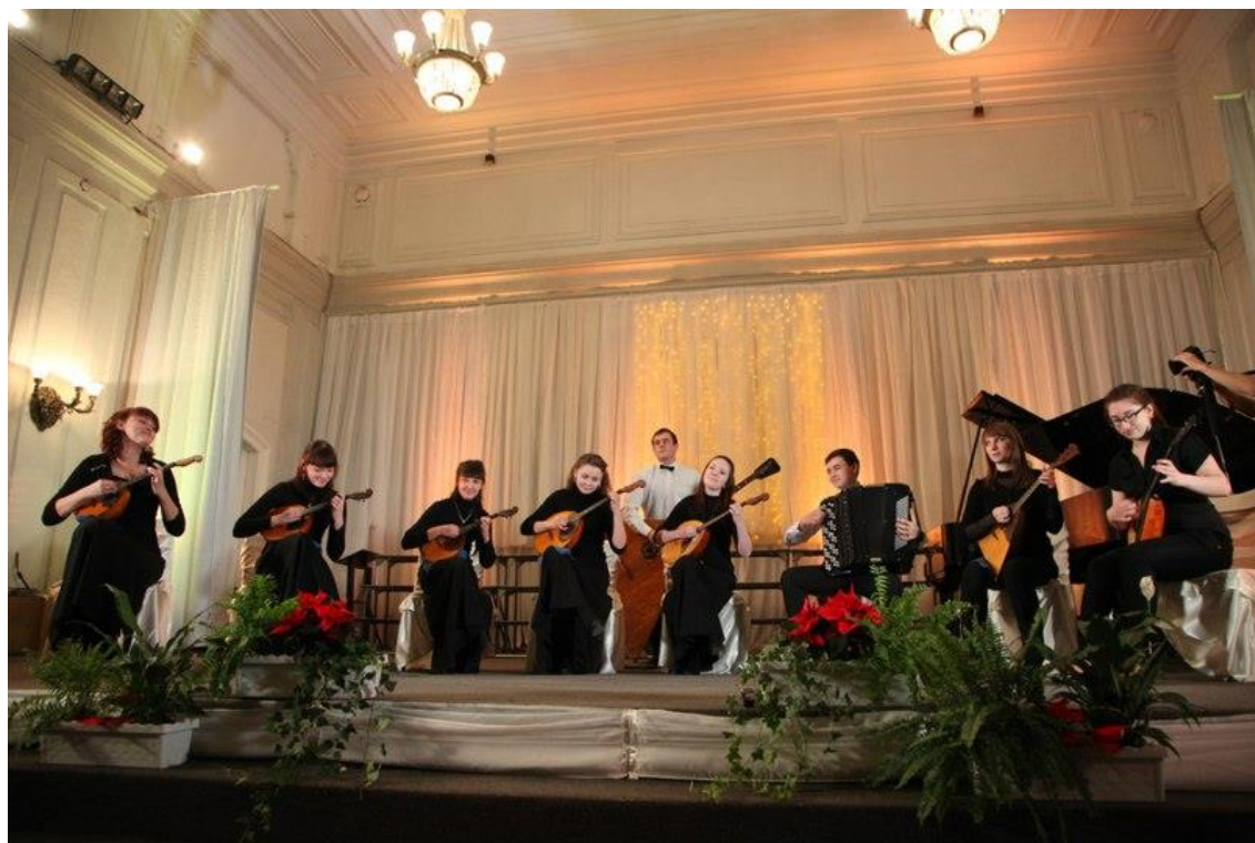
Obr. č. 7: Interpreti lidových nástrojů v koncertní hale Permského hudebního koleje