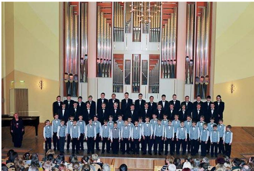
Obr. č. 3: Vystoupení Sborové chlapecké kapely v Permské varhanní koncertní hale.