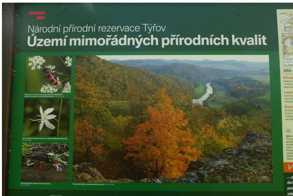
Obrázek č. 2 Informační cedule – Národní přírodní rezervace Týřov.

Národní přírodní rezervace je vymezena v zákoně č. 114/1992 Sb., o ochraně přírody a krajiny jako „menší území mimořádných přírodních hodnot, kde jsou na přirozený reliéf typickou geologickou stavbou vázány ekosystémy významné a jedinečné v národním či mezinárodním měřítku.“ Vymezení a základní ochranné podmínky národních přírodních rezervací (NPR) jsou pevně stanoveny v právním rámci, konkrétně v §28 až §32 zákona o ochraně přírody a krajiny. Tyto ustanovení zakazují veškeré aktivity, které by mohly poškodit či zničit přírodní objekt, zahrnující například vstupování mimo vyznačené cesty či táboření. Samotné zřizování NPR spadá do pravomoci Ministerstva životního prostředí České republiky, které má pravomoc poskytnout výjimky z uvedených podmínek ochrany v případě potřeby. V současné době je na území České republiky vyhlášeno celkem 110 národních přírodních rezervací, mezi známé patří např. Žofínský prales, šumavský Boubínský prales či pralesovitá rezervace Hojná voda (Česko, zákon č. 114/1992 Sb.; AOPK ČR 2024).