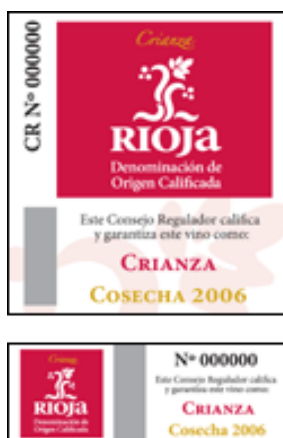
Obrázek 1: Certifikace vín DOC

Tak jako další evropské země, i Španělsko vytvořilo zákon kontrolující produkci vína. V roce 1926 vešel v platnost zákon o kontrole produkce vína, vinných regionů a oficiální označení oblasti La Rioja. Proces tvorby pravidel byl dokončen v roce 1972 tím, že byl stanoven úřad, Instituto Nacional de Denominaciones de Origen (INDO) a bylo zavedeno označení Denominación de Origen (DO). Systém je podobný francouzskému Appellation d'origine contrôlée (AOC), portugalskému systému Denominação de Origen Controlada (DOC), nebo italskému Denominazione di origine controllata (DOC). Aktuálně je ve Španělsku 69 DO, každé z nich má vlastní tzv. Consejo regulador, který kontroluje jejich fungování. Je to lokální autorita, která provádí dohled nad produkcí vína, značením vín a jejich distribucí. Aktivita těchto 69 lokálních kontrolních úřadů je koordinována INDO. Tento dohled obnáší určení hranic jednotlivých vinařských oblastí, dovolené variace, výnos z hektaru, kvašení, proces stárnutí, obsah alkoholu a informace uváděné na etiketách. Po vstupu Španělska do Evropské Unie, musely projít změnou i zákony týkající se vinařství a vína, vzhledem k požadavkům EU. V roce 1988 bylo do zákona přidáno označení Denominación de Origen Calificada (DOC) (Spanish Wine).