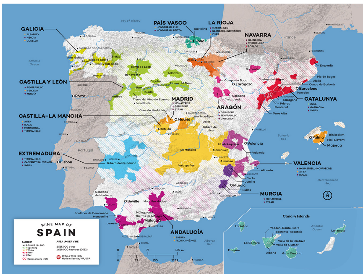
Obrázek 3: Mapa vinařských oblastí Španělska

Segre, Dehesa del Carrizal, El Hierro, Domino de Valdepusa, Empordà -Costa Brava, Finca Elez, Getariako Txakolina, Gran Canaria, Jerez-Xérès-Sherry, Jumilla, La Gomera, La Mancha, La Palma, Lanzarote, Málaga a Sierras de Málaga, Manchuela, Madrid, Méntrida, Mondéjar, Monterrei, Montilla-Moriles, Montsant, Navarra, Pago Guijoso, Penedès, Pla del Bages, Pla i Llevant (Mallorca), Priorat, Rías Baixas, Ribeira Sacra, Ribeiro, Ribera del Duero, Ribera del Guadiana, Ribera del Júcar, Rioja, Rueda, Somontano, Tacoronte Acentejo, Tarragona, Terra Alta, Tierra de León, Tierra del Vino de Zamora, Toro, Utiel-Requena, Valdeorras, Valdepeñas, Valencia, Valle de Güimar, Valle de Orotava, Ycoden-Daute-Isora, Yecla, Vinos de Pago, Pago Señorío de Arinzano (Casa, 2010).