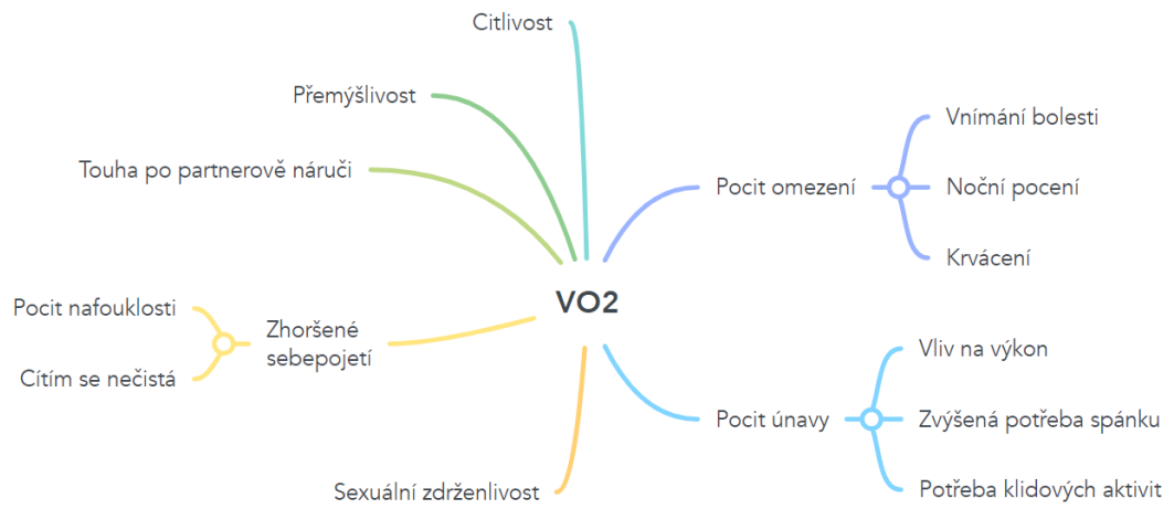
Obrázek 2: Myšlenková mapa VO2