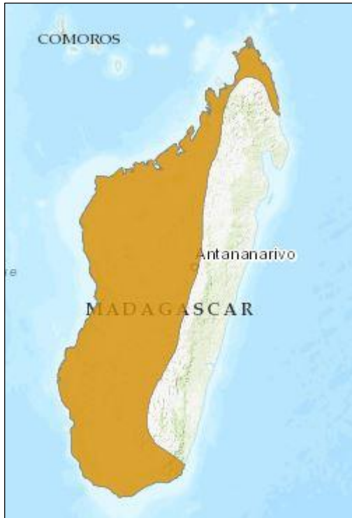
Obr. 2: Mapa výskytu pro druh Trachylepis elegans

(The IUCN Red List of Threatened Species)