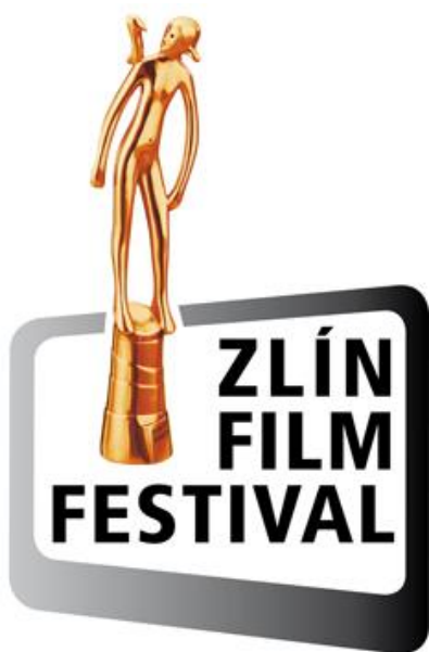
Obr. 19 Logo Zlín film festivalu

Filmový festival pro děti a mládež Zlín je velmi vhodnou možností pro zpestření výuky, a to nejen díky tomu, že se promítání filmových snímků odehrává nejen ve Zlíně, ale i v celé řadě dalších měst republiky. Když se podíváme na program posledního ročníku, tak zde můžeme vidět celou řadu filmových snímků, které nejen že jsou vhodné jako ukázky pro občanské nauky, český jazyk a literaturu v tématech rétoriky, prezentace a komunikace, ale také v předmětech přírodovědných. Jako příklady filmů můžeme uvést filmy At' žijí duchové! 56 který by vhodně podtrhl předmět občanská výchova v tématu hodiny například sdružování dětí a žáků, kde jsou ve snímku pionýři. Dále také je vhodnou ukázkou, jak byl tráven čas dětí před více než čtyřiceti lety. Ukázkou do přírodovědných oborů může být například snímek Čingischánovi děti 57 .