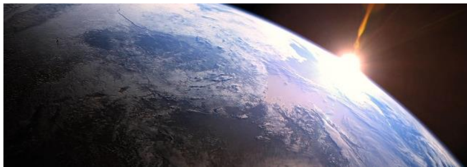
Obr. 14 Zázračná planeta

Možným tématem pro diskusi v rámci výuky jsou nejen místa a informace známé, ale i naopak zcela neznámé. Názory studentů na dané ekosystémy apod. Dalším rozšířením pro výuku mohou být i další díly z dílny BBC, jako například Modrá planeta, která je opět velmi vhodná pro výuku zejména přírodopisných a zeměpisných předmětů.