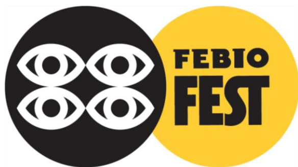
Obr. 22 Logo FEBIOFEST

Febiofest, díky prezentacím filmů v mnoha městech jak v České, tak i Slovenské republice, nabízí pedagogům velkou škálu možností, jak zpestřit žákům a studentům výuku jejich předmětů. Studenti nemusí cestovat přímo do Prahy, ale mohou vybrané filmy sledovat i v jim bližších městech. Filmové ukázky mohou obohatit výuku dle žánru soutěžních a prezentovaných filmů, avšak pro Český jazyk, Rétoriku, Komunikaci, Občanskou výchovu a obdobné předměty se ukázky najdou prakticky vždy, neboť lze na jednotlivých snímcích rozebrat nejen děj, jednotlivé postavy, období, prostředí, ale i chování, způsob mluvení a přednesu.