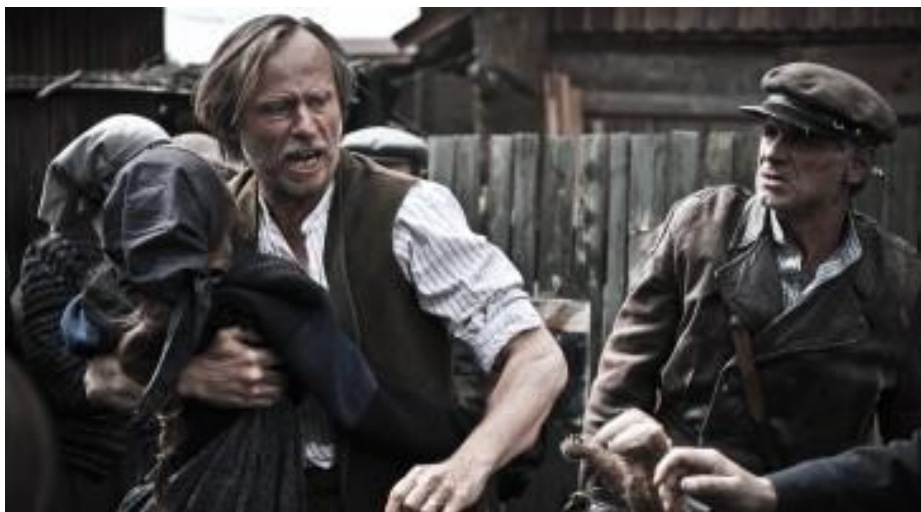
Obr. 16 Habermannův mlýn

Toto kontroverzní téma – odsun Němců je velmi obávanou oblastí pro řadu autorů knih i filmového zpracování. Mnozí o tomto tématu neradi mluví a je to obecně vzato mezinárodním tabu. Filmové zpracování je vhodné zejména do hodin dějepisu do tématu druhé světové války, jak ovlivnila chápání a chování Čechů a Němců. Co se v té době dělo a jaké to mělo příčiny a následky. Film může být nápomocný pro lepší pochopení tehdejší doby, proč se kdo takto choval, jaké mělo být to „správné“ chování, názory studentů nejen na tehdejší dobu, ale zejména na politickou situaci. Dalším doplňujícím a zlehčujícím tématem pro toto téma může být opět zapojení studentů do problematiky – zda znají nějaké místo/osoby, které touto událostí byly poznamenány/pamatují si na ni (např. z vyprávění).