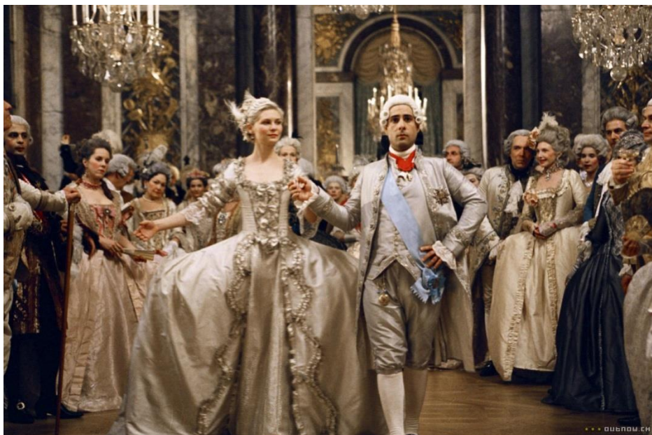
Obr. 17 Marie Antoinetta (2006)

Pro ukázkou, jak by mohla být zasazena filmová ukáзка z filmu Marie Antoinetta , se můžeme podívat na přílohu č. 8, Návrh na přípravu hodiny dějepisu na středních školách. Výuková hodina zaměřená na Francii v 18. století a zejména pak na Velkou francouzskou revoluci může být obohacena právě zmiňovaným filmem. Z filmové ukázky, ať už jakkoliv dlouhé, dle výběru pedagoga, by pro studenty bylo patrné zejména chování a oblékání francouzské smetánky a jakým způsobem se lidé v tehdejší době chovali a co vedlo k samotnému zvratu v dějinách nejen Francie, ale i celé Evropy.