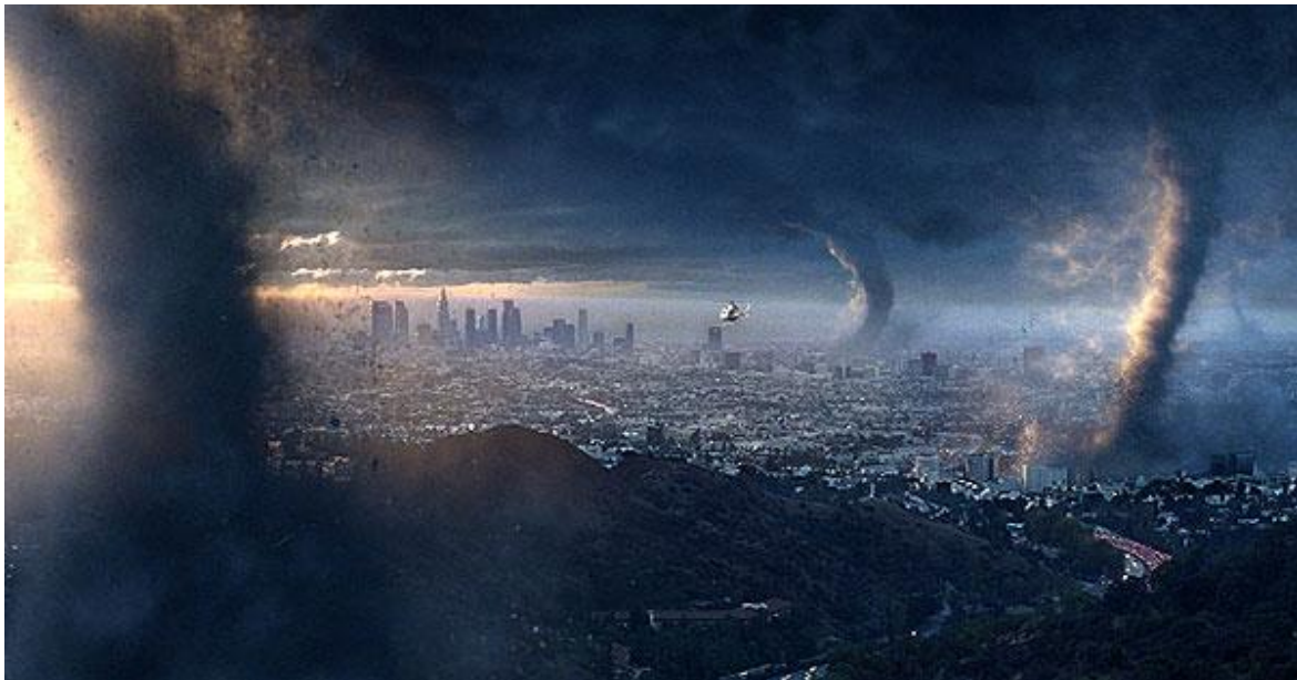
Obr. 15 Den poté (2004)

Návrh na přípravu na hodinu předmětu přírodopis na středních školách pro téma Klimatické změny nalezneme v příloze č. 7. V rámci této hodiny bude probírána problematika nejen klimatických změn obecně, ale také, jaký na ně mají vliv chování nás, obyvatel planety Země. Důležitým bodem, který je nutné při výuce zmínit, je právě udržitelnost, neboť si každý z nás musí uvědomit, že na planetě nežije sám a že po nás tu budou naše děti a děti našich dětí. Ukázka z filmu Den poté bude vhodným doplněním a prezentací právě takovéto situace, kdy se začne klimatický systém země hroutit.