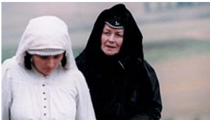
Obr. 1 Dceřina kletba

Příloha č. 1 obsahuje návrh možné přípravy na hodinu českého jazyka a literatury, kdy bude tématem hodiny autoři Karel Jaromír Erben a Božena Němcová. V rámci této hodiny lze využít výše zmíněný snímek, resp. Jeho část, baladu Dceřina kletba (samozřejmě lze i jinou dle výběru vyučujícího). Při rozboru díla bude kladen důraz zejména na rétorické prvky jako rytmika, provázanost jednotlivých veršů, přímá řeč, dále pak metafory.