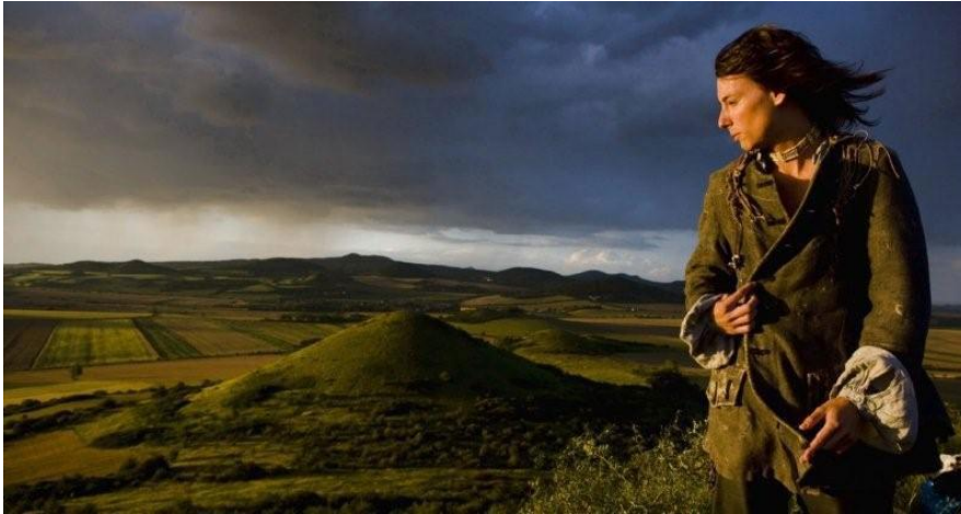
Obr. 2 Máj (2008)