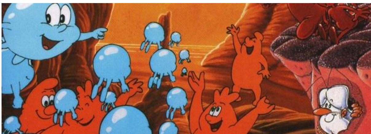
Obr. 5 Byl jednou jeden život

V hodině přírodopisu na základních školách s tématem Srdce může být využita ukázka právě ze sedmého dílu řady Byl jednou jeden život . Příloha č. 3 obsahuje návrh na přípravu na tuto hodinu, kdy hlavním cílem hodiny je seznámit a naučit žáky vše o nejdůležitějším orgánu v lidském organismu, a s tím související informace. Aby si žáci mohli lépe představit tento pro lidské oko skrytý orgán, bude použita výše zmíněná ukázka, která zábavnou a hlavně lehko pochopitelnou formou demonstruje, jak to v srdci vypadá, co s ním souvisí atd.