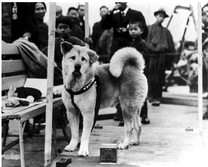
Obr. 4 Hačiko

co naopak nesmí, jak se chovat ke psům nejen vlastním, ale i cizím a v neposlední řadě je dobré pro výchovu neopomenout zvířecí útulky, jejich činnost a prospěšnost.