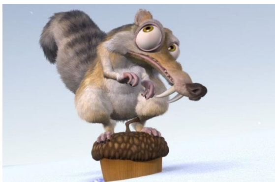
Obr. 6 Doba ledová – Veverka

Pro výuku jako takovou není třeba používat celý film, ačkoli by to asi žáci ocenili, ale pouze vhodně zvolené úseky do tematického bloku učiva. Žáci by pak nejen měly nadnesenější a volnější způsob výuky dané problematiky, ale také by mohli zábavným způsobem hledat a nacházet nové druhy a poznávat nové způsoby života v daném období. Hlavním přínosem, který si může divák z celého snímku odnést, je porovnání stávající doby a doby ledové.