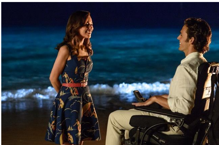
Obr. 13 Než jsem tě poznala

na hodinu, kdy bude se studenty probírána právě problematika handicapovaných osob, přístup k těmto lidem a chování dalších osob v jejich přítomnosti. Toto je důležitým tématem, které by mělo být se studenty probráno, neboť stávající „uspěchanou“ dobu stále více doprovází lidská bezohlednost a sobeckost vůči druhým v našem okolí. Každý by se měl zamyslet nad tím, jaký má život a neodsuzovat lidi jen podle vzhledu, rasy, handicapu apod.