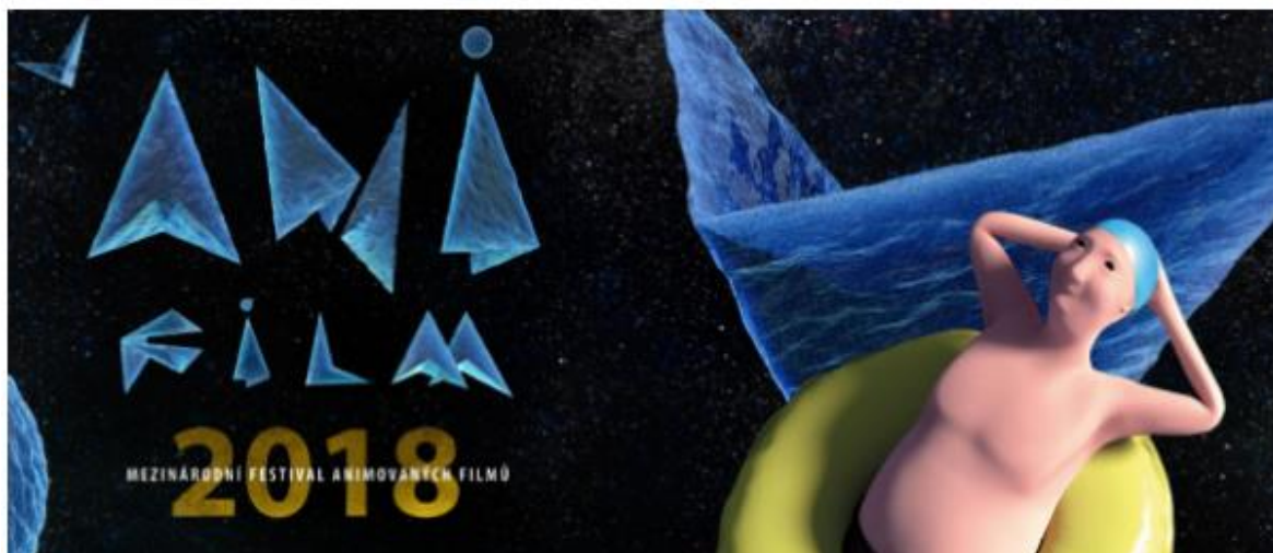
Obr. 21 Anifilm 2018