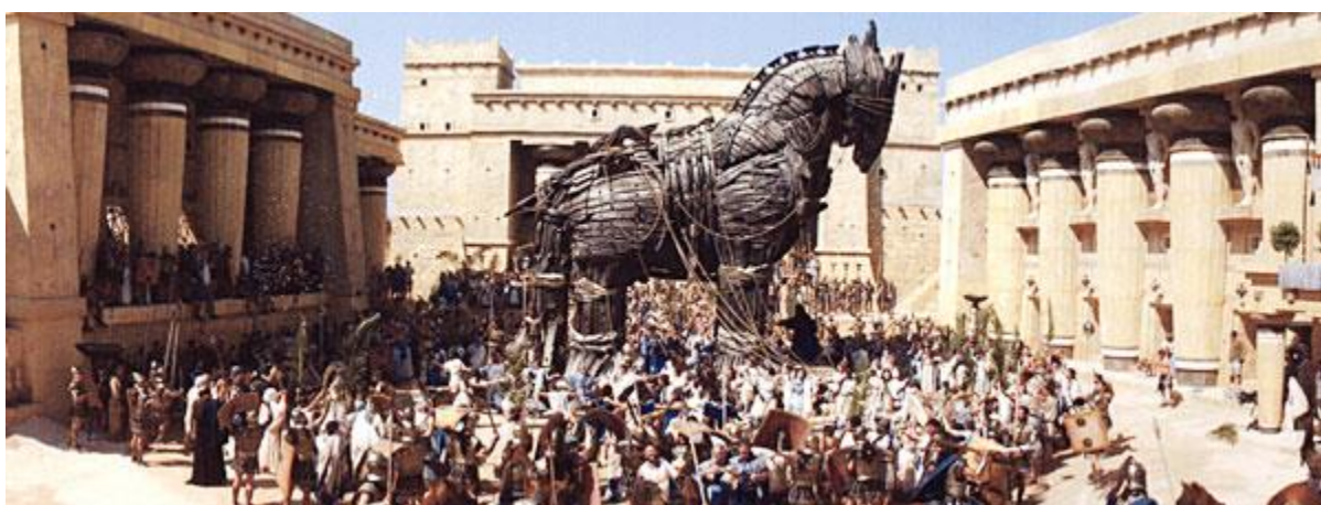
Obr. 8 Troja

Při hodině dějepisu s tématem o antické době a starověkých městech, může pedagogům pomoci při výuce právě zmiňovaný film Troja , který žákům demonstruje nejen tehdejší vzhled architektury, lidí, ale také přiblížit chování osob a průběh válek. Pedagog si může vybrat jakýkoliv úsek ze zmiňovaného filmu pro nenásilnou prezentaci tehdejší doby. Návrh pro tuto hodinu je připraven v příloze č. 4.