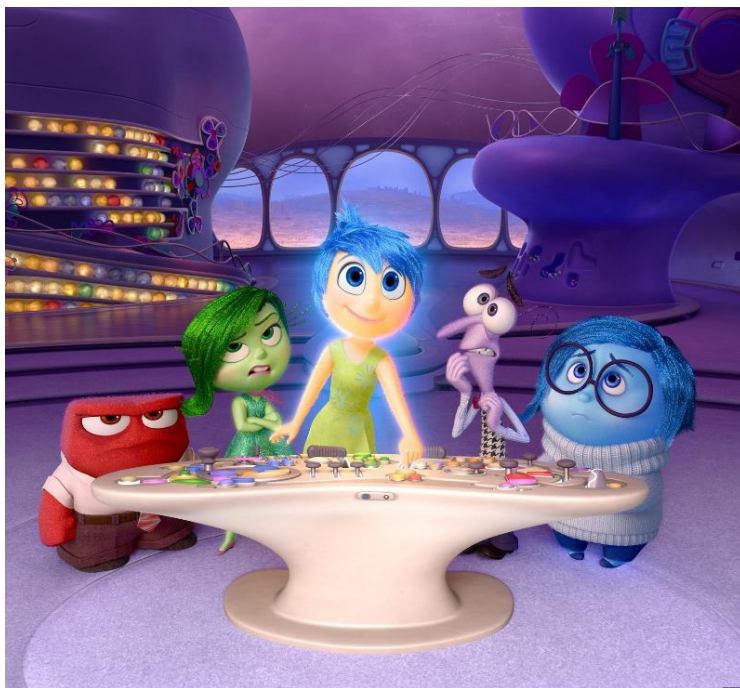
Obr. 3 V hlavě

Příloha č. 2 obsahuje návrh přípravy na hodinu občanské výchovy na téma Emoce a temperament. V rámci této hodiny bude se studenty probírány jednotlivé druhy emocí, chování lidí, jednotlivé podněty a s tím související vztahy mezi jedinci. Nedílnou součástí hodiny budou i informace o známých vědcích a osobnostech v souvislosti s emocemi a temperamentem. Pro zpestření hodiny pak bude využita ukázka z filmu V hlavě , kde budou žákům prezentovány emoce radost, strach, hněv, znechucení a smutek a jejich chování na vypjatou situaci.