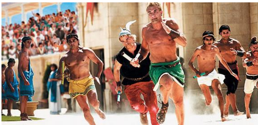
Obr. 9 Asterix a Olympijské hry