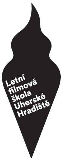
Obr. 20 Logo Letní filmová škola Uherské Hradiště