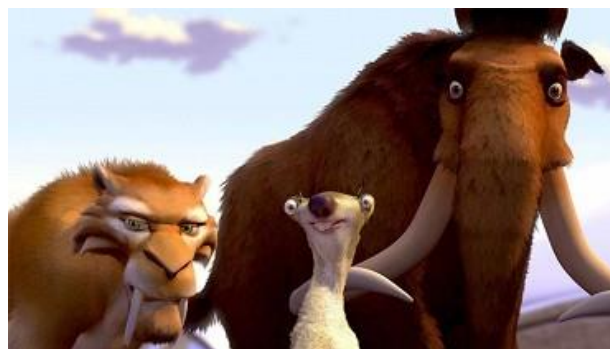
Obr. 7 Doba ledová - hlavní postavy