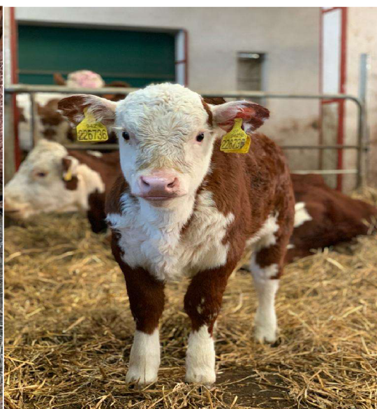
Fotografie č. 3 - od pani Mirky tele plemene Hereford