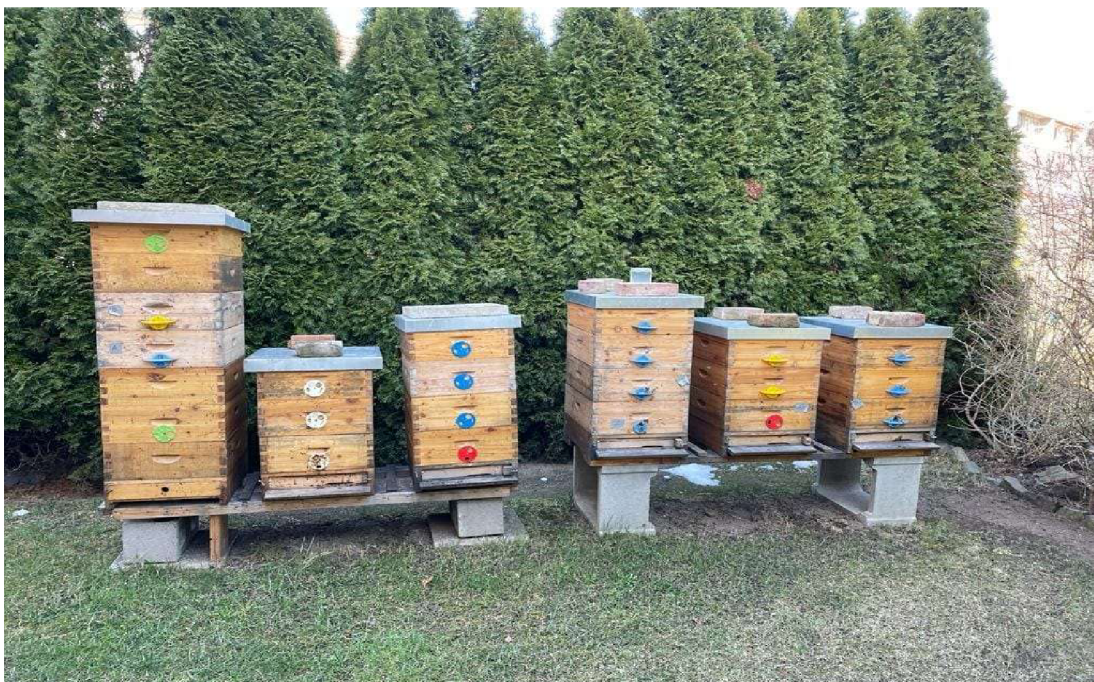
Fotografie č. 1- od pana Miloslava úly