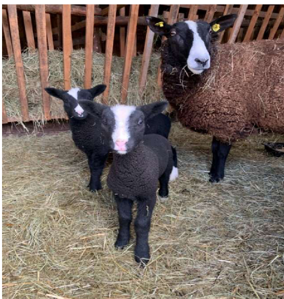
Fotografie č. 2 - od pani Mirky ovce plemene Zwartbles