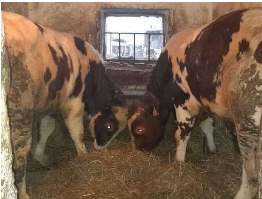
Fotografie č. 5 - od pana Matěje krávy