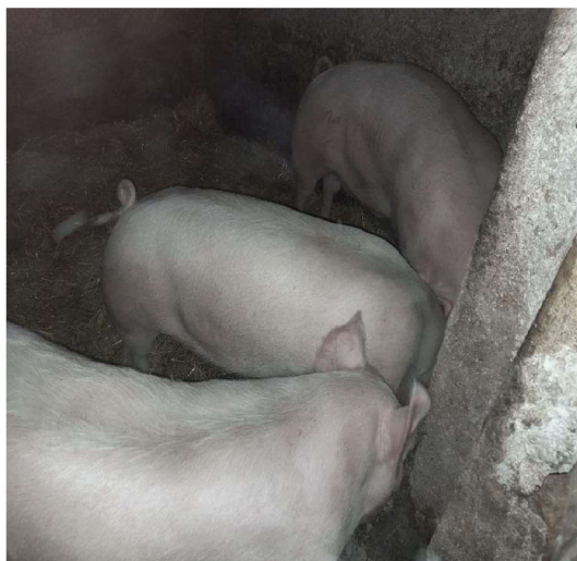
Fotografie č. 6 a č. 7 - od pana Matěje kuřata a prasata domácí