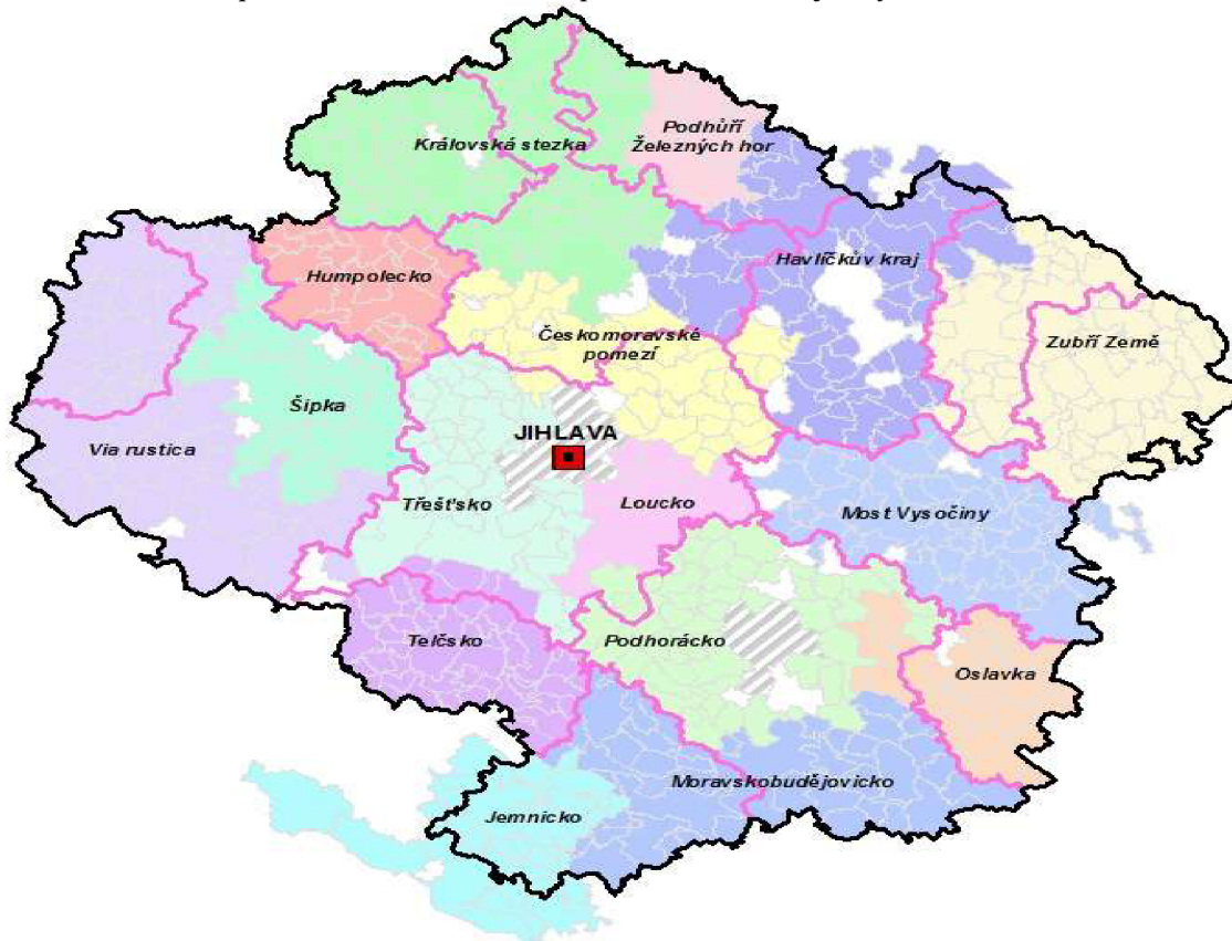
Obrázek č. 3 – Mapa místních akčních skupin na území kraje Vysočina