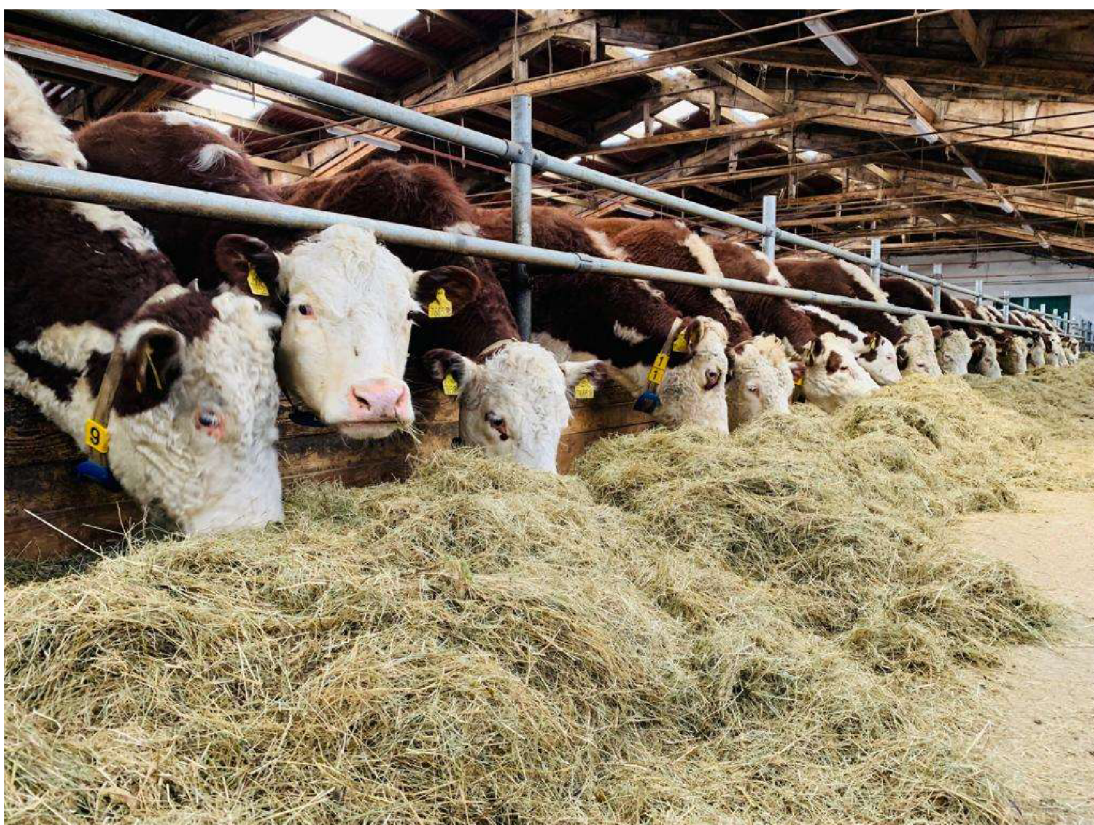
Fotografie č. 4 - od pani Mirky krávy plemene Hereford