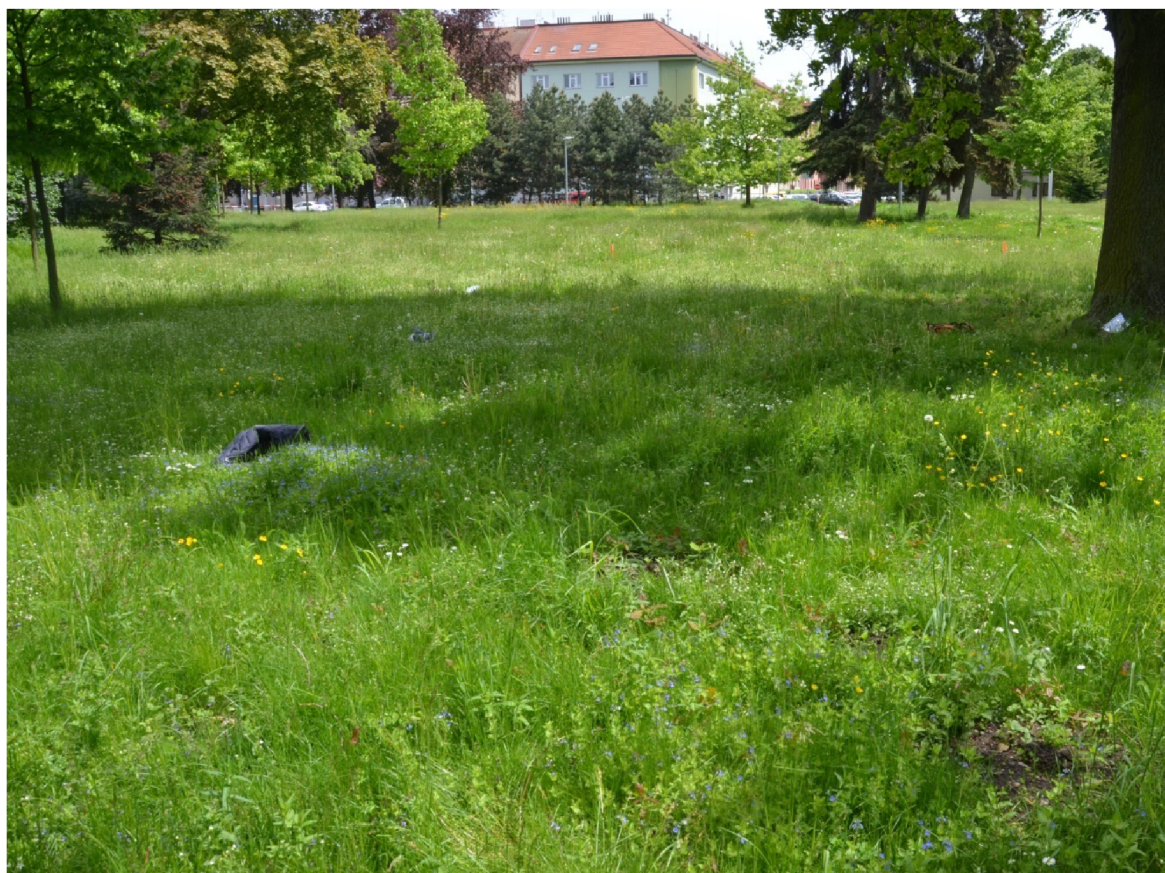
Foto 2: Lokalita: Mezofilní trávník (26. 05. 2020)