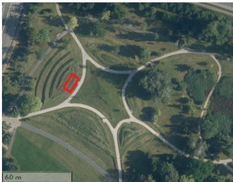
Obr. 4: Suchý (semixerotermní trávník) – vyznačeno červeně