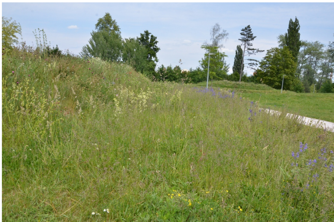
Foto 3: Lokalita: Suchý (semixerotermní) trávník (26. 05. 2020)