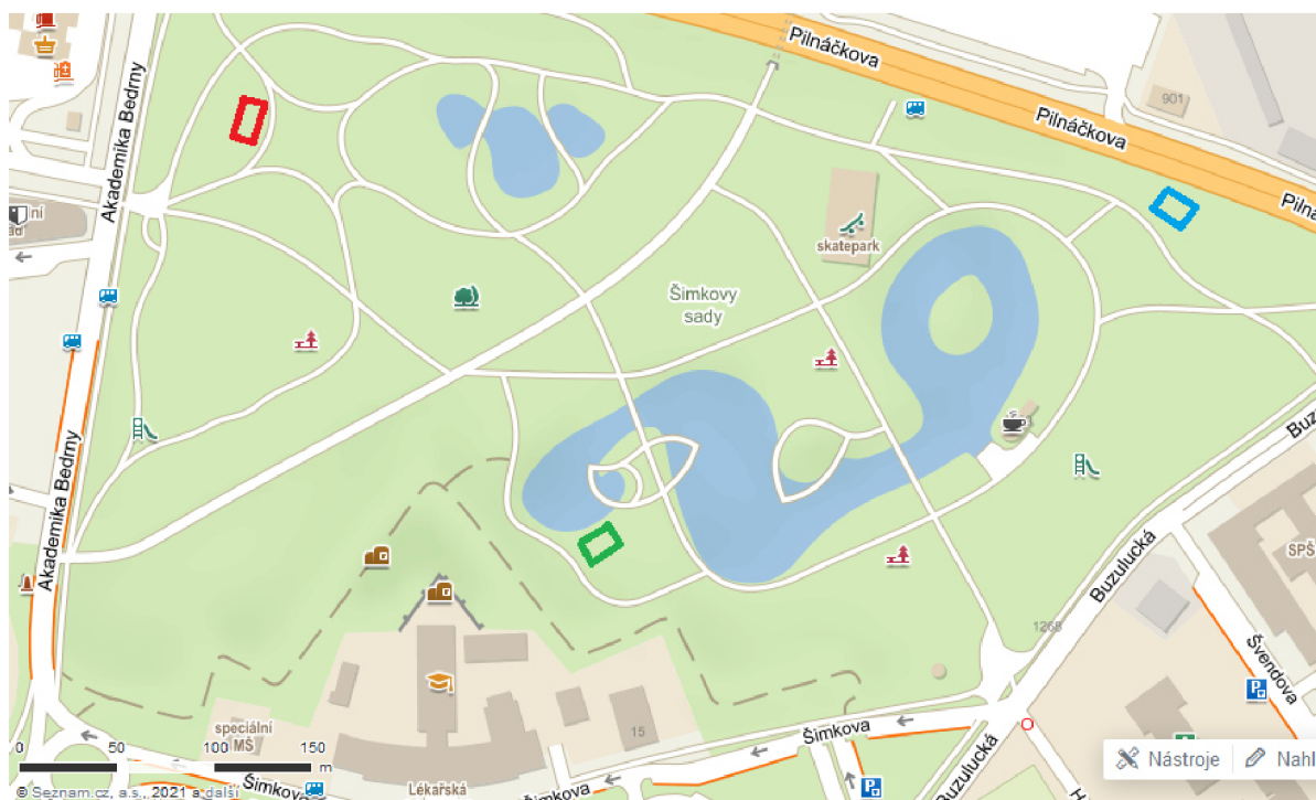
Obr. 1: Mapa s vyznačenými lokalitami – vlhký mezofilní trávník (zeleně), mezofilní trávník (modře), suchý (semixerotermní) trávník (červeně)

Pro vliv výsevu poloparazitických rostlin na druhovou diverzitu trávníků byly vybrány Šimkovy sady v Hradci Králové. Šimkovy sady jsou nejrozsáhlejším královéhradeckým parkem s rozlohou 18 ha a jeho návrh zpracoval Josef Gočár v roce 1925. Byl navržen v anglickém parkovém stylu a je doplněn umělými jezírky. V Šimkových sadech byly vybrány tři specifické lokality na základě místních charakteristik, jako je vodní režim nebo osluněnost a zástin. Podle těchto parametrů byly zvoleny lokality: 1) vlhký mezofilní trávník, 2) mezofilní trávník a 3) suchý (semixerotermní) trávník (Obr. 1). Na vybraných lokalitách byla provedena fotodokumentace pomocí fotoaparátu Nikon D7000. Autor práce je zároveň autorem všech fotografií.