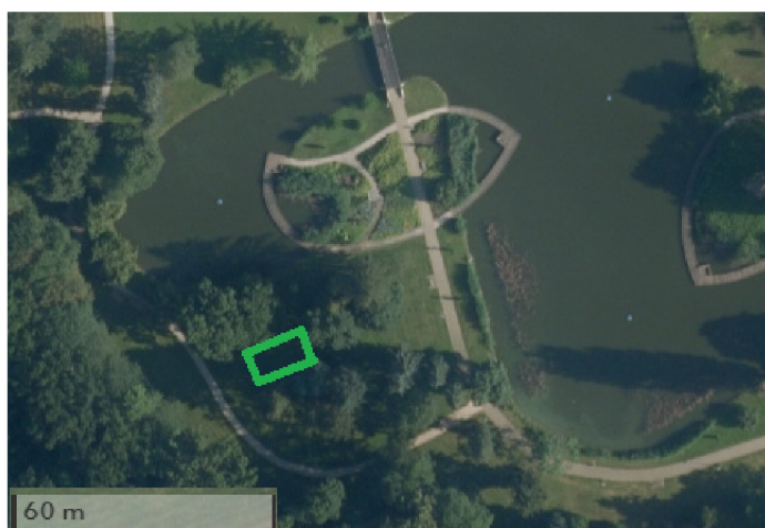
Obr. 2: Lokalita vlhký mezofilní trávník – vyznačena zeleně

Vlhký mezofilní trávník (Foto 1.) se nachází v jižní části Šimkových sadů v Hradci Králové blízko uměle vytvořené parkové vodní plochy. Značná část sledovaných ploch je během vegetační sezóny kryta pod korunami vzrostlých stromů ( Acer platanoides ), což má za následek nižší vypařování vody z travního porostu a přispívá to k poměrně dobrému vodnímu režimu na lokalitě a výskytu rostlin, kterým tento vodní režim vyhovuje ( Lysimachia nummularia ). Celkové vysoké zastínění na lokalitě svědčí výskytu stínomilnějších druhů ( Aegopodium podagraria ). Na sledované lokalitě vlhký mezofilní trávník se celkový počet cévnatých druhů rostlin pohyboval okolo 40 druhů na 25 m 2 . Průměrná pokryvnost na lokalitě byla 92 %. Celkový počet nalezených jednoděložných a dvouděložných rostlin byl 59 druhů. Naměřená průměrná výška porostu byla 5 cm. Mezi dominanty z trav patřily Lolium perenne , Poa trivialis , Poa pratensis , pokud se jedná o dvouděložné byliny, nejvíce byly zastoupeny Glechoma hederacea a Bellis perennis .