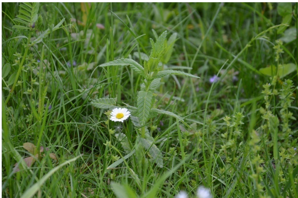
Foto 4: Semenáček kokrhele luštince ( Rhinanthus alectorolophus ) (24. 06. 2021)