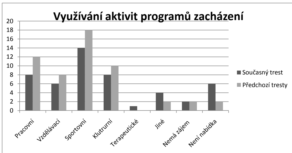
Graf č. 1 k otázce č. 3 a 4

Otázky v dotazníku jsem postavil tak, aby se v určitých oblastech nemuseli respondenti fixovat pouze na výběr předepsaných možností. V otázkách, které by mohly přispět k tvorbě nových aktivit programů zacházení, jsem záměrně ponechal prostor pro vyjádření případných konstruktivních návrhů, které by mohly být akceptovány odbornými pracovníky a zapracovány do resocializačních programů. Z otázek, ze kterých vyplynuly nejpodstatnější informace, jsem zpracoval i grafické znázornění.