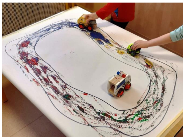
Obrázek 53 – Metodický list č. 11