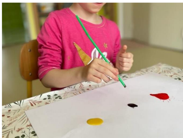
Obrázek 29 – Klárka, Metodický list č. 6