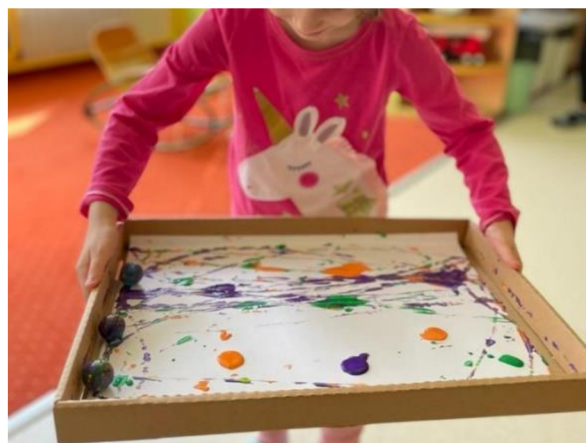
Obrázek 18 – Klárka, Metodický list č. 4