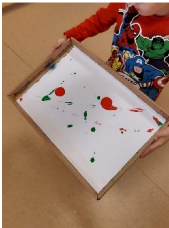
Obrázek 24 – Erik, Metodický list č. 4