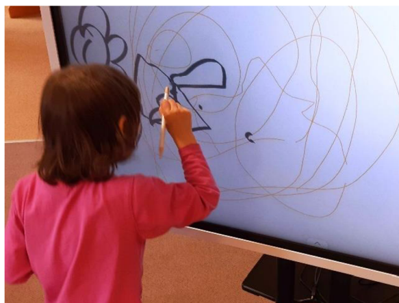
Obrázek 36 – Klárka, Metodický list č. 7