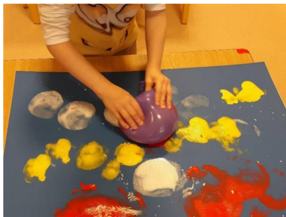
Obrázek 4 – Erik, Metodický list č. 1