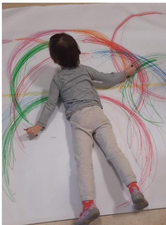
Obrázek 8 – Klárka, Metodický list č. 2