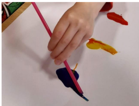
Obrázek 34 – Erik, Metodický list č. 6