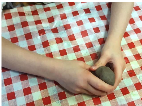
Obrázek 45 – Erik, Metodický list č. 9