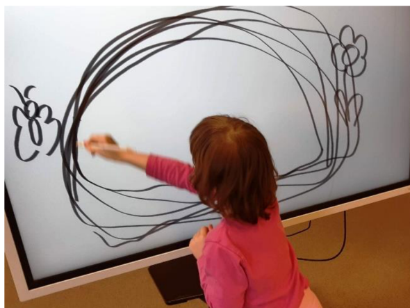
Obrázek 35 – Klárka, Metodický list č. 7