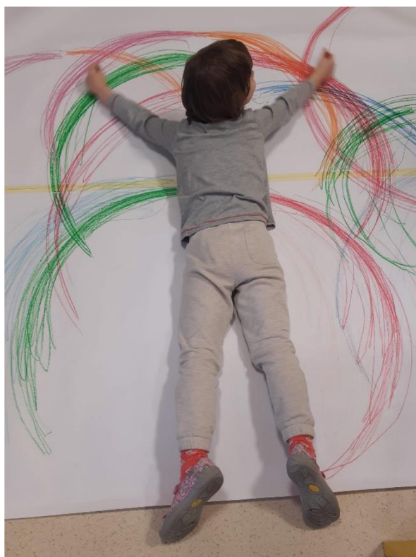
Obrázek 7 – Klárka, Metodický list č. 2

Klárku tato činnost ihned zaujala, sama si lehla na zem a hned zkoušela kreslit oběma pažemi. Po chvíli byla patrná únava a Klárka začala preferovat kresbu pravou rukou. Levou sice zapojila, ale jen jako zautomatizovaný pohyb. Také začala zrakem fixovat pohyb pravé ruky a je patrný i větší přítlak na psací pomůcku. Tato činnost byla pro Klárku zajímavá a hodnotím ji kladně.