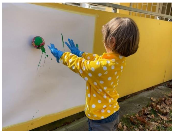
Obrázek 14 – Klárka, Metodický list č. 3