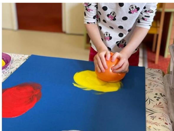
Obrázek 1 – Klárka, Metodický list č. 1

Klárku je snadné motivovat k výtvarným činnostem, má tyto aktivity ráda. Jako problém vidím hypersenzitivní vnímání znečištění jak rukou, tak oděvu. Po každém potřísnění barvou Klárka odchází do koupelny se umýt. Po předvedení požadované činnosti Klárka ihned pochopila, co má dělat. Na výsledku výtvarného díla je patrné, že Klárka má velmi slabý přítlak na pomůcku (balónek), zřejmě z obavy o neušpinění se. Celkově tuto činnost hodnotím kladně jelikož Klárku zaujala.