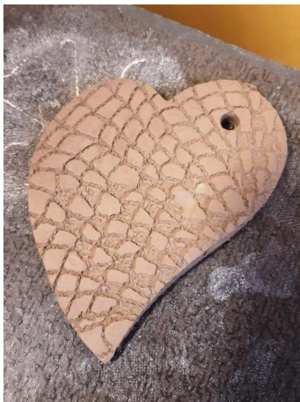
Obrázek 48 – Erik, Metodický list č. 9