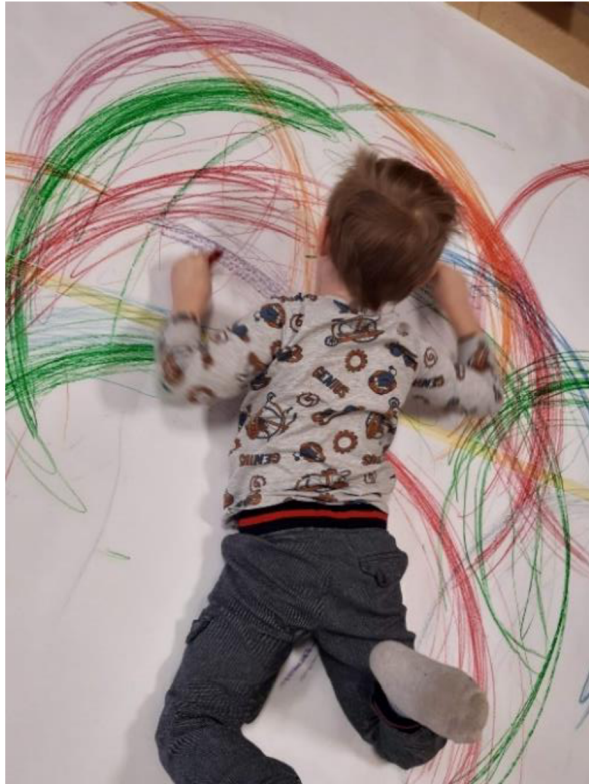
Obrázek 11 – Vít, Metodický list č. 2