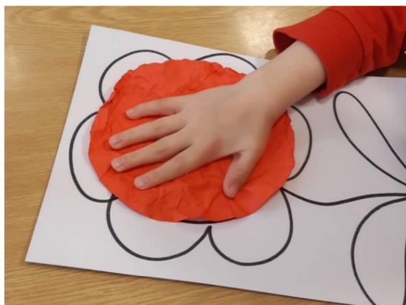
Obrázek 43 – Erik, Metodický list č. 8