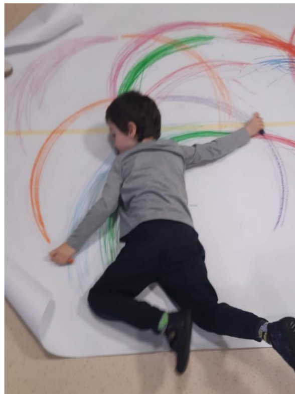
Obrázek 10 – Erik, Metodický list č. 2