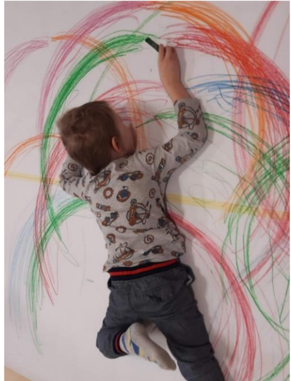
Obrázek 12 – Vít, Metodický list č. 2