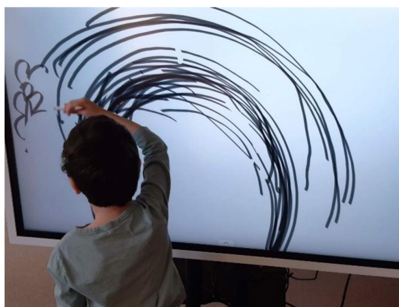
Obrázek 38 – Erik, Metodický list č. 7