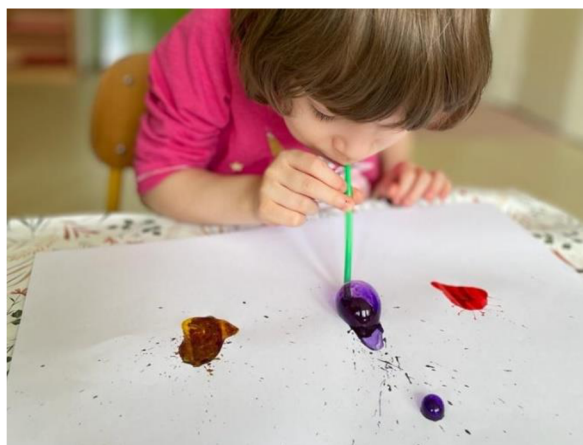
Obrázek 30 – Klárka, Metodický list č. 6