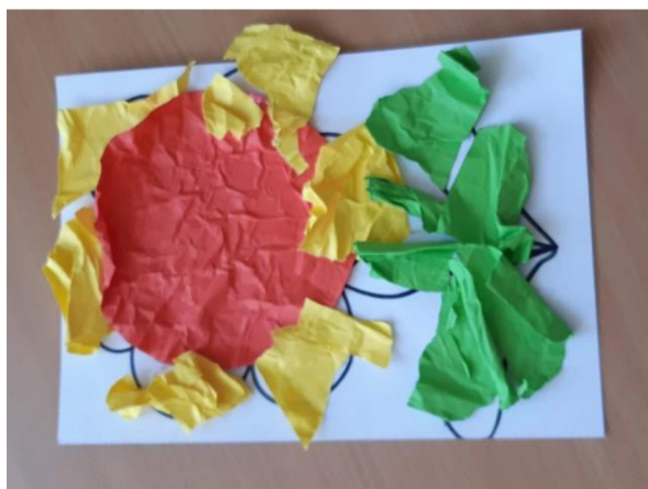
Obrázek 44 – Erik, Metodický list č. 8