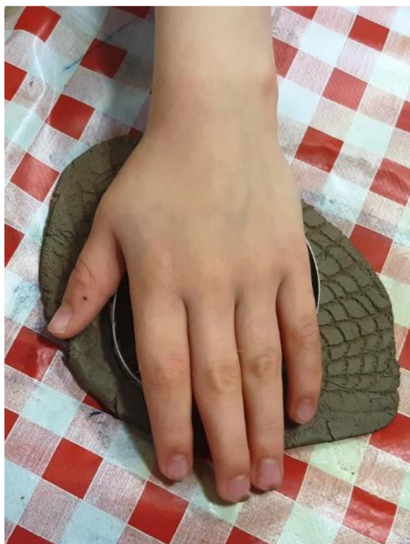
Obrázek 47 – Erik, Metodický list č. 9