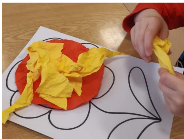
Obrázek 40 – Erik, Metodický list č. 8