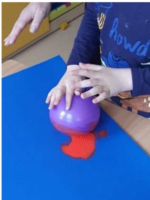
Obrázek 5 – Vit, Metodický list č. 1