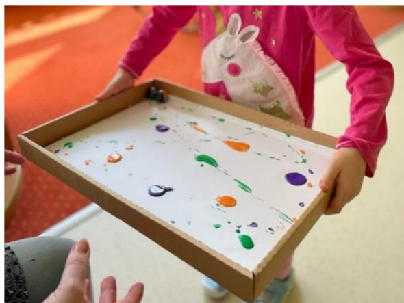
Obrázek 17 - Klárka, Metodický list č. 4

Klárku tato výtvarná činnost velmi zaujala. Nejprve jsme použili jen jednu kuličku a postupně jsem přidávala další. Klárka nejdříve víkem pohybovala jen zleva doprava, ale po předvedení pohybu dopředu a dozadu se snažila napodobit i tuto variantu. Klárka si dávala velký pozor na to, aby se neušpinila od barvy. Při pohybování víkem dopředu a dozadu začaly kuličky vypadávat a Klárka se zlobila. Otočili jsme tedy víko podélně, aby měla Klárka větší manipulační prostor a kuličky tak zůstaly ve víku. Celkově tuto činnost hodnotím kladně.