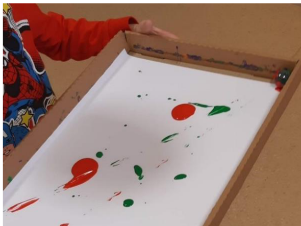
Obrázek 21 – Erik, Metodický list č. 4

Eriček ochotně přijímá nabízenou výtvarnou aktivitu. Nejprve sledoval ostatní děti, pak se sám zapojil. Čekal, až vyměním papír a nachystám barvy. Eriček začal víko nejprve naklánět dopředu a dozadu, ale stále mu kuličky vypadávaly na zem. Nebyl schopen odhadnout, jak moc může víko naklonit, aby kuličky udržel ve víku. S dopomocí Eriček pochopil i pohyb víkem zleva doprava. Pozitivně vnímám i celkovou výdrž u činnosti, která Erika velmi bavila.