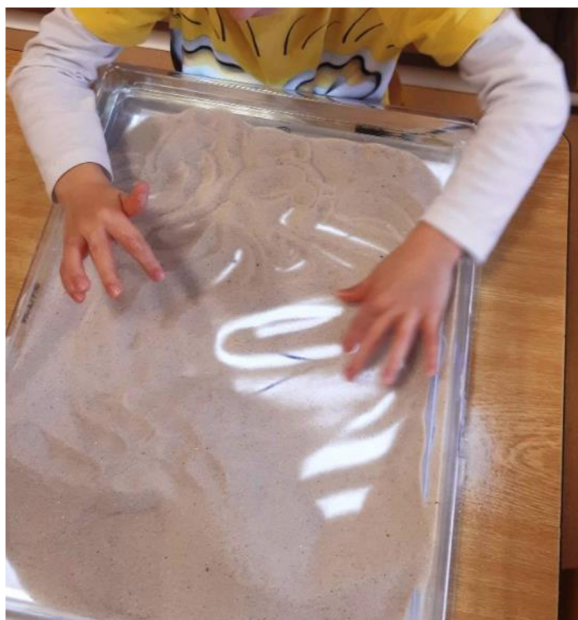
Obrázek 50 – Erik, Metodický list č. 10