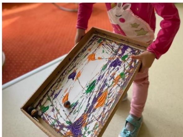
Obrázek 19 – Klárka, Metodický list č. 4