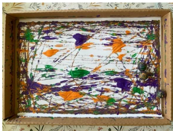
Obrázek 20 – Klárka, Metodický list č. 4