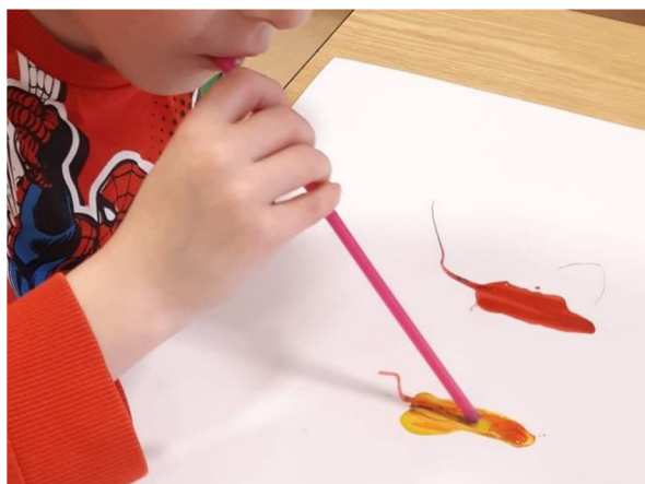
Obrázek 33 – Erik, Metodický list č. 6