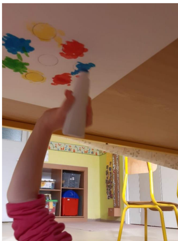
Obrázek 26 – Klárka, Metodický list č. 5