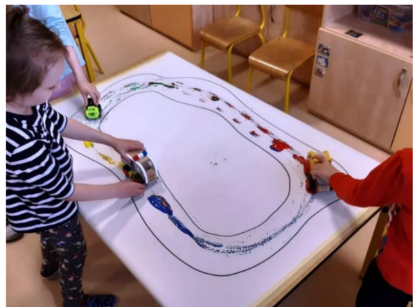
Obrázek 52 – Metodický list č. 11