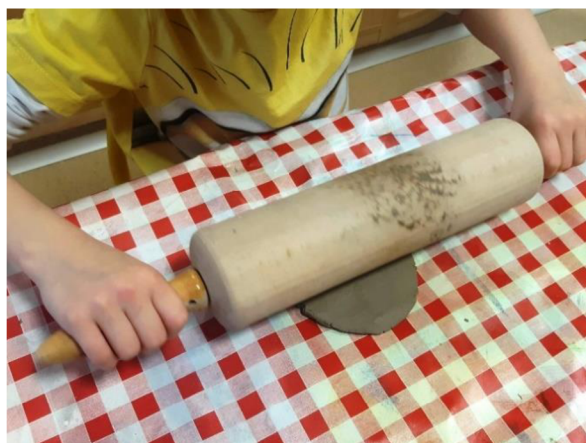
Obrázek 46 – Erik, Metodický list č. 9