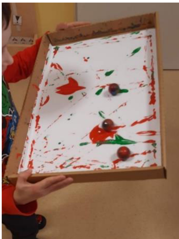
Obrázek 23 – Erik, Metodický list č. 4