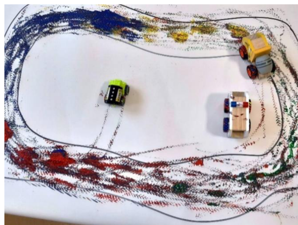
Obrázek 54 – Metodický list č. 11