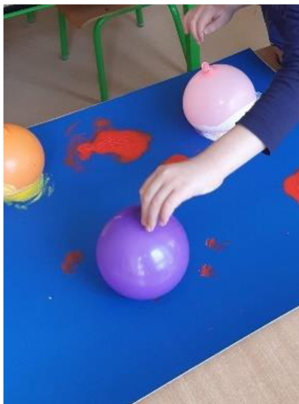
Obrázek 6 – Vit, Metodický list č. 1