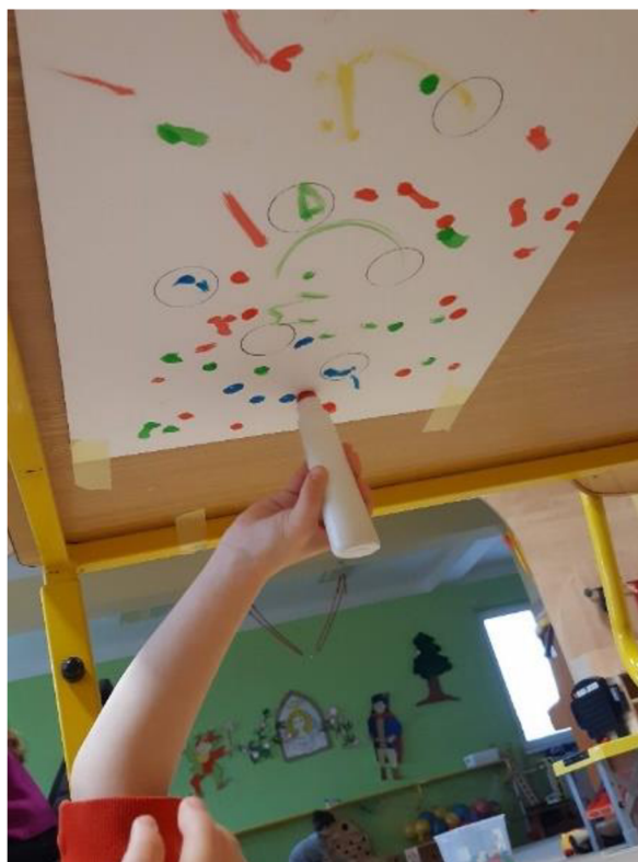
Obrázek 28 – Erik, Metodický list č. 5