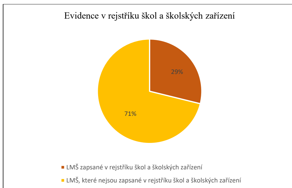
Graf 2 Evidence lesních mateřských škol v rejstříku škol a školských zařízení

Velká část lesních mateřských škol není zapsána v rejstříku škol a školských zařízení. 37 respondentů odpovědělo, že jejich zařízení není zapsáno v rejstříku, v 15 zařízeních v rejstříku zapsáno je. Poměr ukazuje následující graf.