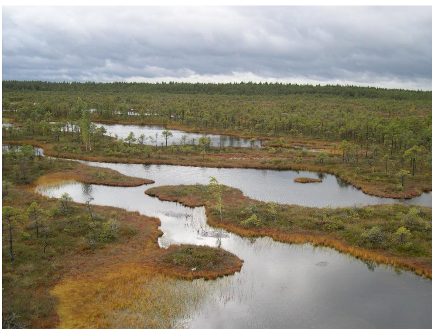
Obrázek 3: Endla bog, Estonsko (VYMAZAL, 2014)

Je také důležité začít používat sorbenty pro čištění vody od kontaminace arsenem kvůli vážnému znečištění po celém světě. Byly vyvinuty nové sorbenty na bázi přírodních materiálů, které poskytují levnou a ekologickou alternativu. Poprvé byla testována rašelina modifikovaná sloučeninami železa a humáty železa na sorpci sloučenin arsenu. Nejvyšší sorpční schopnost byla zjištěna u rašeliny modifikované sloučeninami železa. Bylo zjištěno, že sorpce různých forem arsenu byla silně závislá