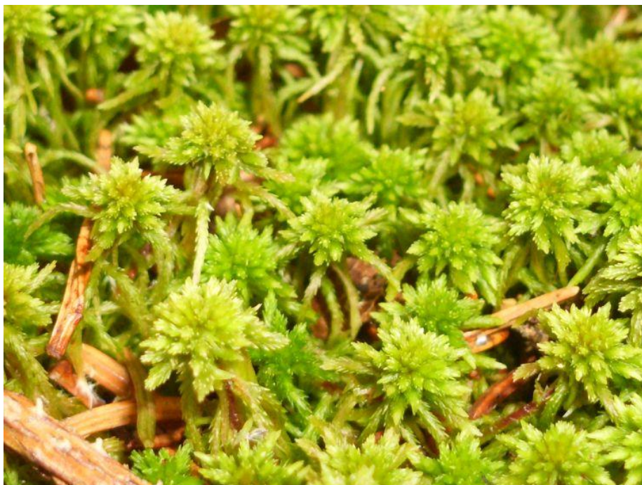
Obrázek 9: Rašelíník odchylný – Sphagnum flexuosum (LEIBELT, 2010)

jsou z praktických důvodů označovány souhrnně jako hnědé mechy (HÁJEK, HÁJEK, 2018).