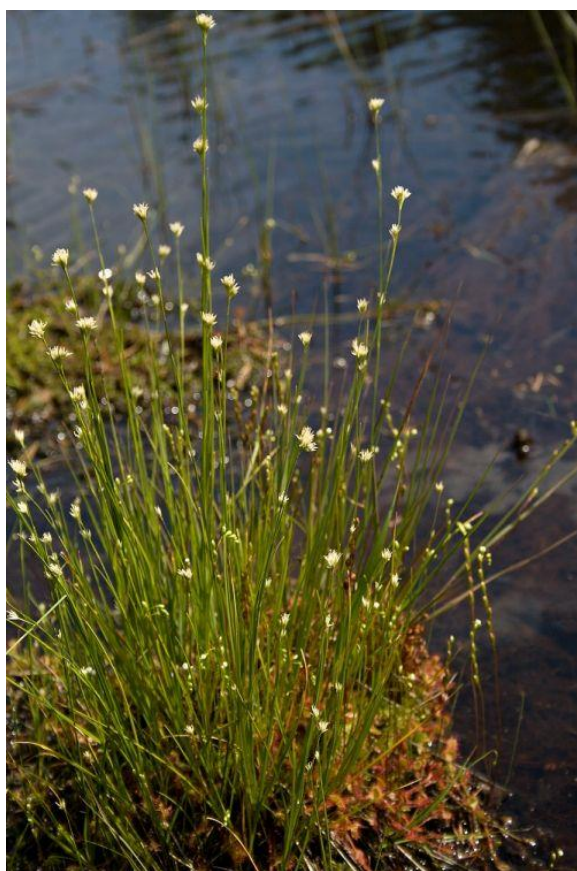
Obrázek 10: Hrotnosemenka bílá – Rhynchospora alba (DVOŘÁK, 2011)

Zrašelinělé půdy s hrotnosemenkou bílou — řídké zapojená nízkostébelná vegetace s dominujícími rašeliníky, v bylinném patře převažují vzácné hrotnosemenky (obr. 10) a jiné šachorovité rostliny, rosnatky, plavuňka zaplavovaná (CHYTRÝ a kol., 2010)