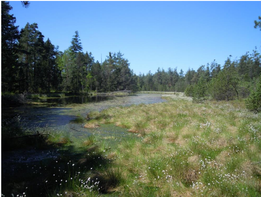
Obrázek 6: Červené blato, suchopýr pochvatý (autor, 2022)

Společenstva vrchovišť a populace vzácných a ohrožených druhů borovice blatky a rojovníku bahenního (obr. 8) jsou chráněny včetně jejich biotopů. Další charakteristickou vegetací Červeného blata představuje suchopýr pochvatý (obr. 6 a 7). Přírodní rezervace Vitmanovské rybníky je malé lesní rašeliniště, navazující na břehové porosty. Zdejší mokřady patří k nejcennějším lokalitám této části CHKO. Žijí zde vydry, hnízdí kormoráni, husy velké, chřástalové, orli mořští i řada druhů volavek a kachen. Přírodní rezervace Rašeliniště Pele je v počátečním stádiu vývoje. Území s četnými tůněmi, bylo v minulosti odvodněno a využíváno jako louky. V krajině Třeboňska dále nalezneme tyto rašeliniště: Pele, Červené, Široké, Losí, Ptačí nebo Cepské blato, Ruda, Hovízna a Žofinka. Na Třeboňsku jsou chráněna jednotlivě jako přírodní rezervace a také jako celek mezinárodní úmluvou o mokřadech (AOPK, 2023).