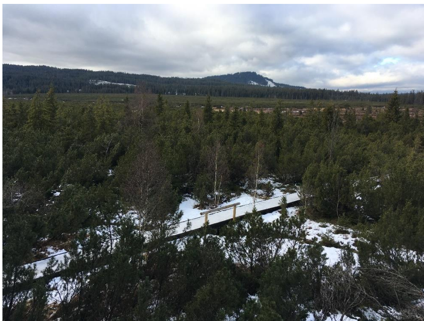
Obrázek 5: Jezerní slat' mezi Kvildou a Horskou Kvildou

Na Šumavě lze navštívit Šumavské slatě, což je souhrnný název pro rašeliniště v centrální části Šumavy nebo třeba Soumarské rašeliniště, Jezerní slat' (obr. 5) či rašeliniště Kyselov.