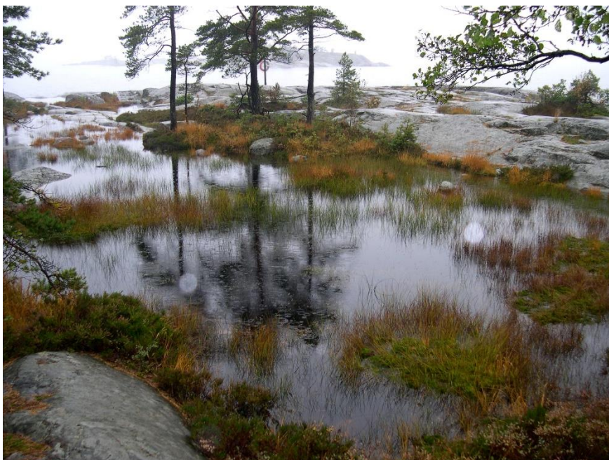
Obrázek 2: Rašeliniště Torrnsuo, Jižní Finsko (VYMAZAL, 2015)

nízká. Navíc je možné získat kovy a regenerovat rašelinu s malým vlivem na její sorpční kapacitu (BROWN a kol., 2000).