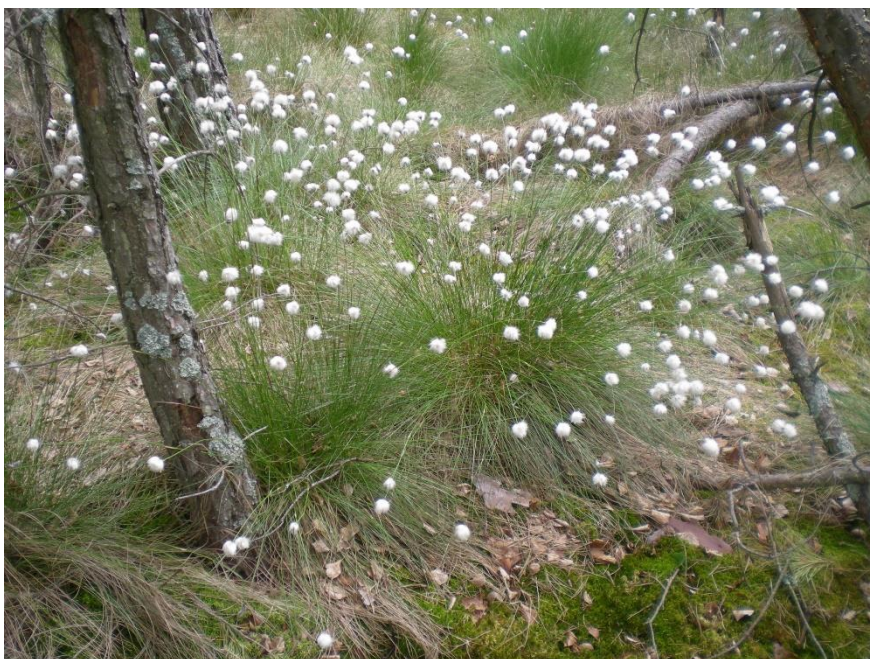
Obrázek 7: Suchopýr pochvatý – Eriophorum vaginatum (autor, 2022)