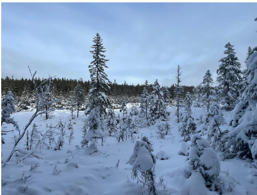
Obrázek 4: Malý Ponec u Churáňova

takový význam jako dnes, se spíše hledělo na hospodářské využití krajiny. Kvůli tomu byla většina mokřadů odvodněna a poškozena, některé dokonce zanikly a následky této doby můžeme pozorovat dodnes (NP ŠUMAVA, 2008-2023).