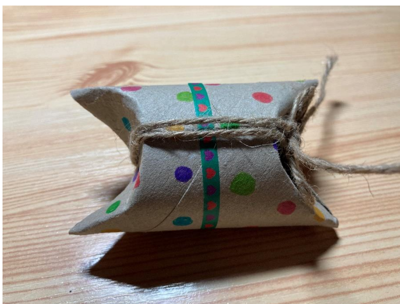
Obr. 2 Chřestidlo (vlastní tvorba, 2023)

Jedním z jich je vajíčko neboli chřestidlo. Postup je velice jednoduchý. K výrobě tohoto chřestidla budeme potřebovat ruličku od toaletního papíru nebo kuchyňské utěrky, barevné papíry či fixy na ozdobení chřestidla, dále hrst fazolek, rýže či hrášku (podle velikosti se bude lišit také zvuk chřestidla), sešívačku či provázek, lepidlo a nůžky. Ruličku si z jedné strany sešijeme sešívačkou nebo přehneme strany ruličky tak, aby se uzavřela a ruličku si ozdobíme podle vlastní fantazie. Ke zdobení můžeme využít dekorativní papíry, samolepky či fixy. Chřestidlo naplníme námi vybranými luštěninami, počet by měl být přiměřený, protože pokud do ruličky nasypeme příliš mnoho luštěnin, chřestidlo nebude vydávat téměř žádný zvuk. A jakmile chřestidlo naplníme, uzavřeme i druhou stranu ruličky. Můžeme převázat provázkem. V tuto chvíli je chřestidlo hotové a s dětmi jej můžeme využít při dalších hodinách hudební výchovy. Vyrobit si doma můžeme i mnoho dalších hudebních nástrojů, například rumba koule, mini banjo, kastaněty, flétnu aj.