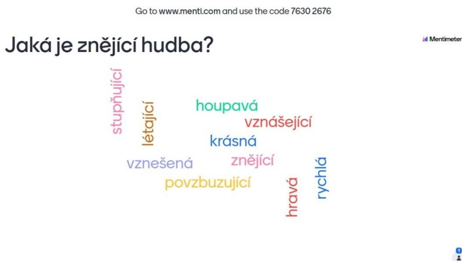
Obr. 3 Mentimeter (vlastní tvorba, 2023)

V samotném úvodu hodiny dáme žákům pokyn, aby si vzali své mobilní telefony a vyhledali stránky mentimeter.com , kde vyplní příslušný kód, který jim sdělíme (vygeneruje se automaticky po vytvoření prezentace). Následně žákům pustíme skladbu Dragon Training od skladatele Johna Powella , pro lepší zvuk využijeme funkci sdílení obrazovky. Žáci během poslechu vepisují do políček na svém mobilním telefonu (přes aplikaci Mentimeter ), jak na ně znějící hudba působí, jaká je. Po odeslání vidíme v počítači všechna slova, která žáci vymysleli. Je možné, že na každého daná hudba působí jinak, každý totiž hudbu vnímáme jiným způsobem. Proto se mohou jednotlivé odpovědi lišit a může se nám na obrazovce objevit opravdu velké množství různorodých slov. V opačném případě, tedy pokud odeslalo některé ze slov více žáků v úplně stejném znění, se na obrazovce počítače objeví ve větším provedení.