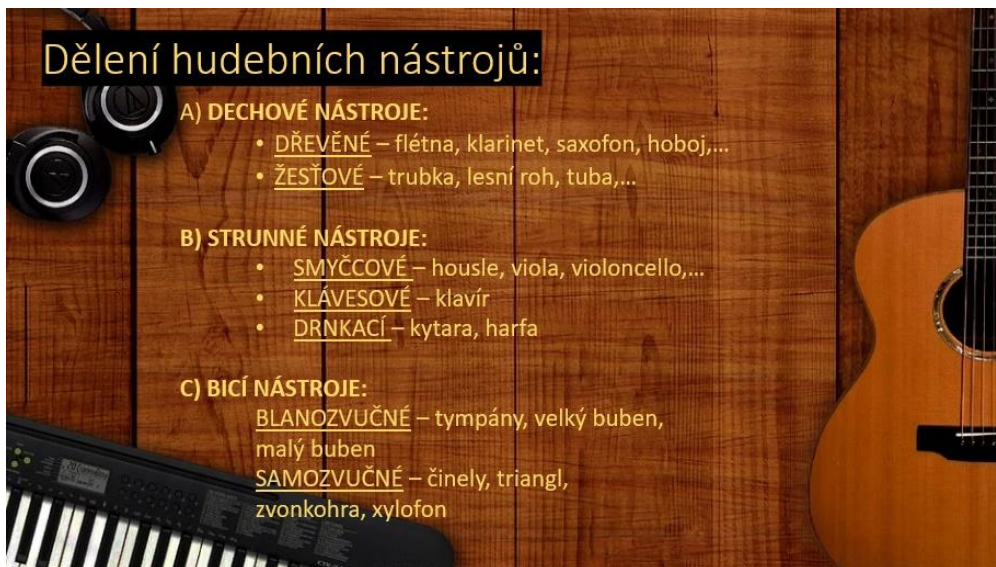
Obr. 1 Dělení hudebních nástrojů (vlastní tvorba, 2023)

Prezentaci můžeme obohatit o obrázky jednotlivých nástrojů, aby žáci dokázali přiřadit názvy konkrétního nástroje ke správnému obrázku.