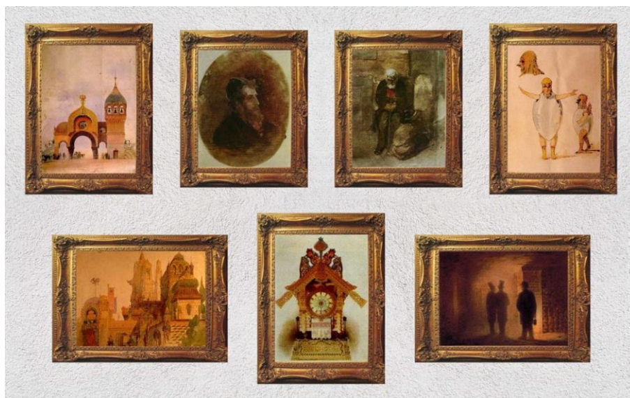
Obr. 5 Obrázky z výstavy (Victor Hartmann, 2018)