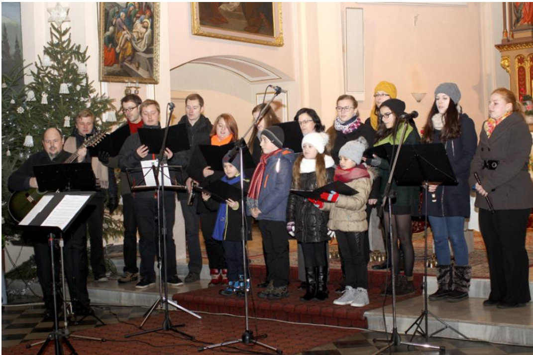
Příloha č. 8: Schola při kostele sv. Vavřince Píšť 82