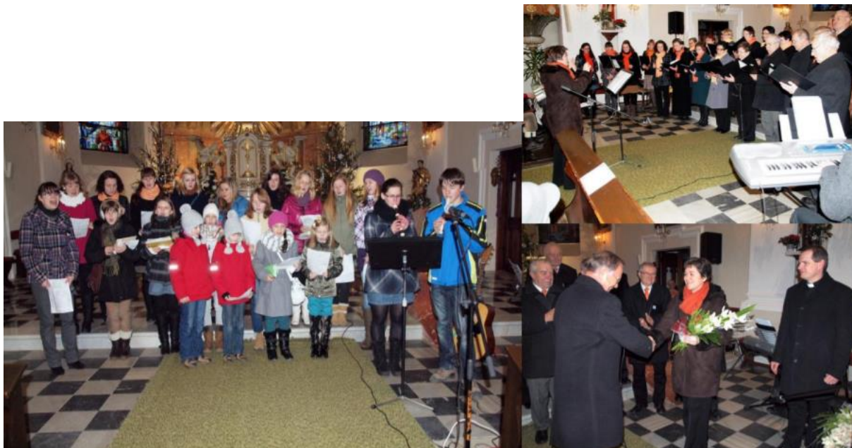
Příloha č. 5: Chrámový sbor a schola při kostele Nejsvětější Trojice Bohuslavice 79