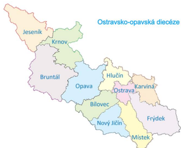
Příloha č. 2: Mapa děkanátu ostravsko-opavské diecéze. 76