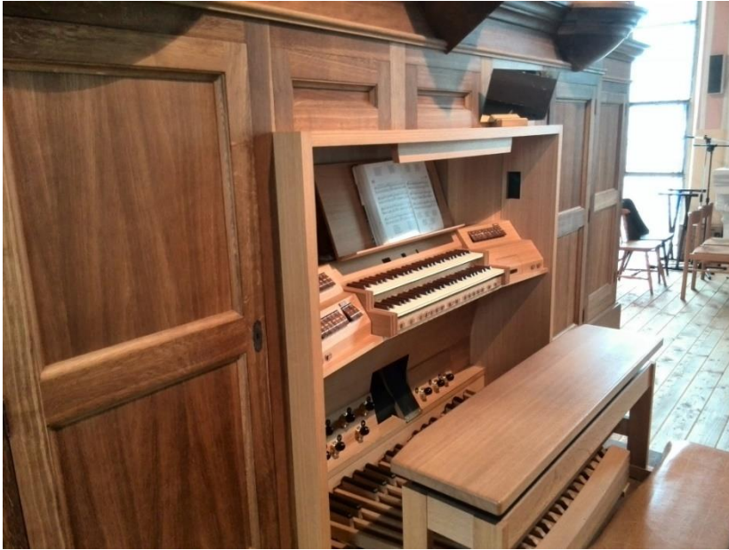
Příloha č.7: Varhany v kostele sv. Vavřince Píšť 81