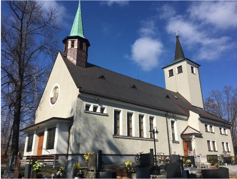
Příloha č. 13: Kostel sv. Jana Křtitele Bělá 87