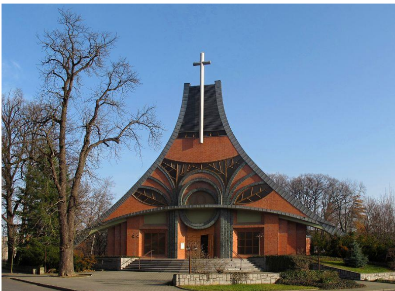
Příloha č. 10: Kostel Povýšení sv. Kříže Chuchelná 84