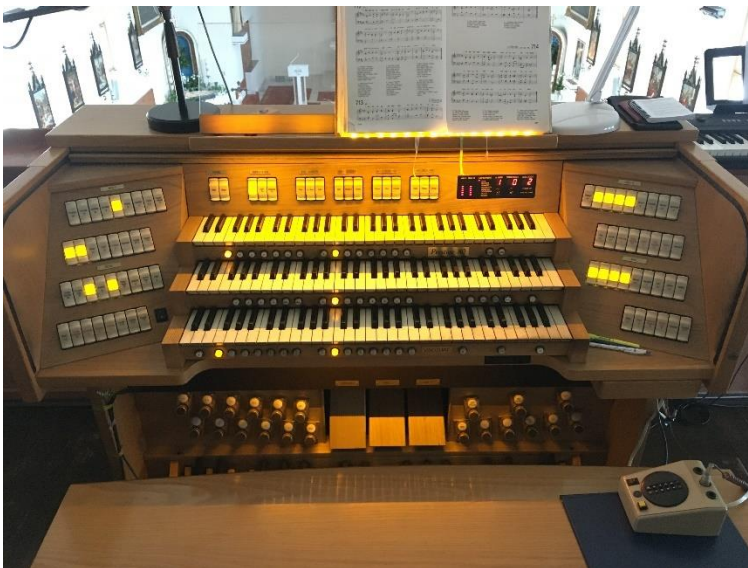
Příloha č. 14: Varhany v kostele sv. Jana Křtitele Bělá 88