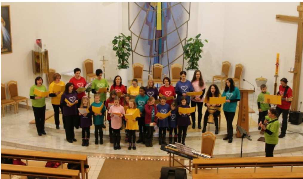
Příloha č. 12: Chránová schola při kostele Povýšení sv. Kříže Chuchelná 86