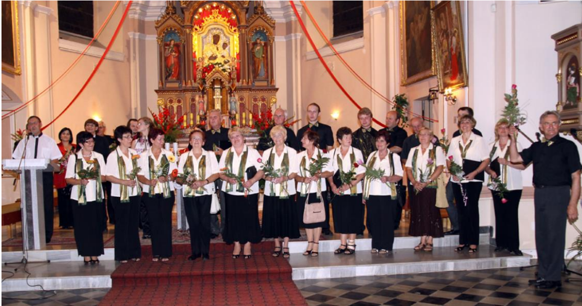
Příloha č. 9: Chrámový sbor při kostele sv. Vavřince Píšť 83