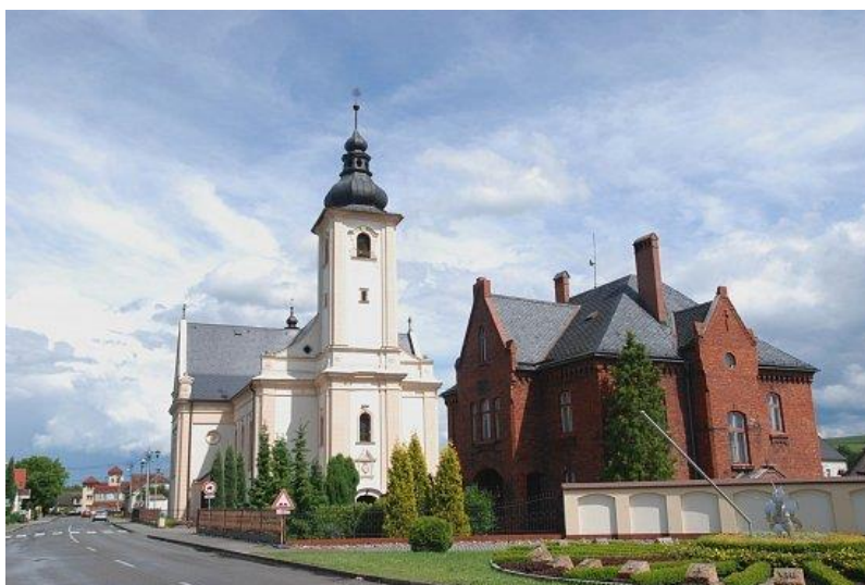
Příloha č. 6: Kostel sv. Vavřince Píšť 80