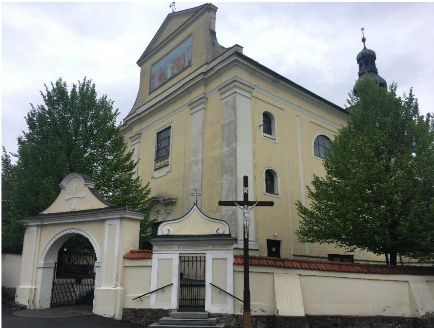
Příloha č. 3: Farní kostel Nejsvětější Trojice v Bohuslavicích 77