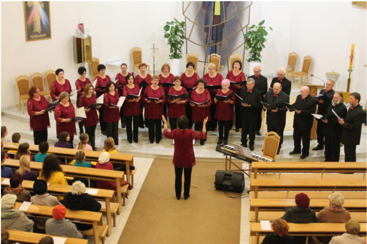
Příloha č. 11: Chránový sbor při kostele Povýšení sv. Kříže 85