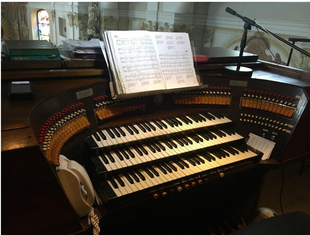
Příloha č. 4: Varhany v kostele Nejsvětější Trojice Bohuslavice 78