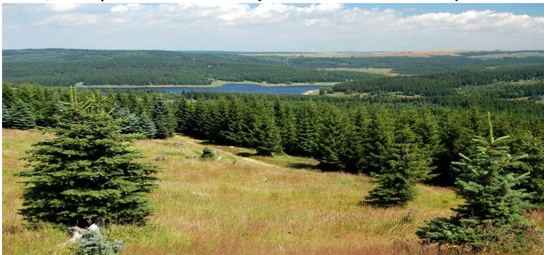
Foto č. 2, Přírodní park-Loučenská hornatina-flájská obora

Záměry PRM uvedené v prioritní oblasti 5 - Cestovní ruch, volný čas a sport úzce souvisí s oblastí faktorů pohody.