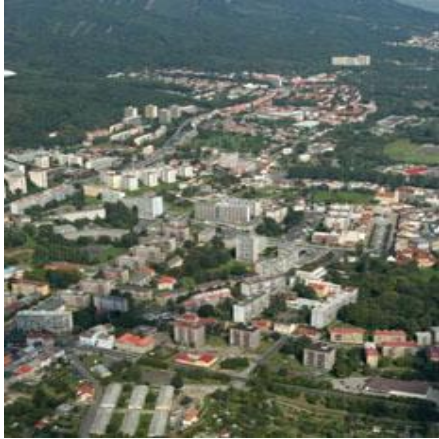
Foto č. 1, Letecký snímek města Litvínov, online: http://www.mulitvinov.cz/

Některé plochy nelze využít pro rozvoj města Litvínov z nejrůznějších důvodů – poddolované území, nevyjasněné vlastnické vztahy, fragmentace původní činnosti na jiné provozy (Ing. Arch. Ladislav Komrška, 2008).