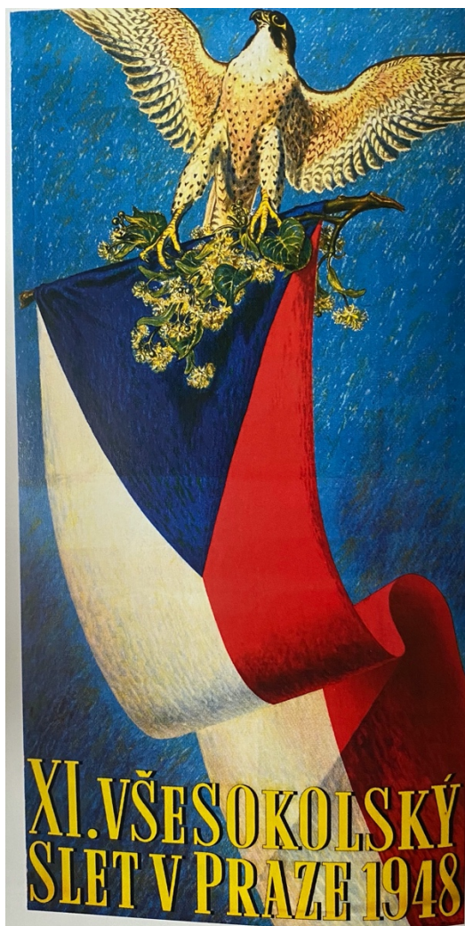
Obrázek 2: Hlavní plakát k XI. všesokolskému sletu