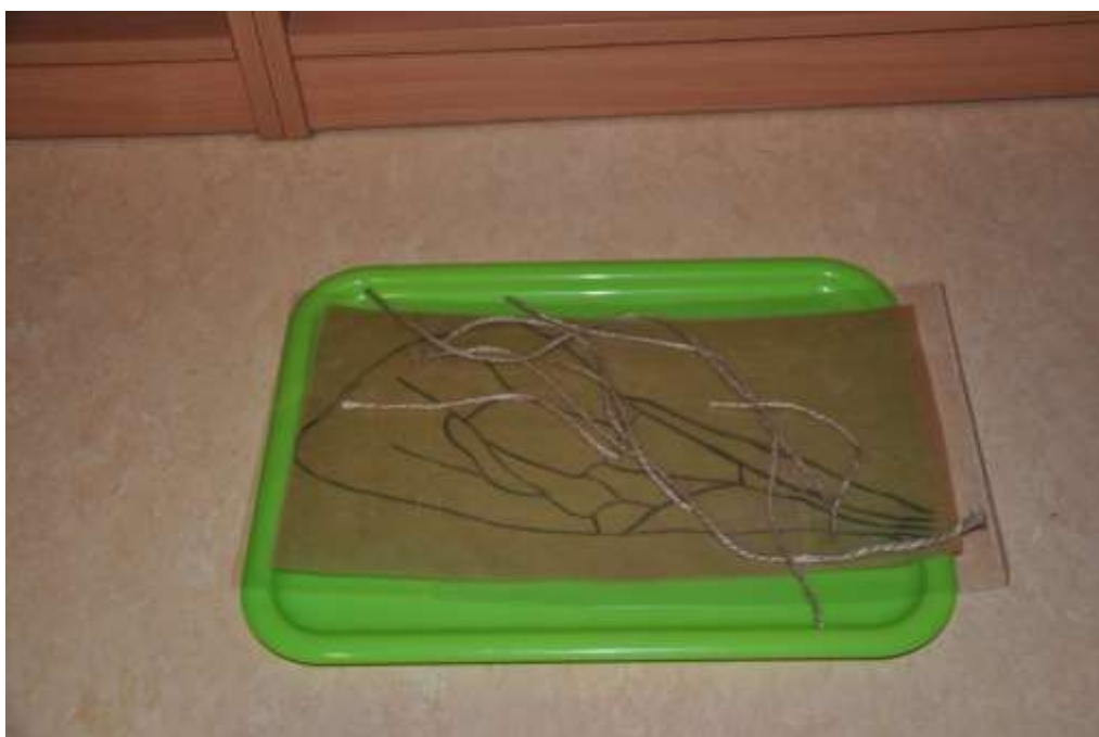
Obrázek č. 8: Praktický život – vyplétání křídla provázkem