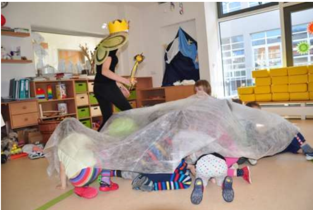
Fotografie 10: Prožitková hra – vývoj včely – zakuklení