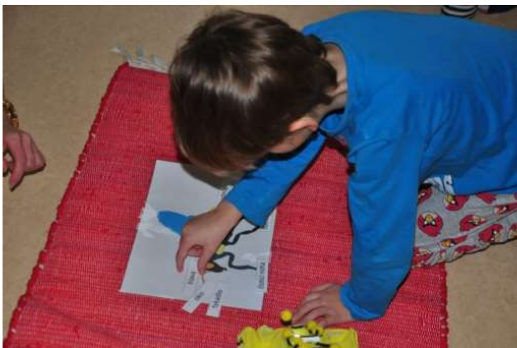
Fotografie 26: Přirazování části těla včely