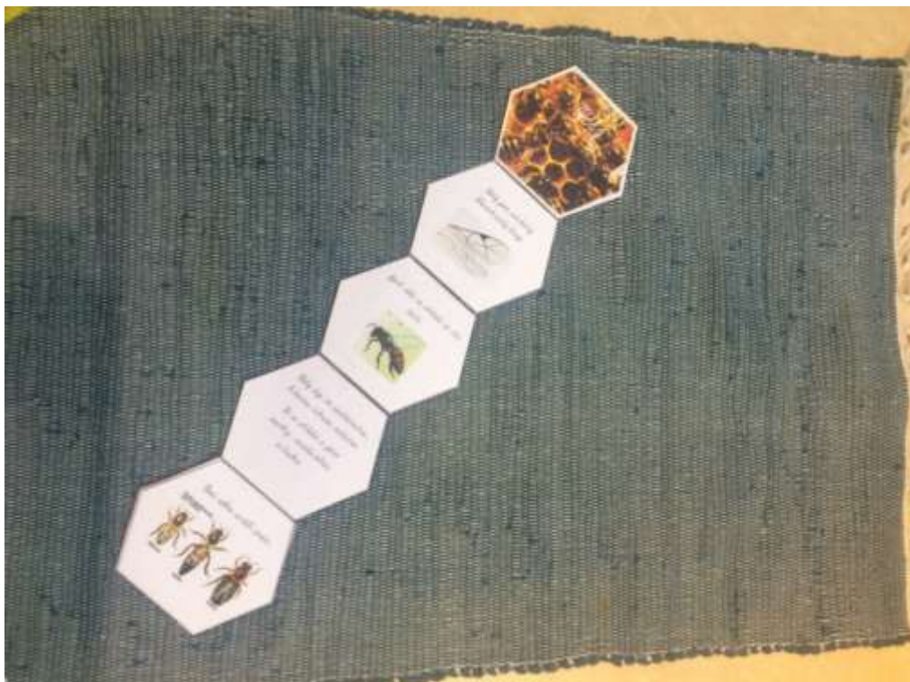
Obrázek č. 2: Knížka o včele