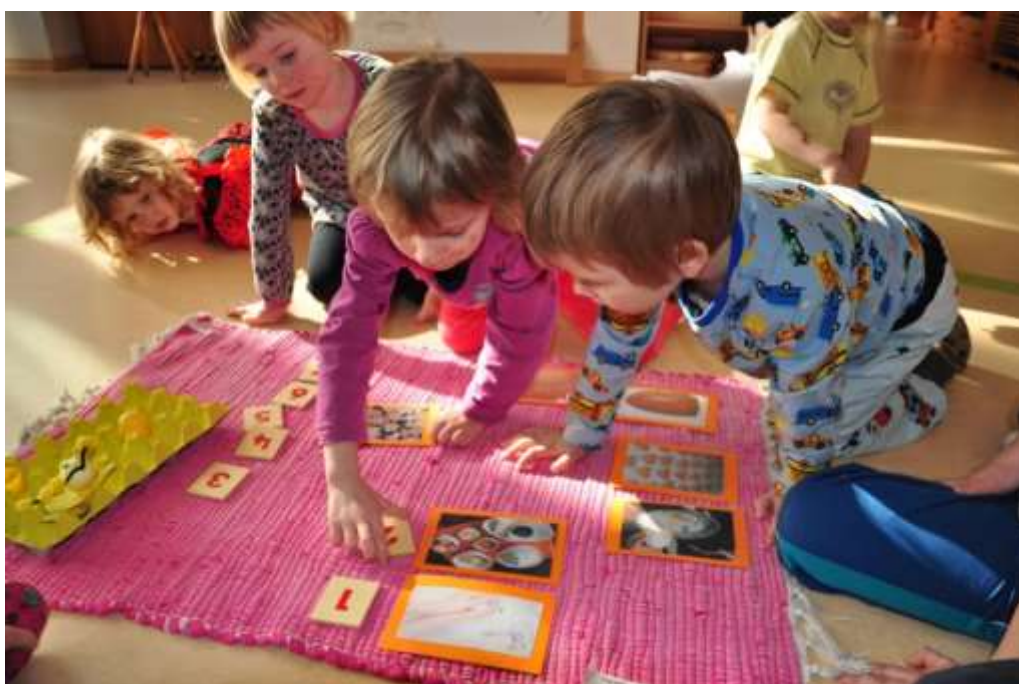
Fotografie 40: Řazení postupu práce