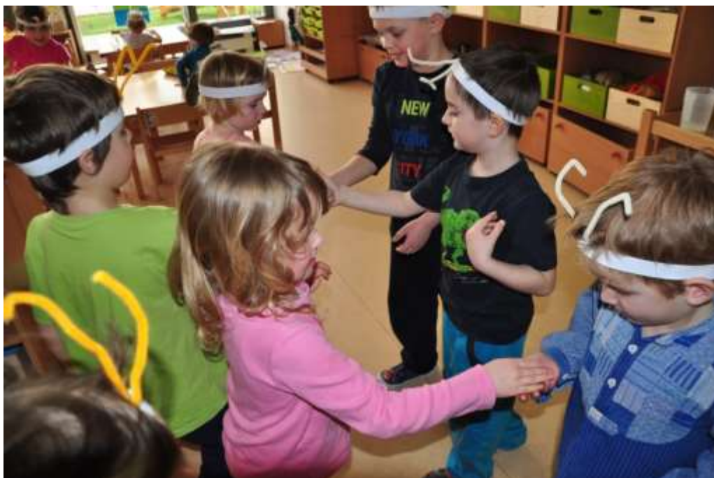
Fotografie 33: Prožitková hra – předávání nektaru, pylu