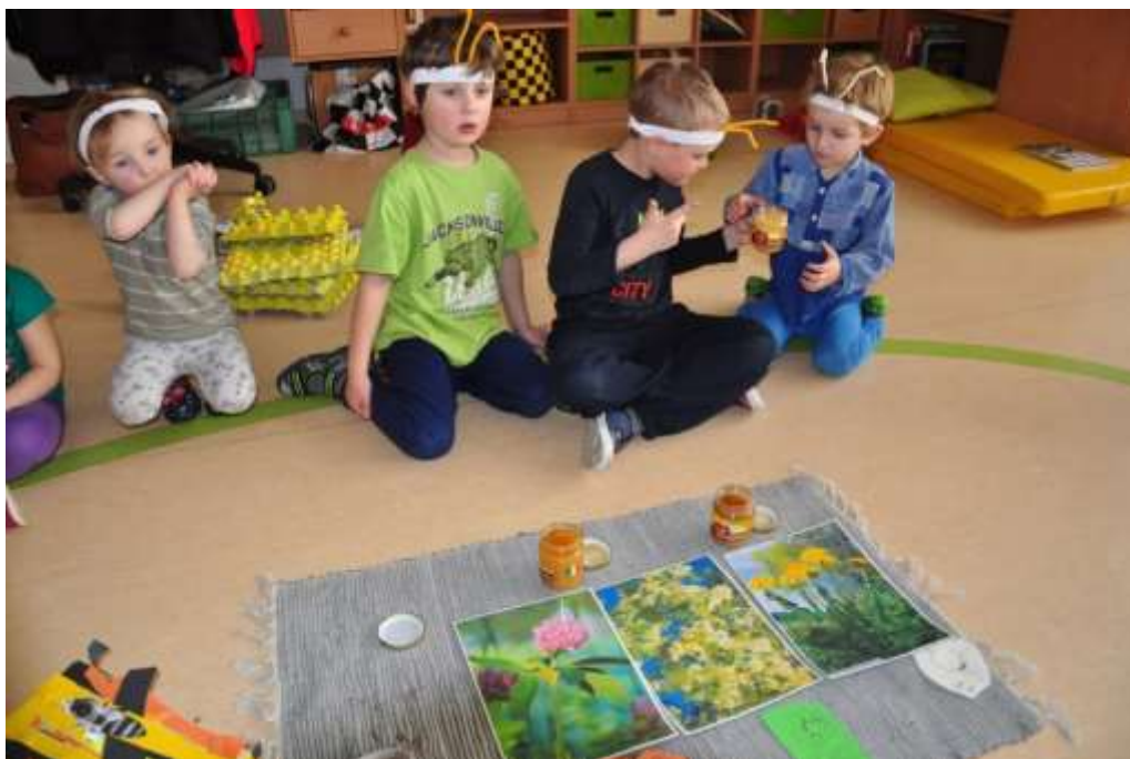
Fotografie 35: Ochutnávka medu