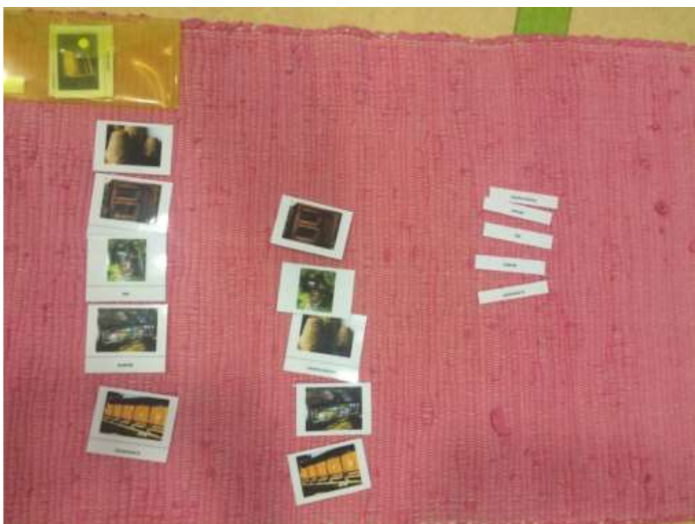
Obrázek č. 6: Třísložkové karty – druhy úlů