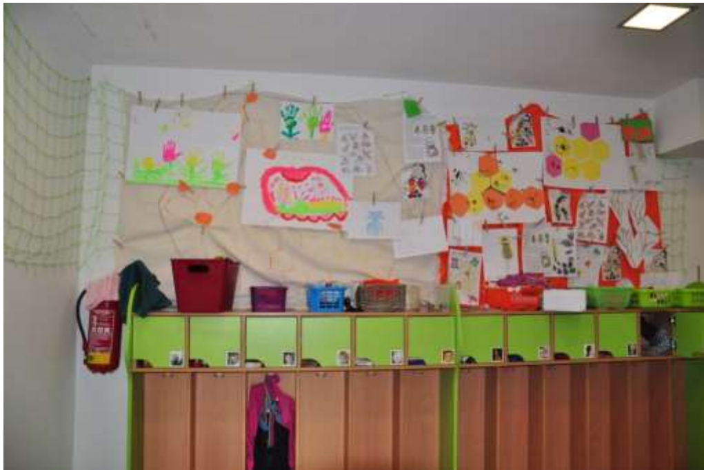
Fotografie 51: Výstava obrázků a dalších prací