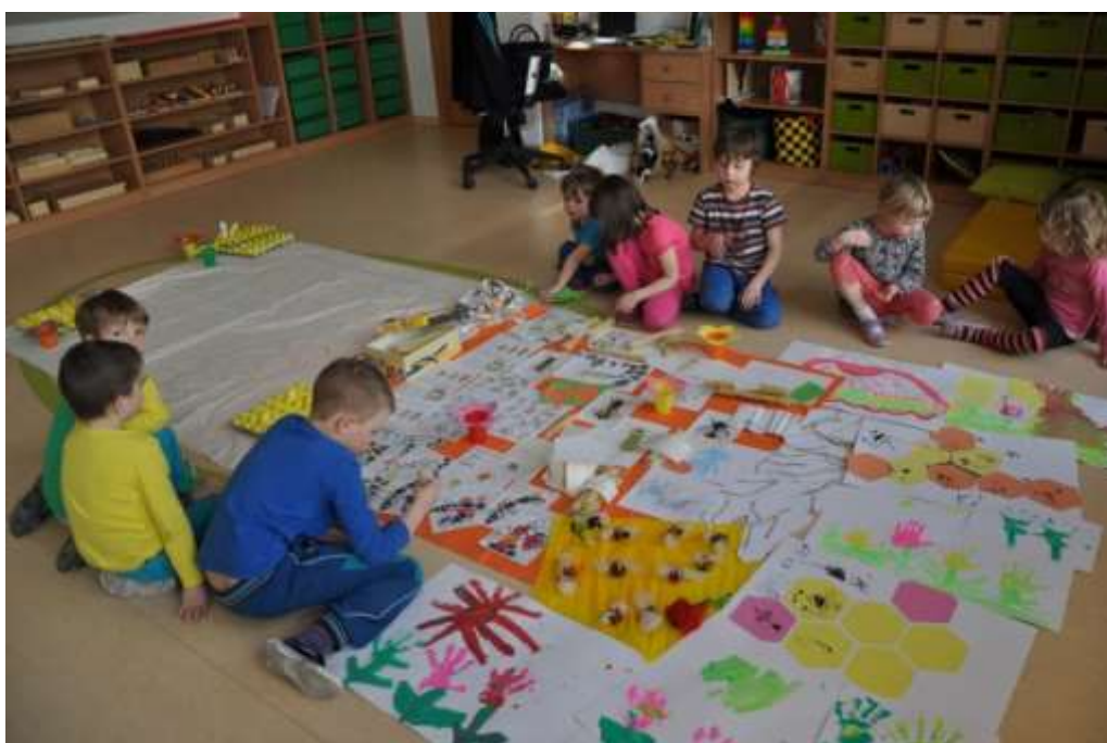
Fotografie 46: Shromáždění všech výtvorů a obrázků