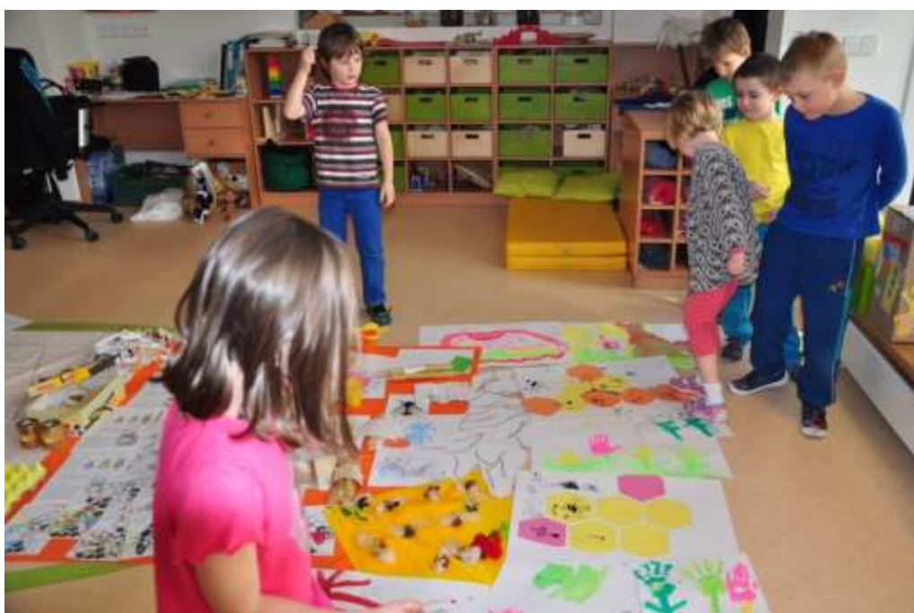
Fotografie 48: Prohlídka "mini galerie"