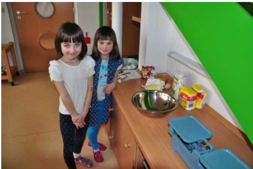
Fotografie 43: Příprava na pečení perníků