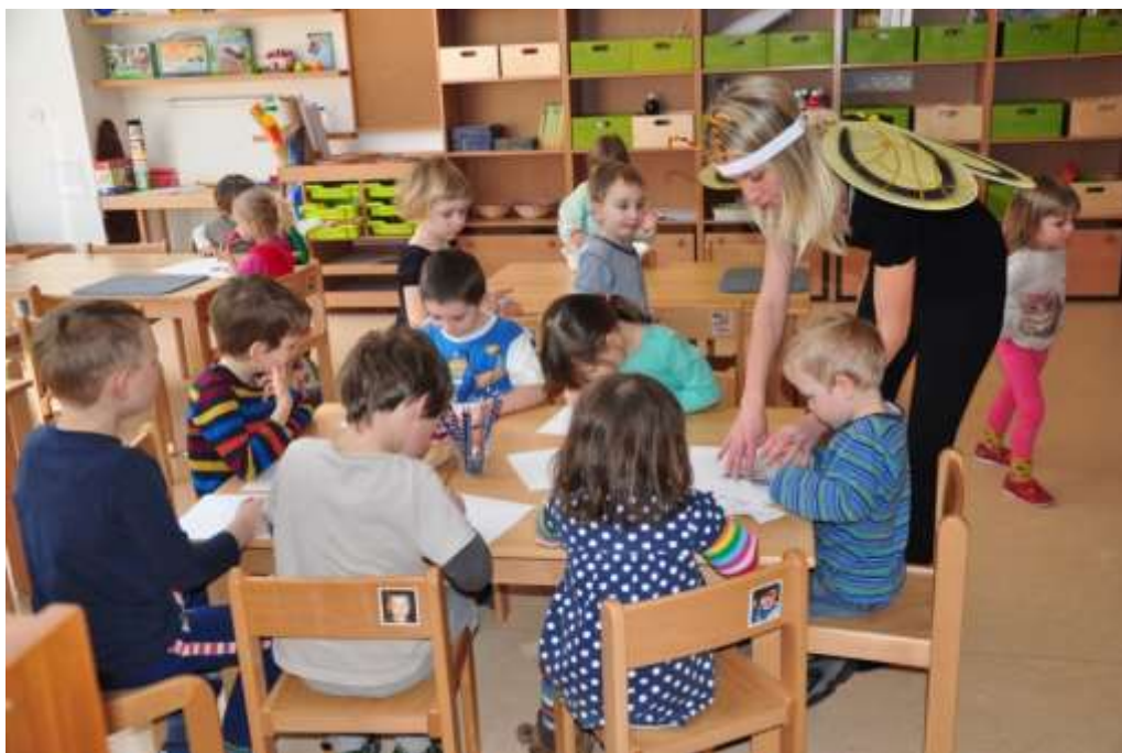
Fotografie 3: Obkreslování včel dle šablon