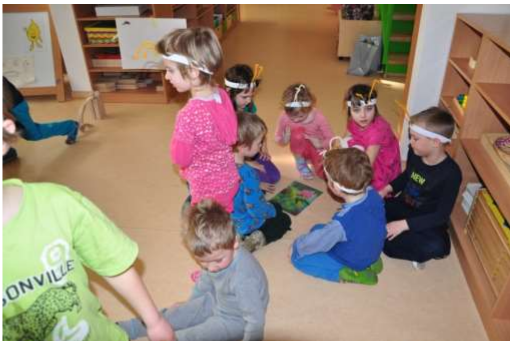
Fotografie 37: Zhodnocení