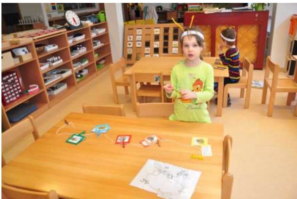
Fotografie 16: Práce s kartičkami – profese dělnic