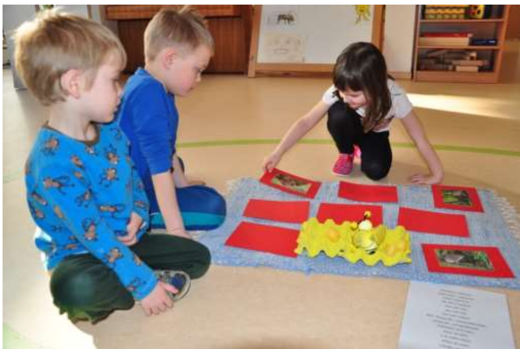
Fotografie 44: Seznámení s nepřáteli včel