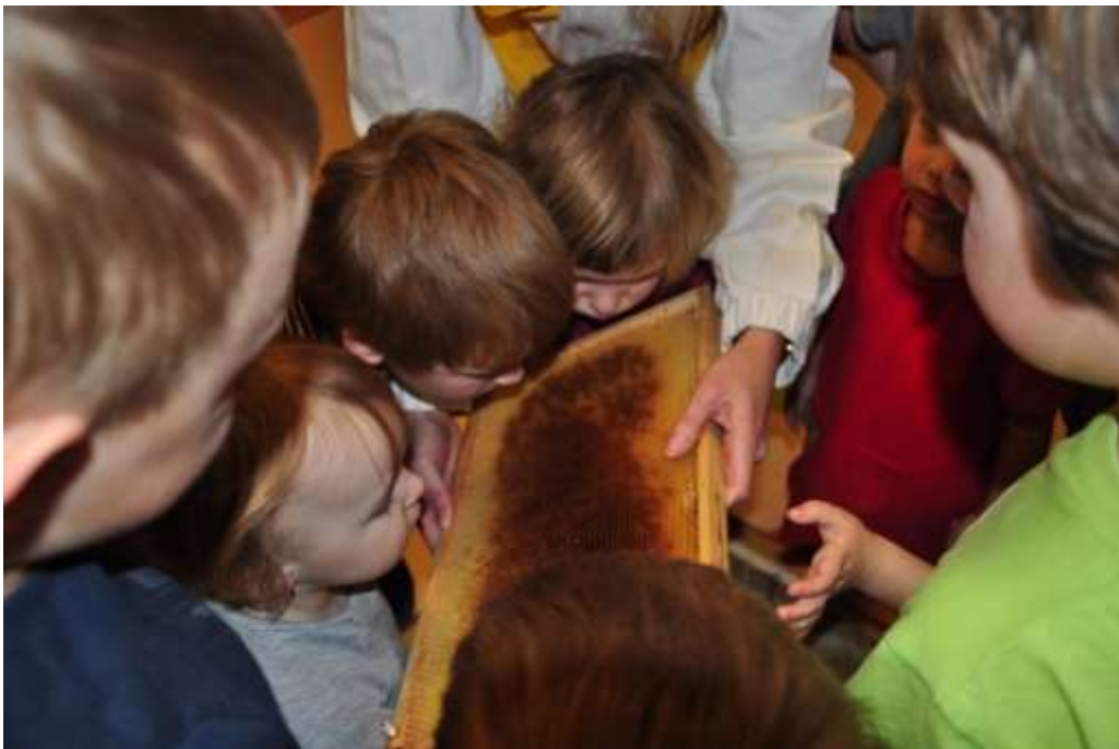
Fotografie 20: Ukázka rámečku s medem