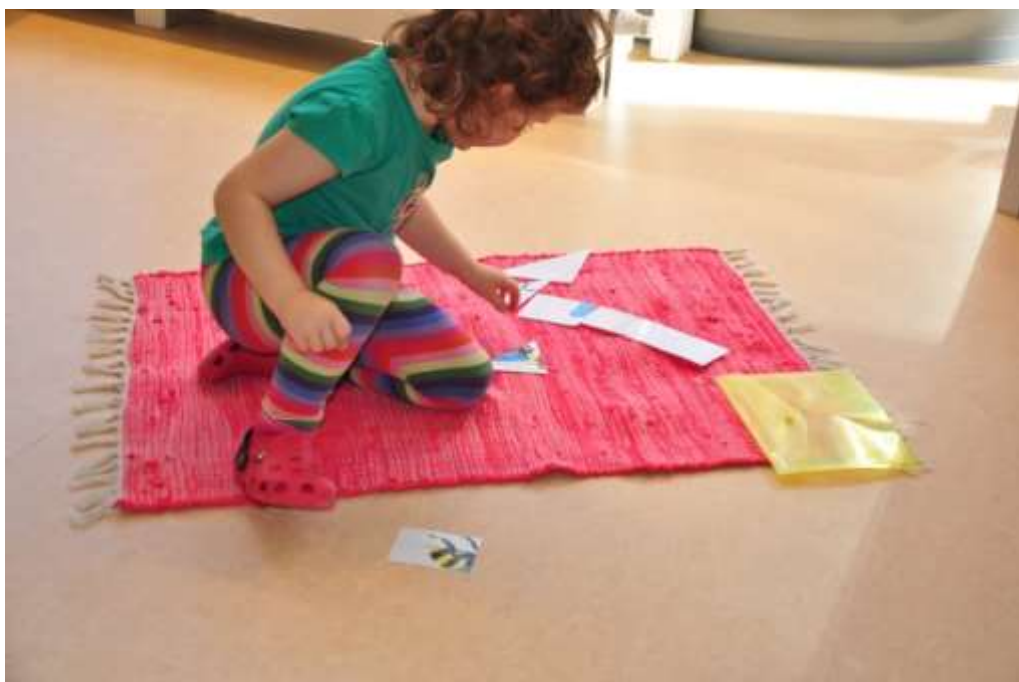
Fotografie 4: Skládání puzzlí včely