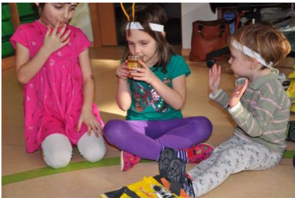
Fotografie 36: Vnímání smysly