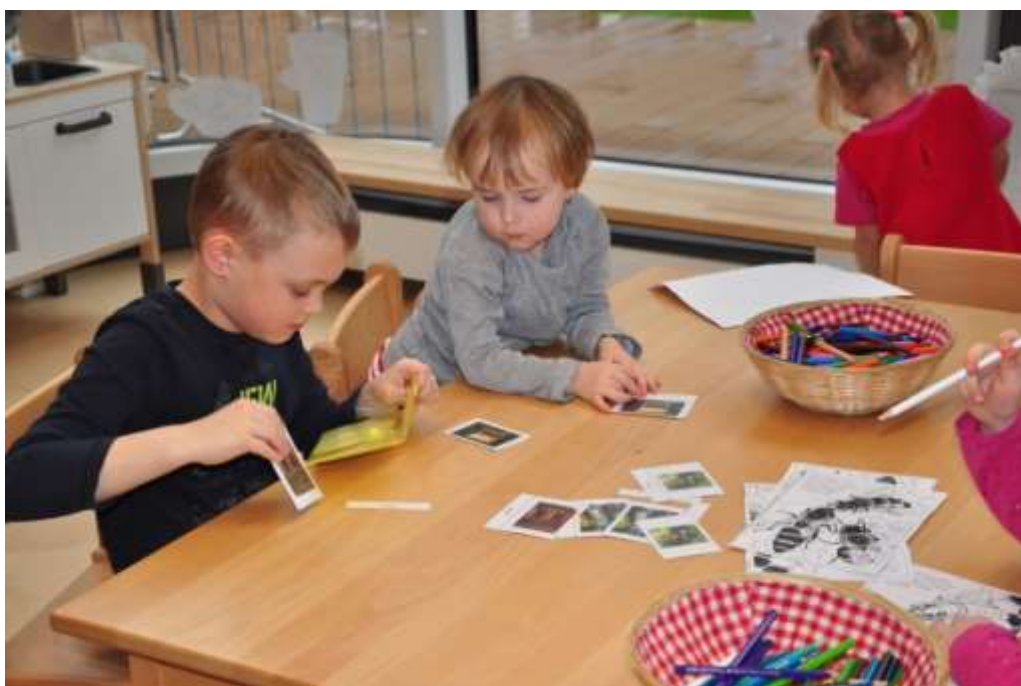
Fotografie 24: Práce s třísložkovými kartami – druhy úlů