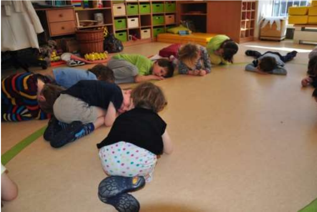
Fotografie 9: Prožitková hra – vývoj včely – vajíčko