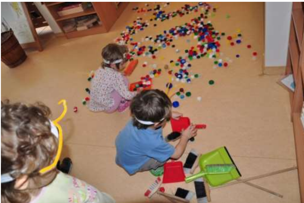
Fotografie 12: Prožitková hra – profese dělnic – čistička