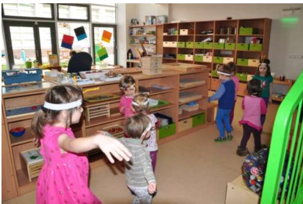
Fotografie 32: Prožitková hra – výroba medu