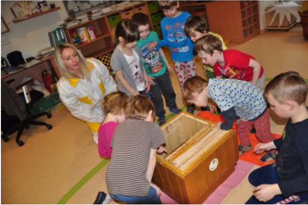
Fotografie 19: Zkoumání a prohlížení úlu