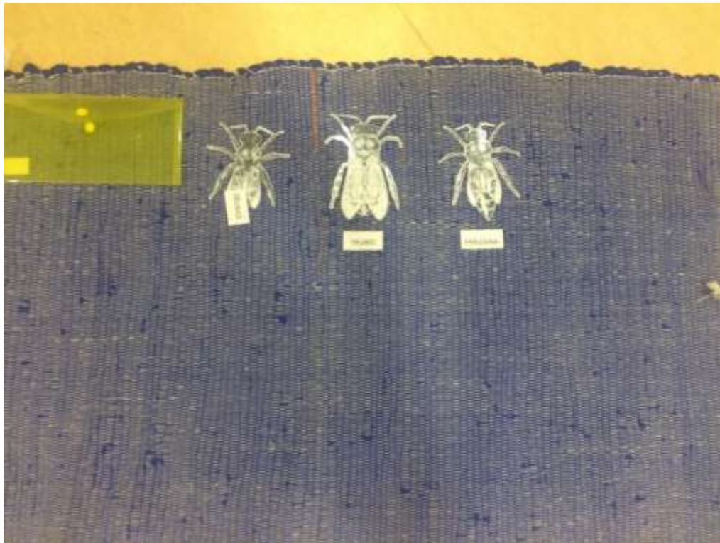
Obrázek č. 11: Šablony a obrázky včel ( dělnice, matka, trubec )