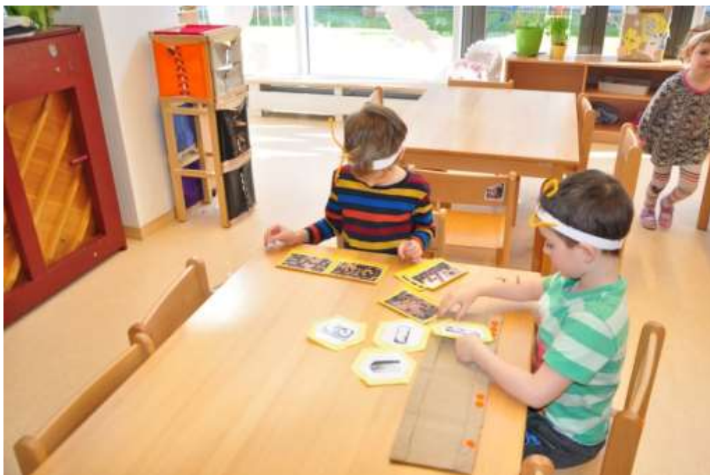
Fotografie 17: Práce s kapsářem – vývoj včely