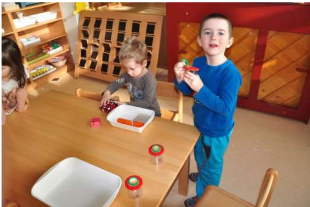
Fotografie 45: Prohlížení dalších opylovačů pod lupou