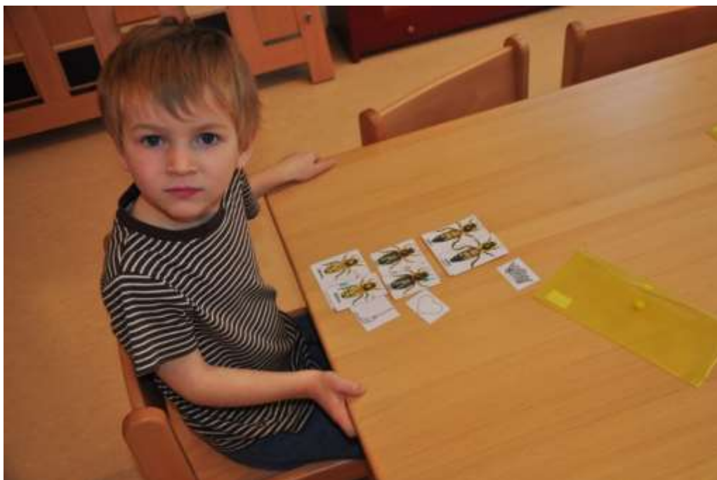
Fotografie 23: Práce s obrázky včel – hledání a přiřazování stejných včel