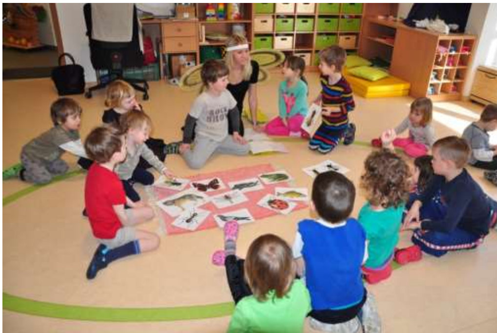
Fotografie 1: Třídění hmyzu