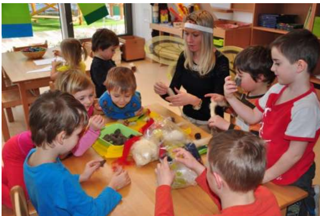
Fotografie 30: Výroba včelky z přírodních materiálů