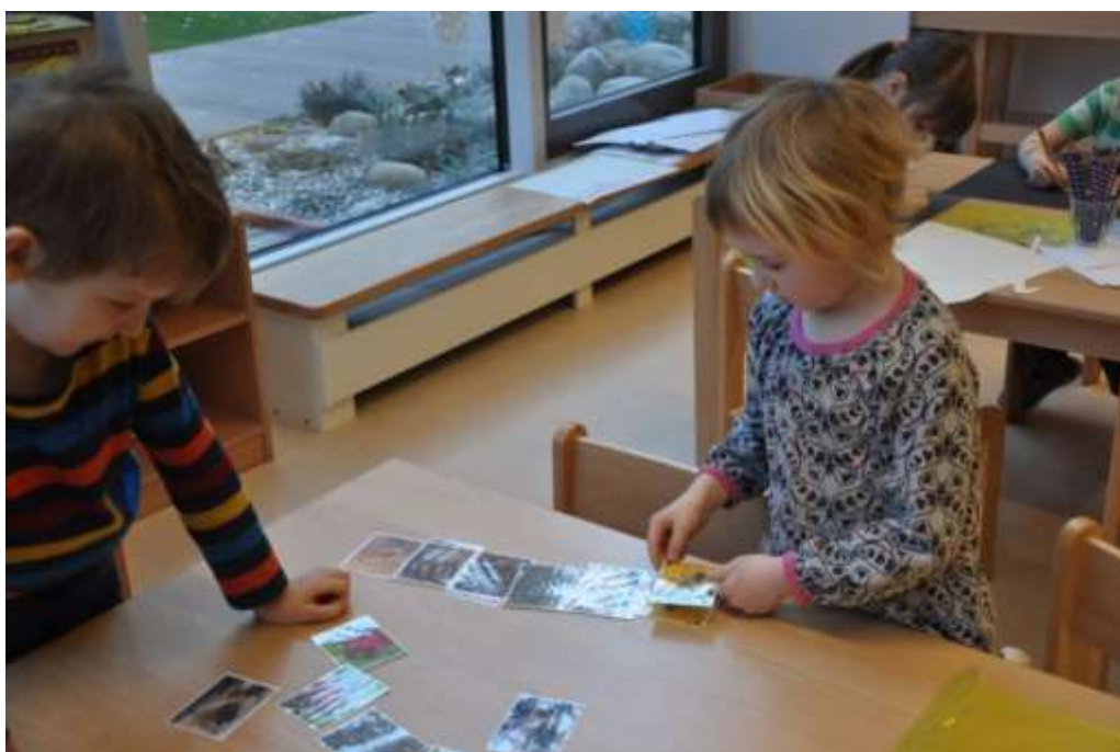
Fotografie 8: Práce s obrázky – hledání stejných trojic/hra: „Myslím si“