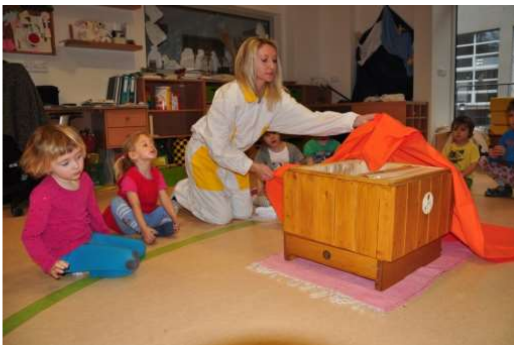
Fotografie 18: Ukázka nástavkového úlu