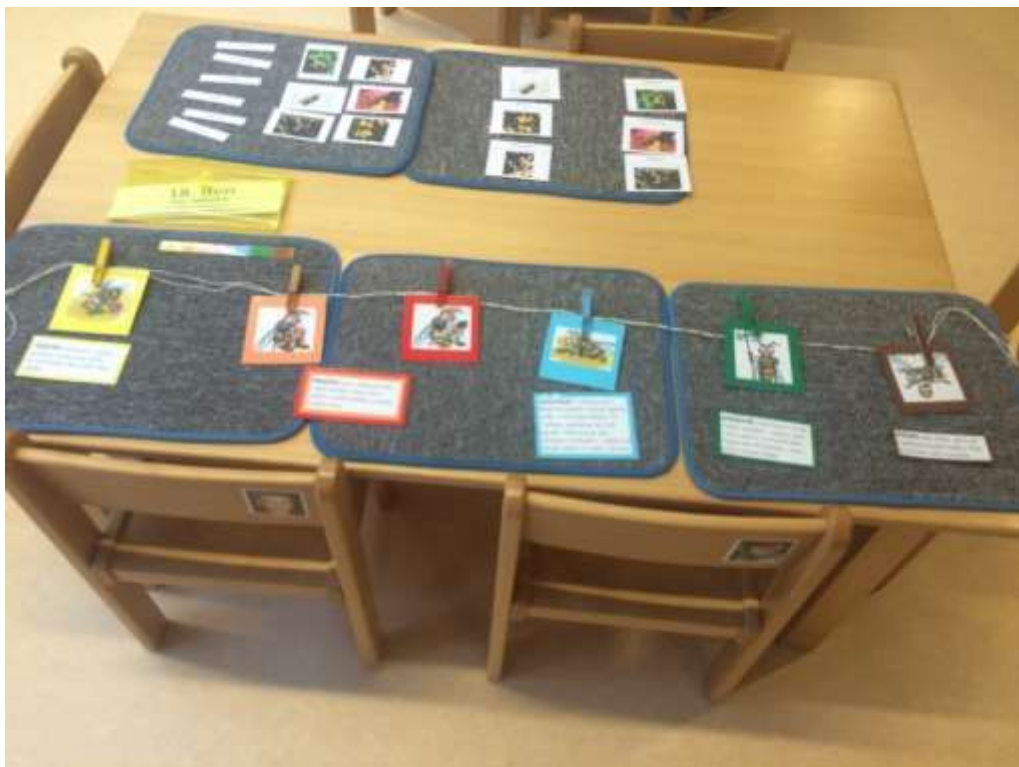
Obrázek č. 4: Stádia vývoje profese dělnic