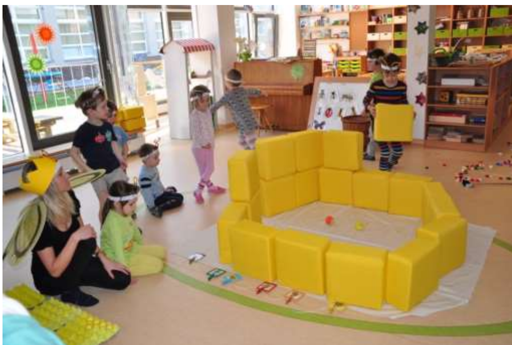
Fotografie 14: Prožitková hra – profese dělnic – stavitelka