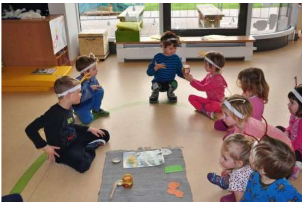
Fotografie 34: Ukázka včelích výrobků – vyzkoušení