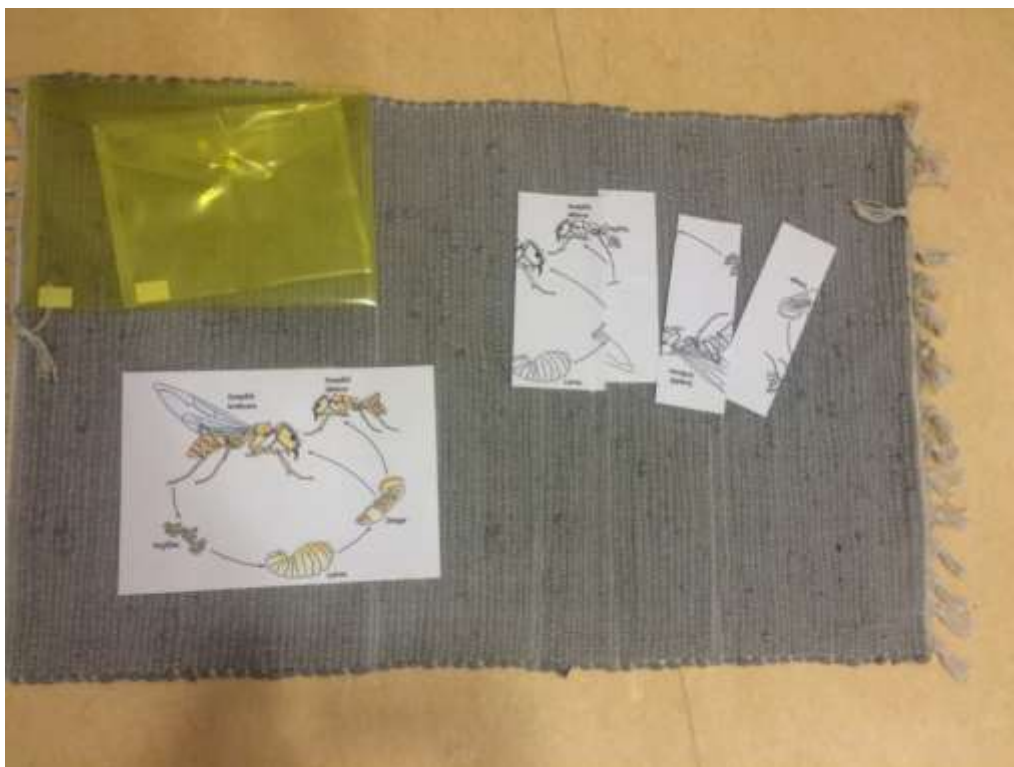
Obrázek č. 5: Puzzle vývoje včely