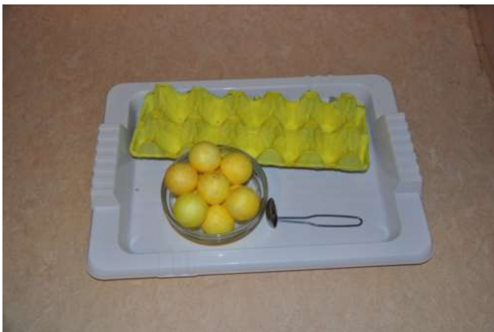
Obrázek č. 10: Praktický život – kladení vajíček do pláství