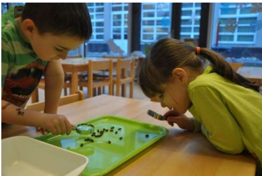
Fotografie 6: Zkoumání včel lupami