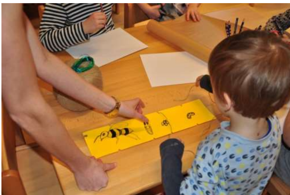
Fotografie 28: Vývoj včely – přiřazování provázkem