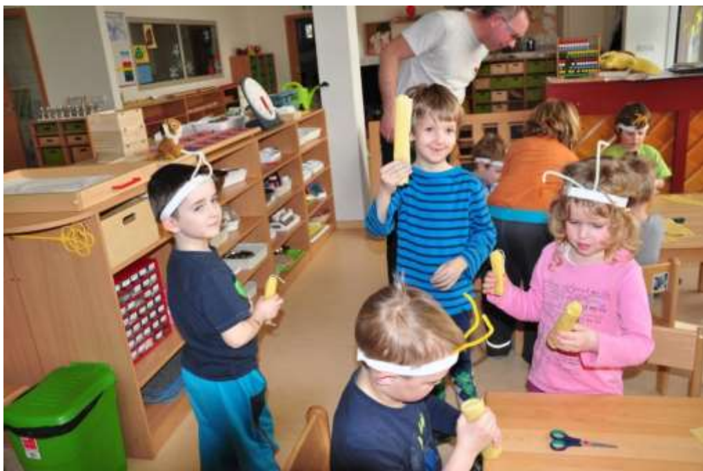
Fotografie 39: Voskové svíčky