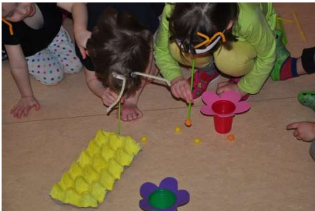
Fotografie 13: Prožitková hra – profese dělnic – kojička