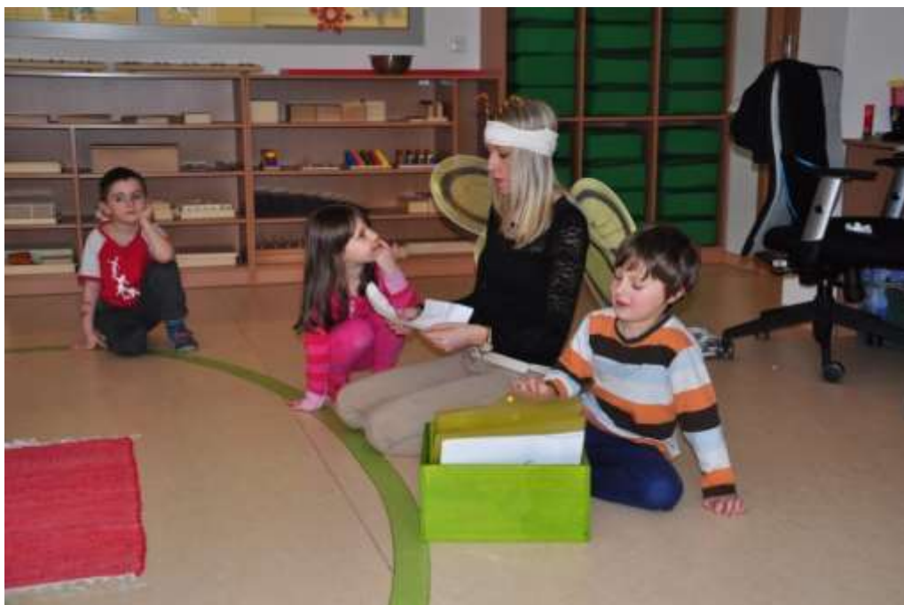
Fotografie 29: Hra: "Popletená hlava"