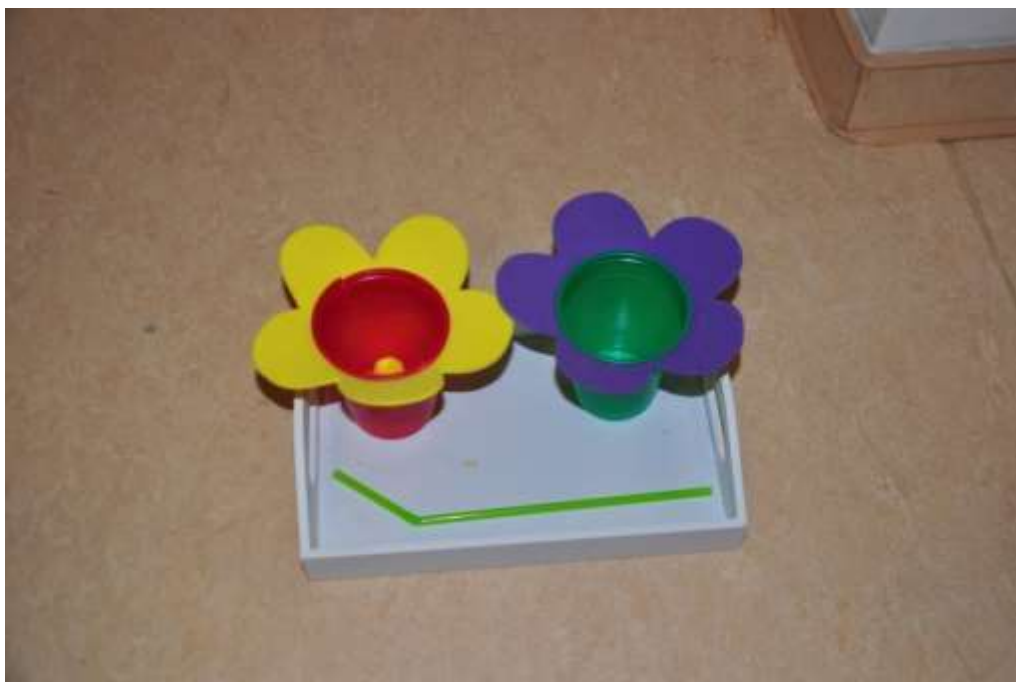
Obrázek č. 9: Praktický život – opylení květin (nasávání kuliček brčkem)