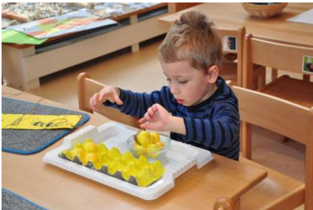
Fotografie 31: Praktický život – kladení vajíček