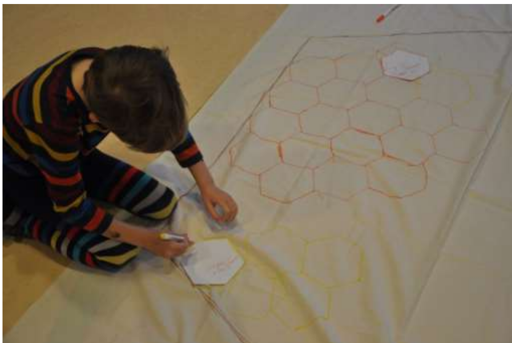
Fotografie 7: Obkreslování pláštíků na látku