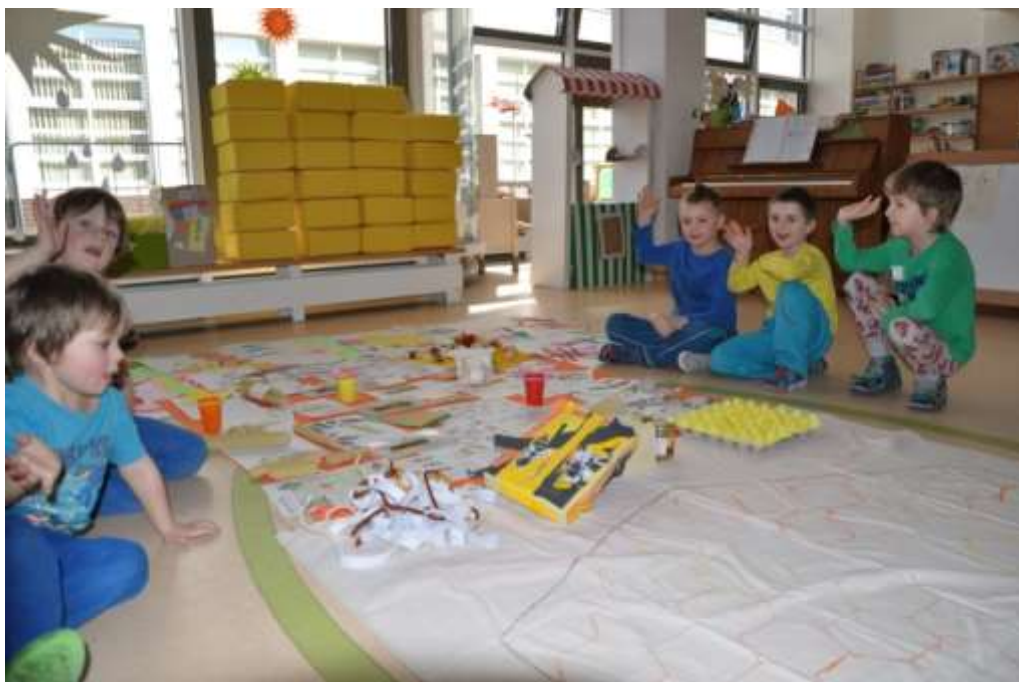
Fotografie 47: Loučení se včelou