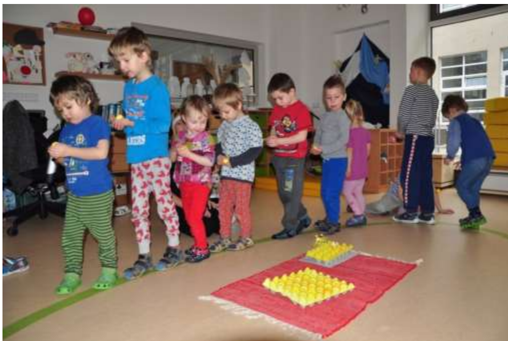
Fotografie 25: Chůze po elipse - nošení vajíček