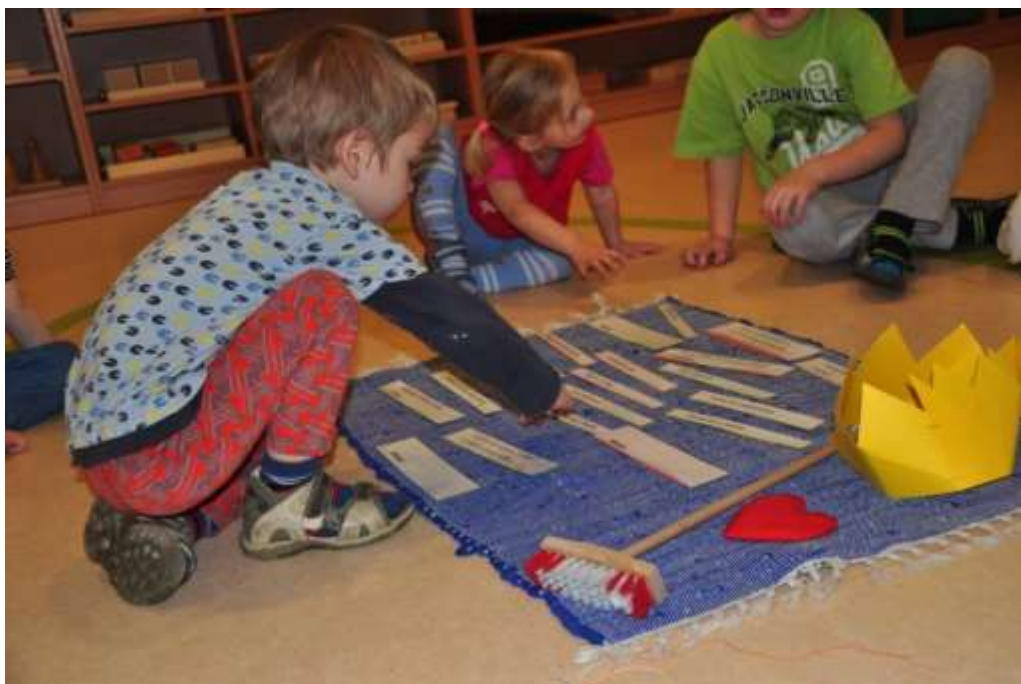
Fotografie 21: Přiřazování vět k rolím včel