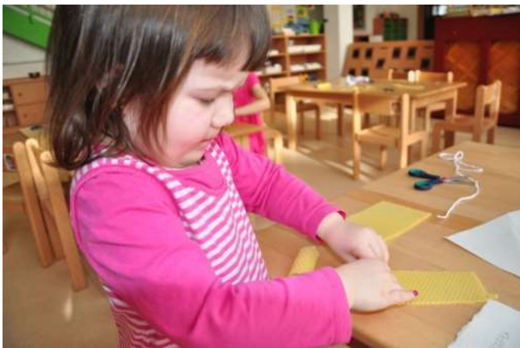
Fotografie 38: Výroba svíčky z vosku