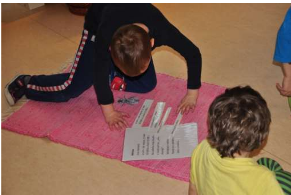
Fotografie 22: Kontrola správnosti