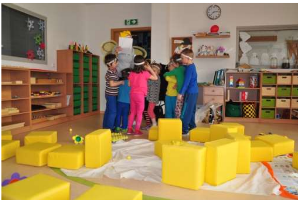
Fotografie 50: Vyrojení včel