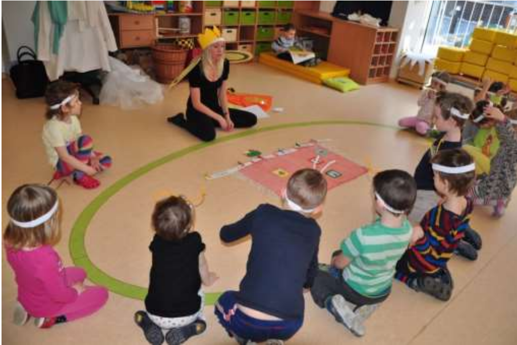
Fotografie 11: Práce s obrázky profesí dělnic – přiřazování dle barev