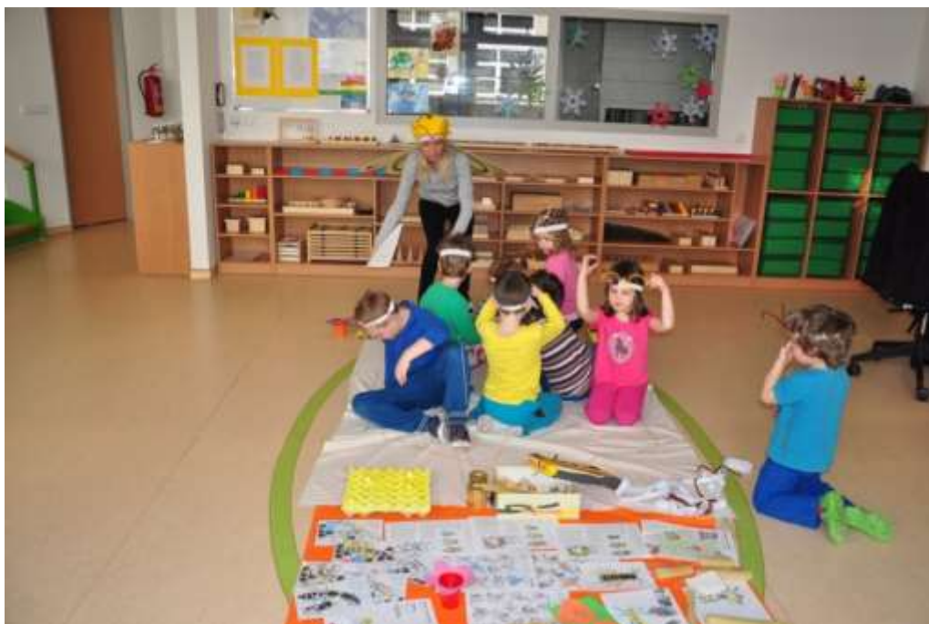
Fotografie 49: Dramatizace příběhu o včele