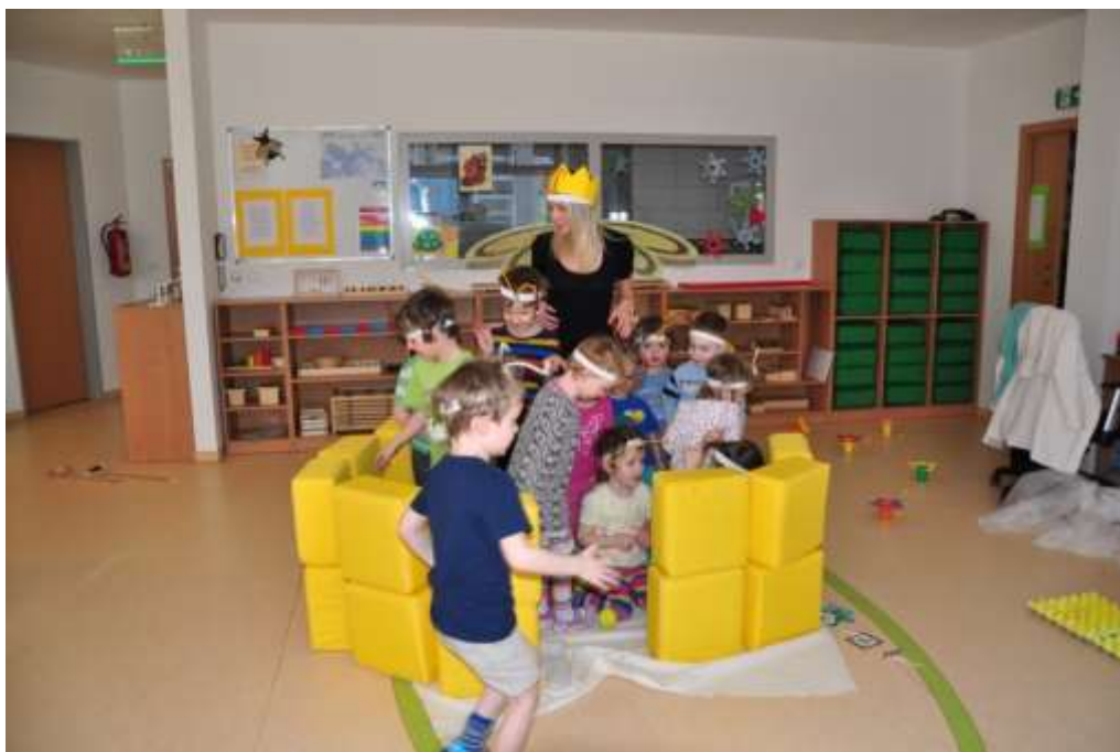
Fotografie 15: Prožitková hra – profese dělnic – vyvrcholení (soužití v úlu)