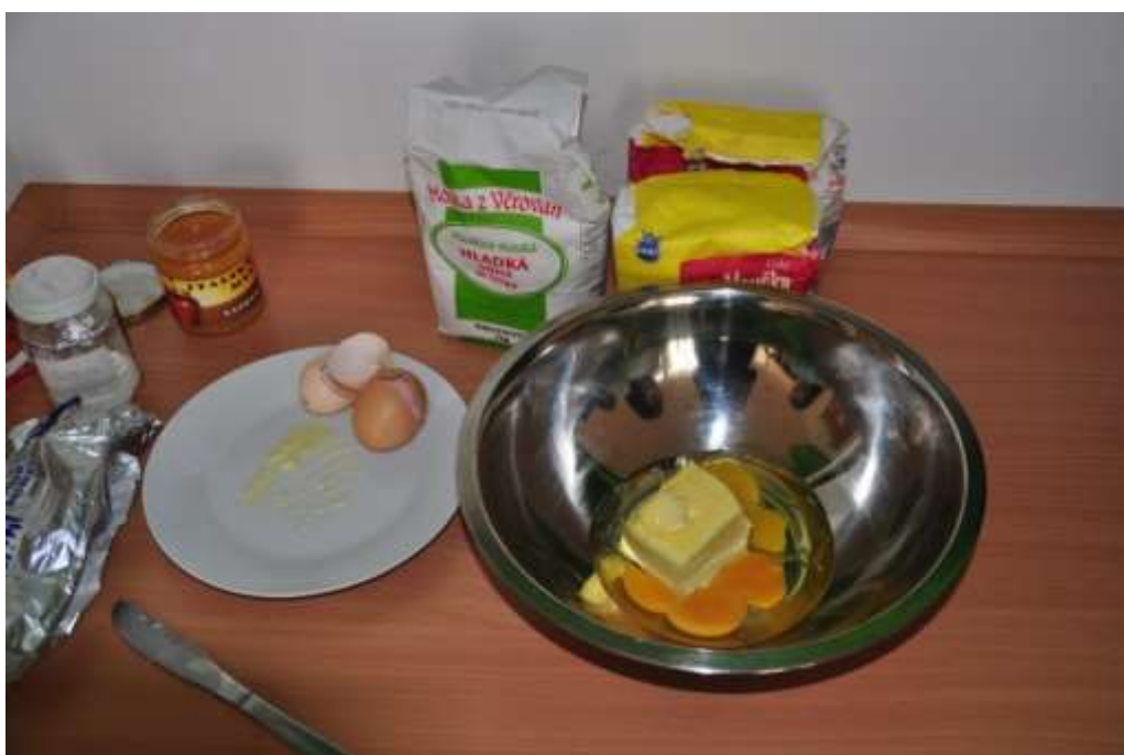
Fotografie 42: Ingredience na pečení