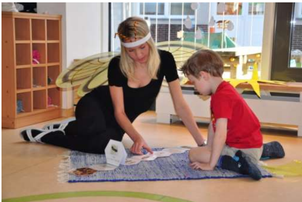
Fotografie 5: Práce na koberečku – čtení knížky o včele