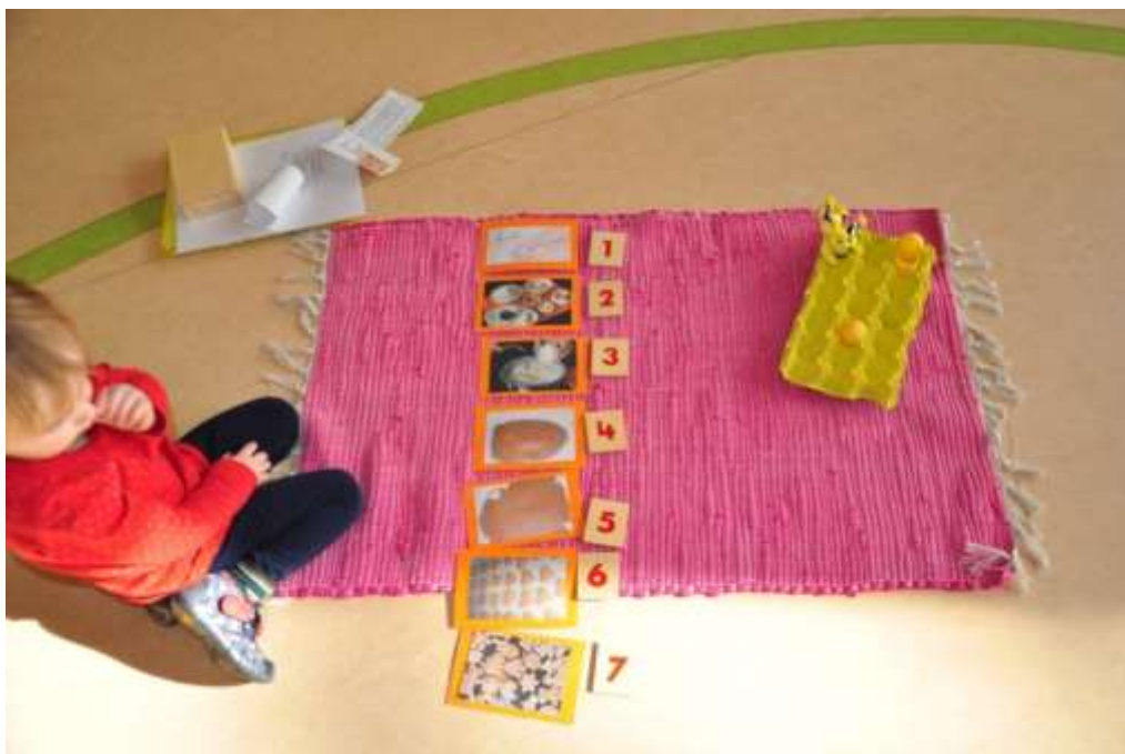
Obrázek č. 7: Postup práce s obrázky a čísly