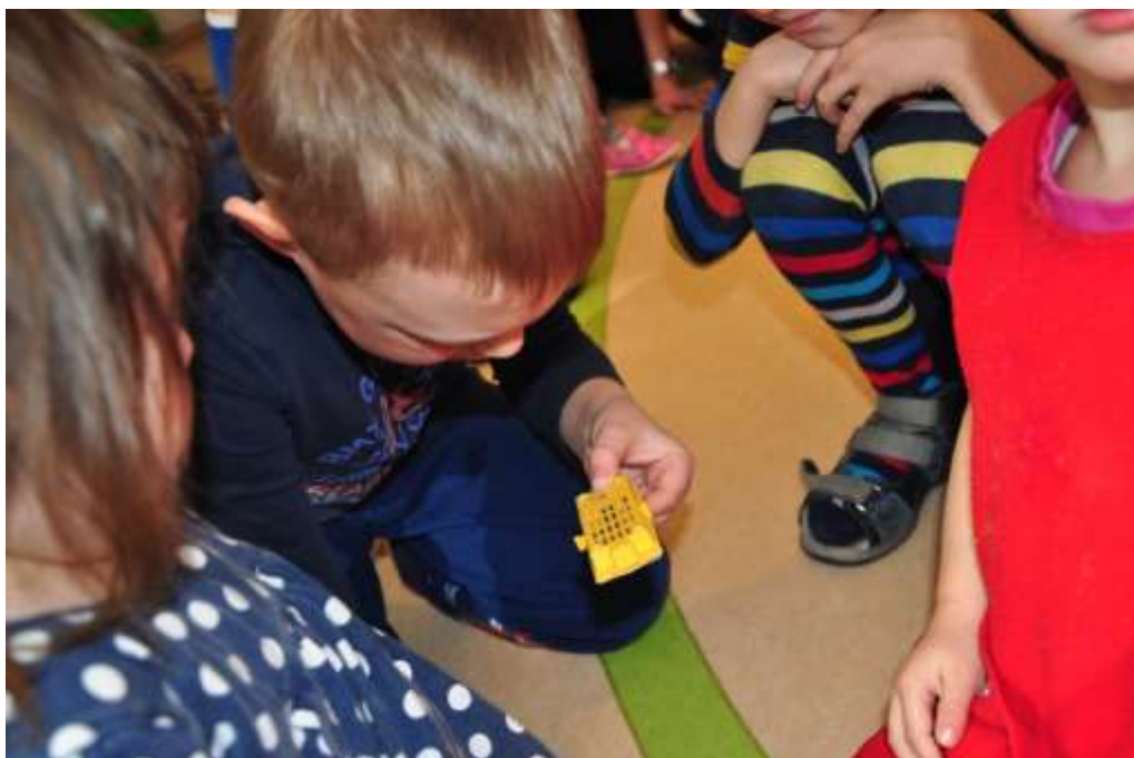
Fotografie 2: Prohlížení včely