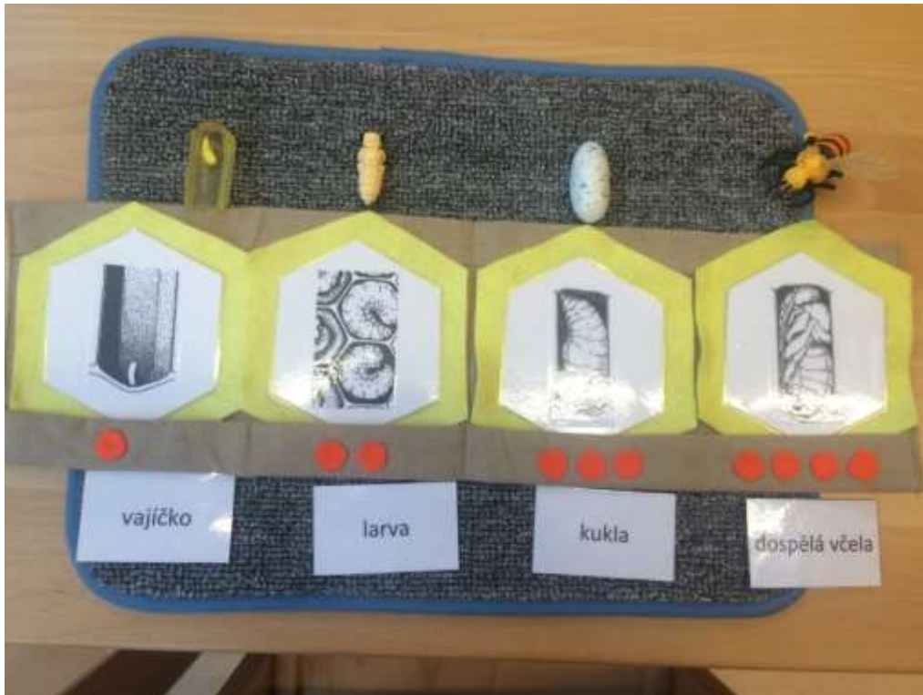
Obrázek č. 1: Kapsář s vývojovými stádii včely