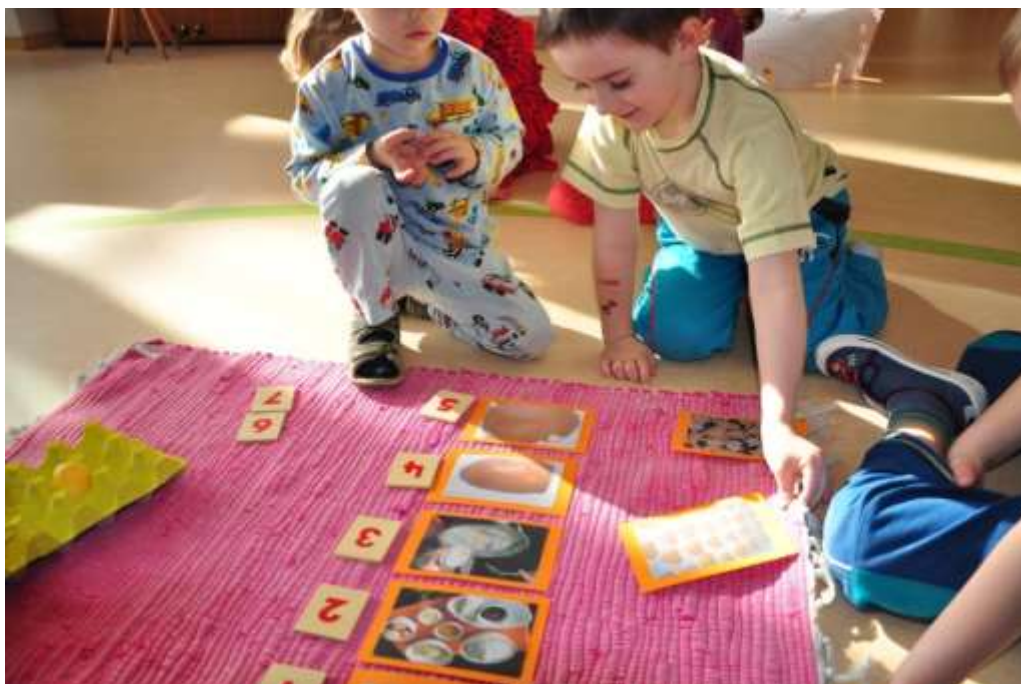
Fotografie 41: Práce s obrázky a čísly