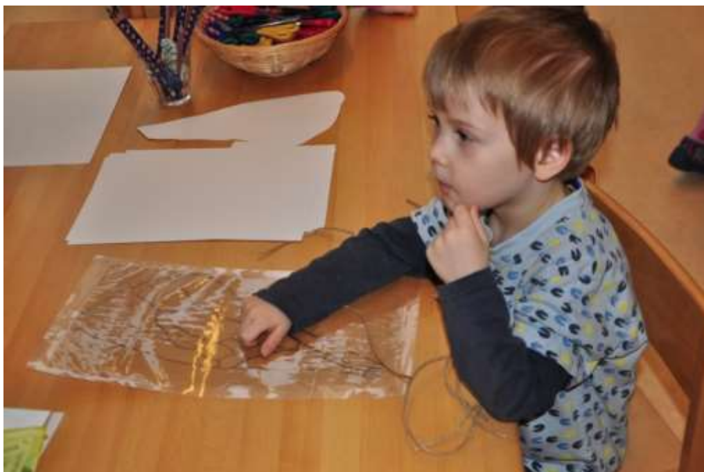
Fotografie 27: Praktický život – vyplétání křídla provázkem