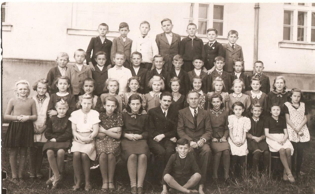
Příloha 14 – Masarykova škola, rok 1952