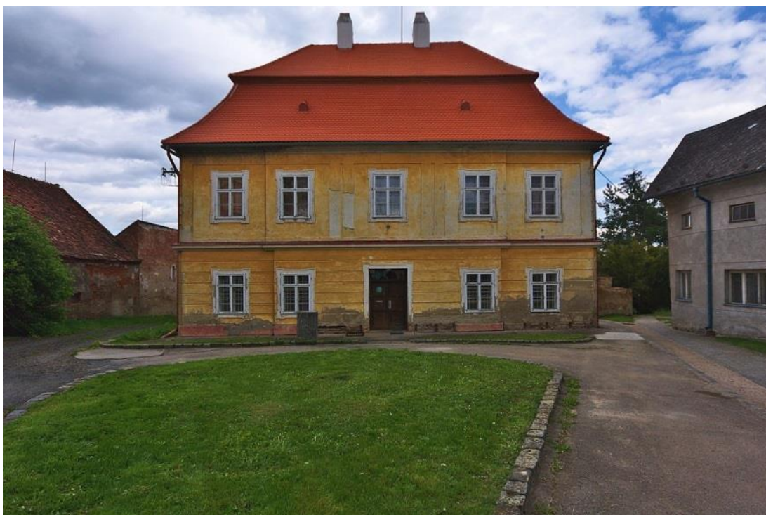
Příloha 6 – Budova Národní školy v Nezamyslicích, rok 1921