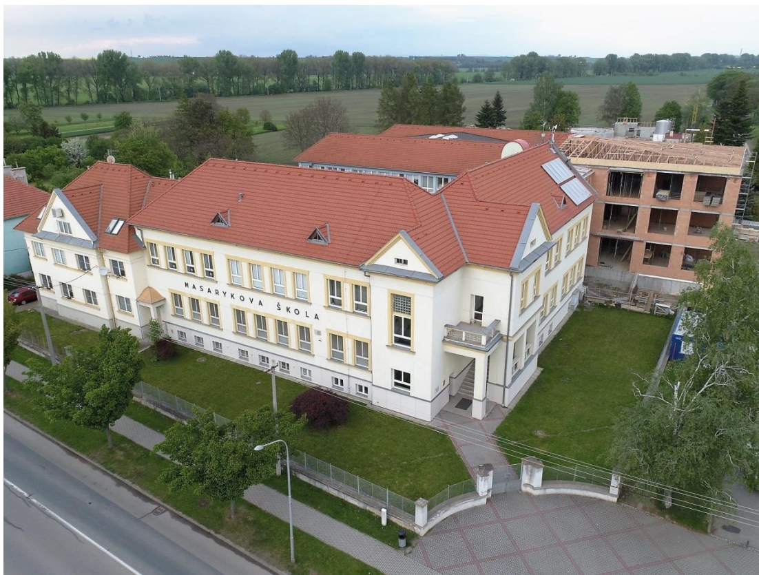
Příloha 18 – Slavnostní otevření třetí budovy Masarykovy základní školy, rok 2017