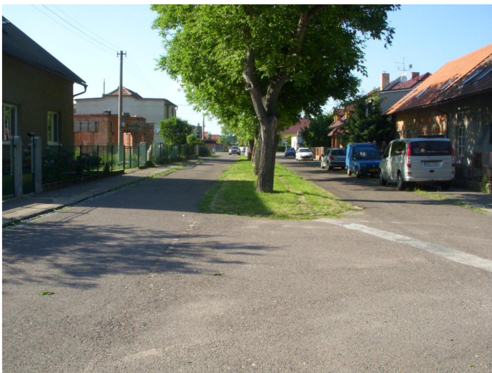
Obrázek 11: Pohled do ul. Větrná směrem k silnici III/0362 - v zeleném pásu budou vytvořena nová parkovací místa