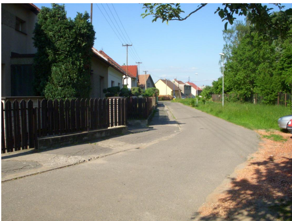
Obrázek 14: Pohled zpět do ul. Nádražní (ve směru jízdy)