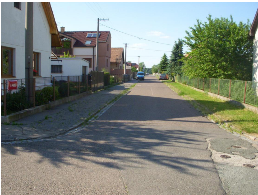
Obrázek 7: Pohled do ul. Závodní směrem k silnici III/0362