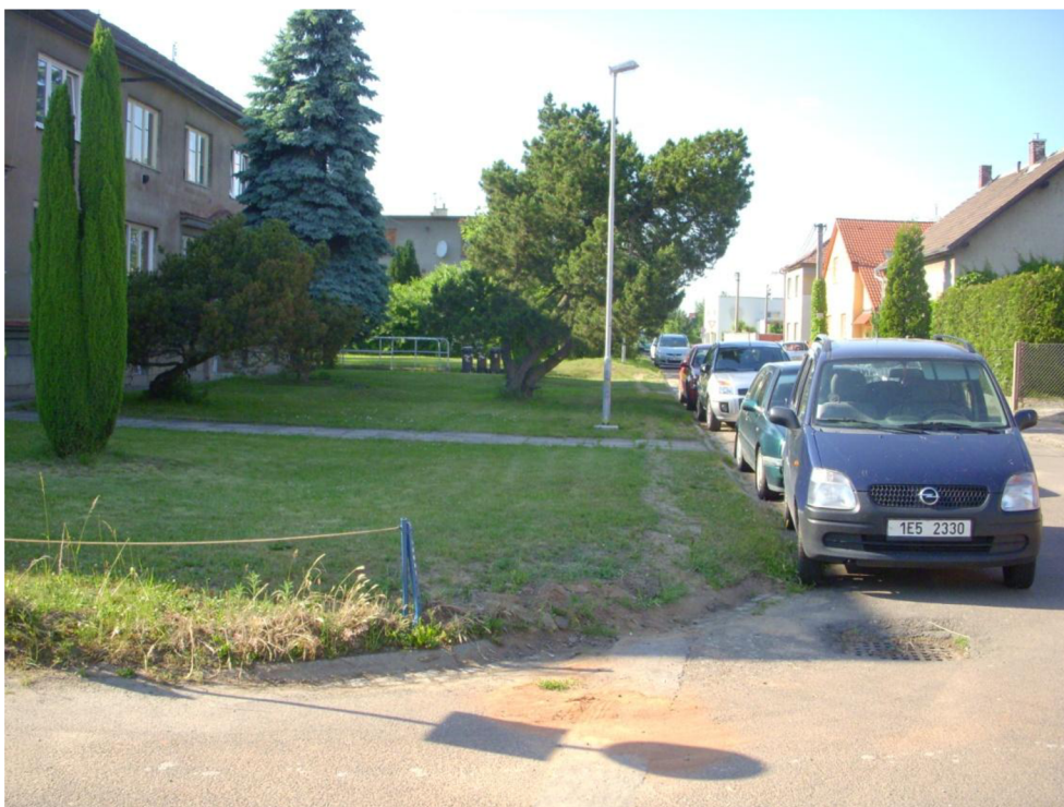
Obrázek 15: Pohled na plochu před bytovým domem, kde budou vytvořena nová parkovací místa