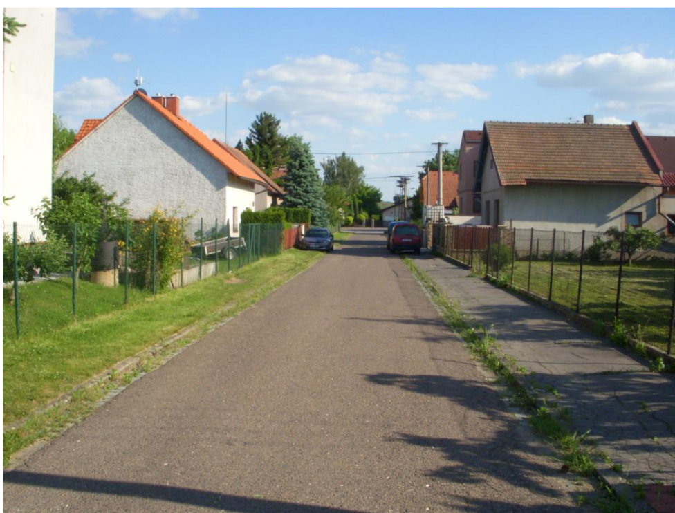
Obrázek 8: Pohled do ul. Závodní směrem od silnice III/0362