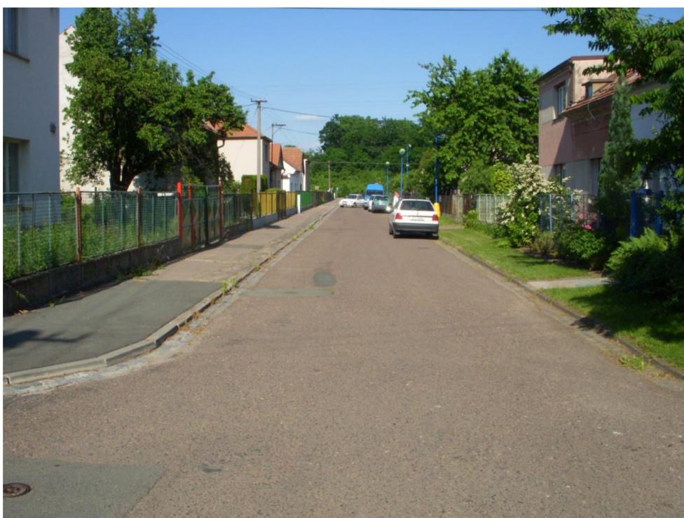
Obrázek 2: Pohled do ul. Šafaříkova směrem k silnici II/324