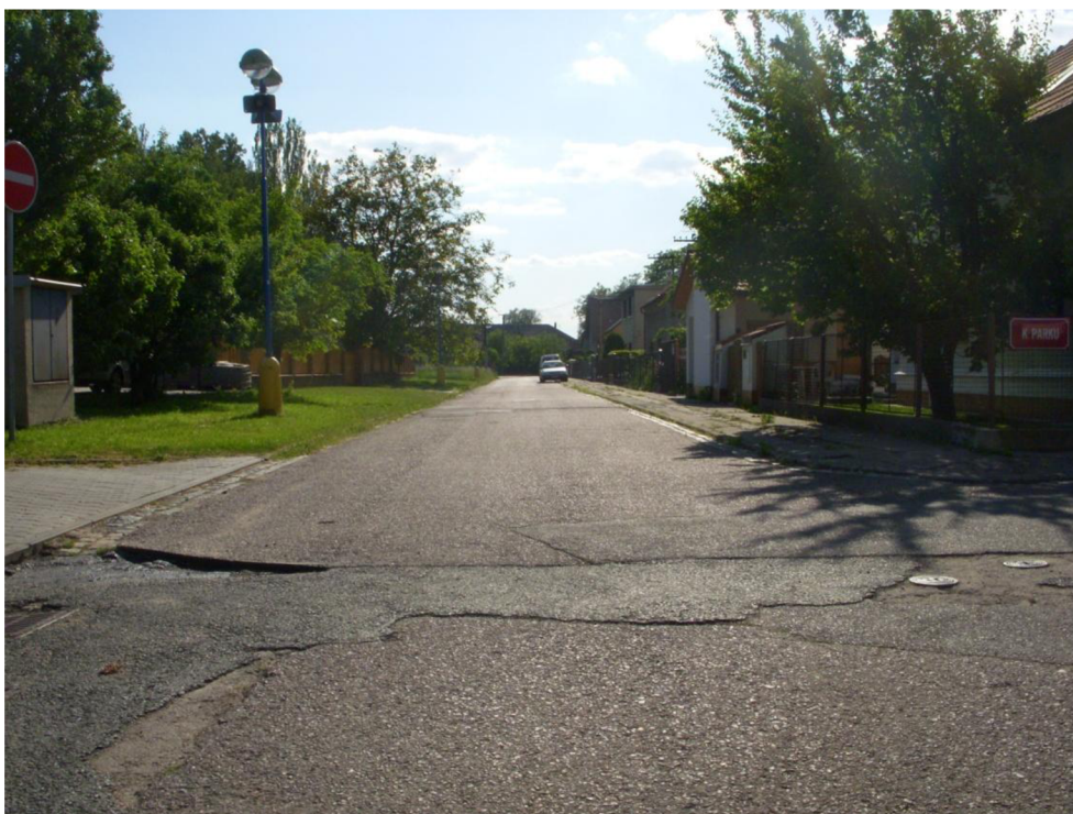
Obrázek 9: Pohled do ul. Prokopova od křížení s ul. Závodní směrem k ul. Větrná - po levé straně budou vytvořeny nové parkovací pruhy