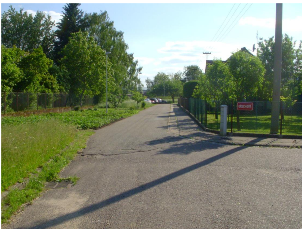
Obrázek 12: Pohled do ul. Nádražní od ul. Větrná - vlevo bude vytvořen nový parkovací pás