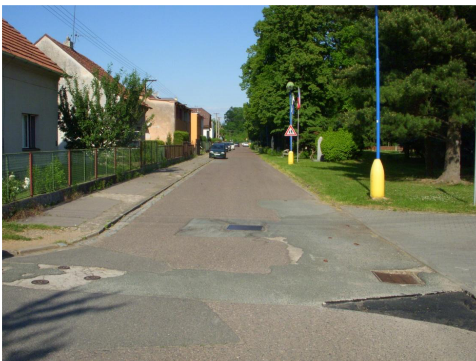
Obrázek 6: Pohled zpět do ul. Prokopova od křížení s ul. Závodní