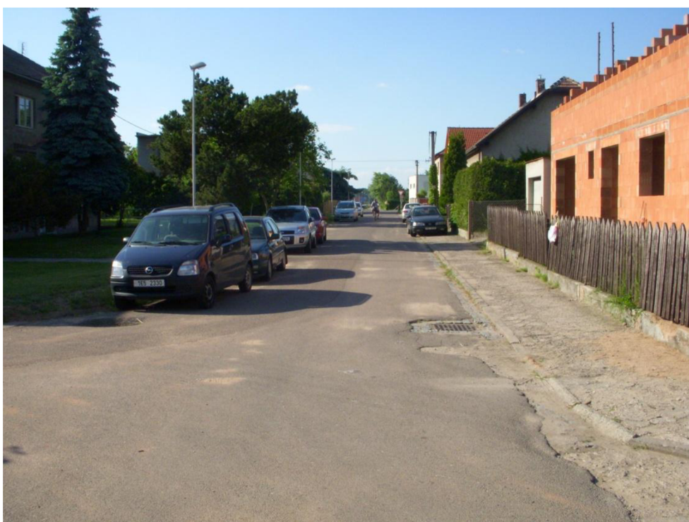
Obrázek 16: Pohled do ul. Nádražní směrem k silnici III/0362