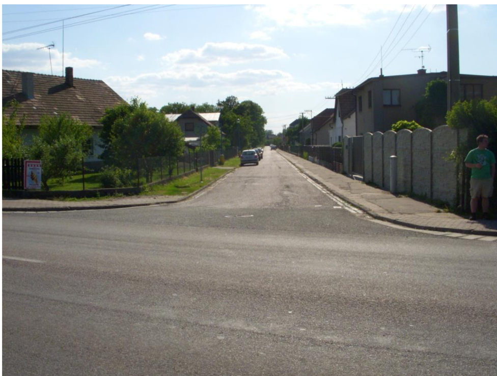
Obrázek 1: Pohled do ul. Šafaříkova od silnice II/324 - vlevo po směru jízdy bude vytvořen nový přidružený parkovací pruh pro stání