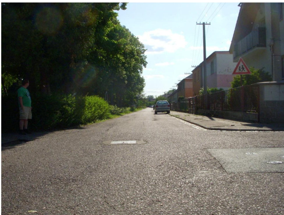
Obrázek 5: Pohled do ul. Prokopova od křížení ulic Šafaříkova a Brandlova - po levé straně budou vytvořeny nové parkovací pruhy