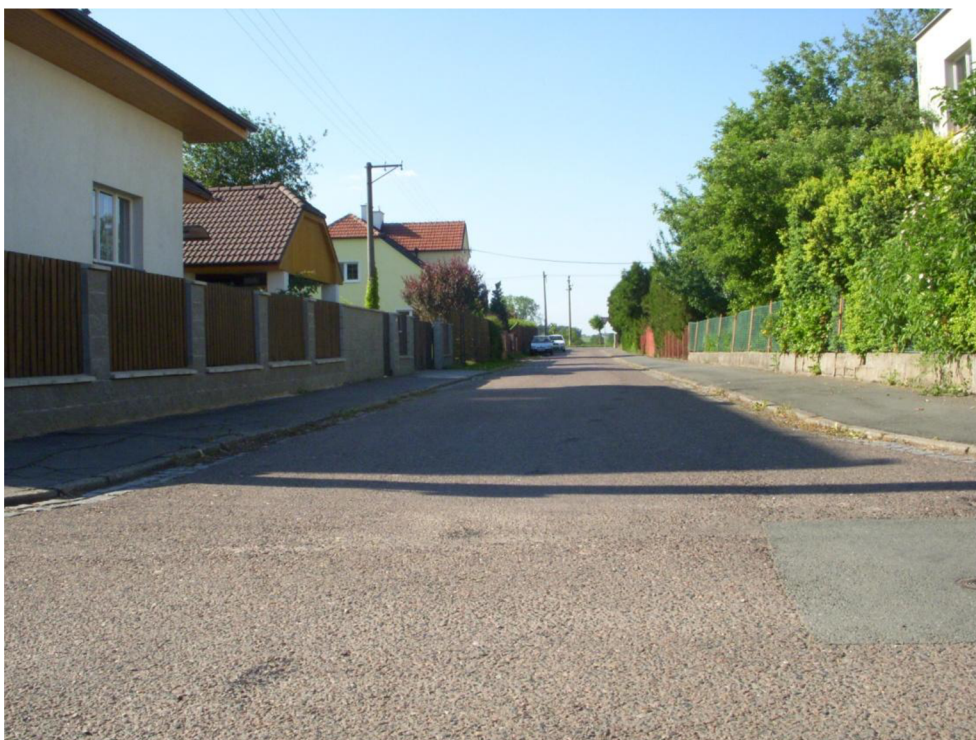
Obrázek 3: Pohled do ul. Brandlova směrem k silnici III/0362 - vlevo po směru jízdy bude vytvořen nový přidružený parkovací pruh pro stání