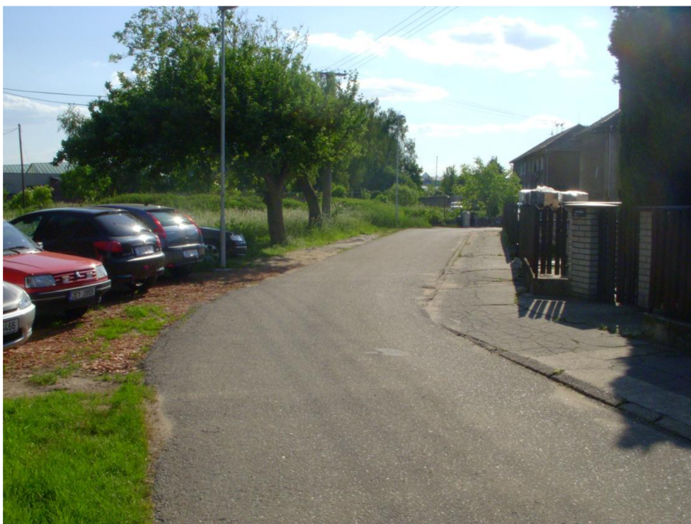
Obrázek 13: Ulice Nádražní