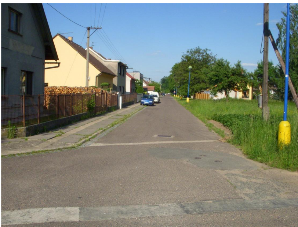
Obrázek 10: Pohled zpět do ul. Prokopova od ul. Větrná