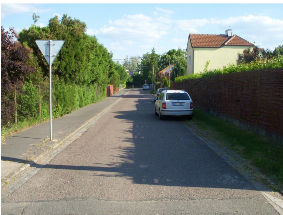
Obrázek 4: Pohled do ul. Brandlova od silnice III/0362