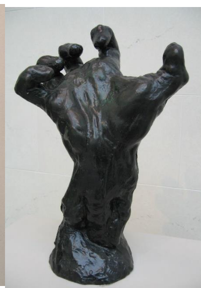
Obr. 3 La Grande Main Crispée