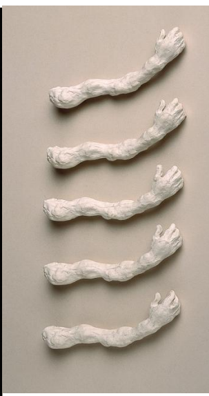
Obr. 2 Right Arms, rozměry 2,5×13×3,4, rok 1890-1900