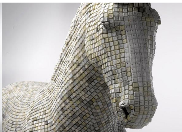
Obr. 20 Hedonism Trojaner- detail