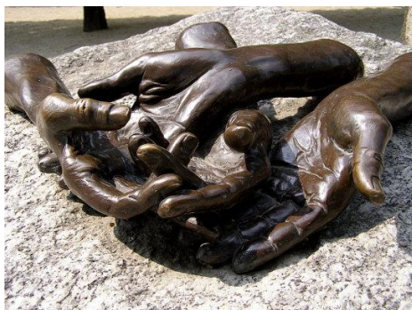
Obr. 7 Welcoming Hands

Francouzská sochařka narozena roku 1911. Její rodina vlastnila tkalcovskou dílnu, kde mimo jiné restaurovali staré látky a tapisérie. Již od mládí zde doplňovala chybějící části tapisérií a právě to ji později přivedlo k umění. V průběhu své tvorby velmi experimentovala s různými materiály i náměty. Jako první umělkyně se zabývala instalací, kde uspořádala své sochy jako související část kontextu. To ji také přivedlo k novým možnostem jak pojímat dílo. Námětu rukou se věnovala spíše v pozdější fázi života. Welcoming Hands (Vítající ruce) z roku 1996, se nyní nacházejí v New Yorku. Dílo je odlito z bronzu a umístěno na žulovém bloku. Vidíme zde dvě lehce se držící ruce, vyzařující jistou laskavost a vlídnost. Zajímavým prvkem je zde kontrast mezi poměrně ženskými vlastnostmi a tvrdou industriální strukturou. Později se z Louise Bourgeois stala významná feministická umělkyně. 8