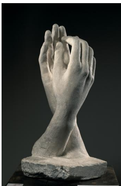
Obr. 4 The Cathedral , rozměry: 63×29,5×31,8, rok 1908

Podobně jako The Secret (Tajemství), patří toto dílo k sérii do mramoru tesaných prací, provedených povětšinou po roce 1900, mezi které patřila také Ruka Boží , Ruka Ďáblova ( The Hand of the Devil ), Hands of Lovers (Ruce milenců) a Hand from the Tomb (Ruka z hrobu). V širším kontextu pak dílo zdůrazňuje Rodinovy sympatie či dokonce vášeň vůči námětu rukou. Z tohoto důvodu je pak také oddělil do samostatných fragmentů v kolekci Antiques . 7