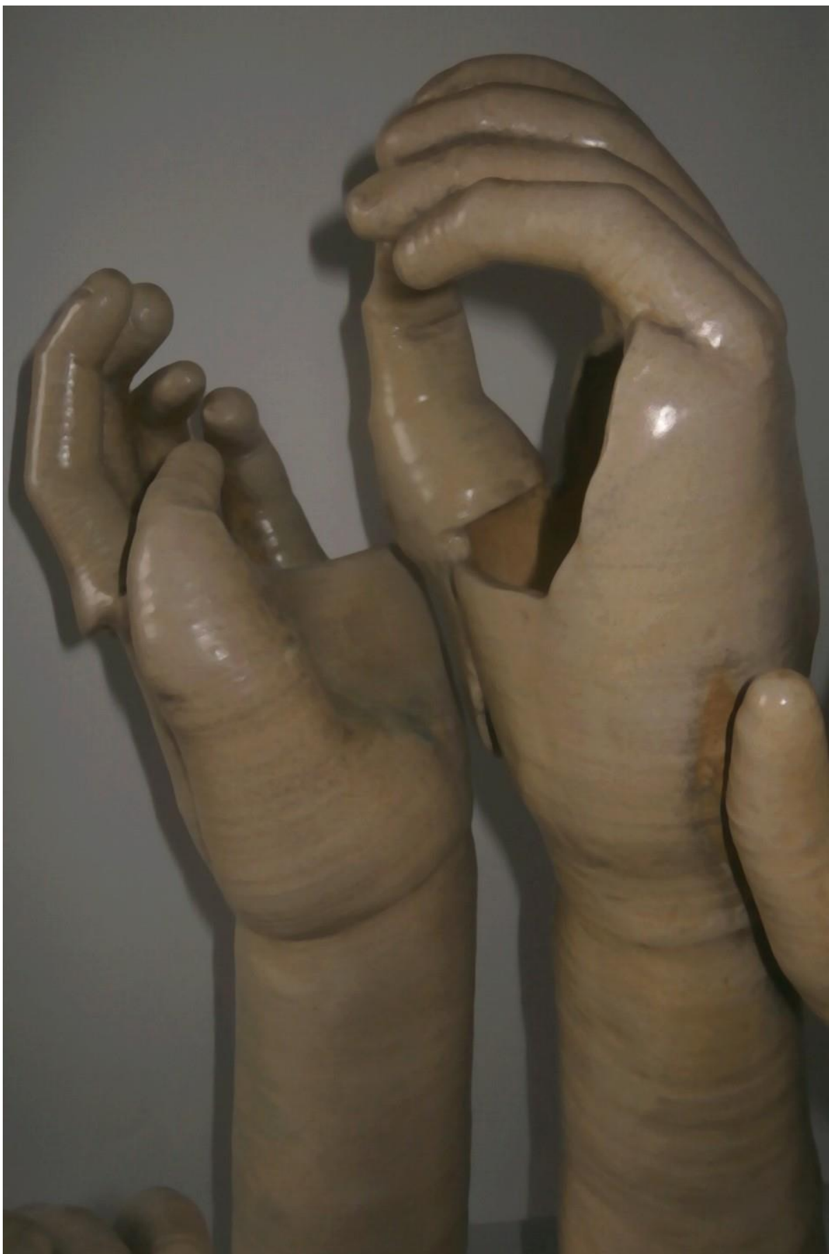
Obr. 34 Hotová práce – detail