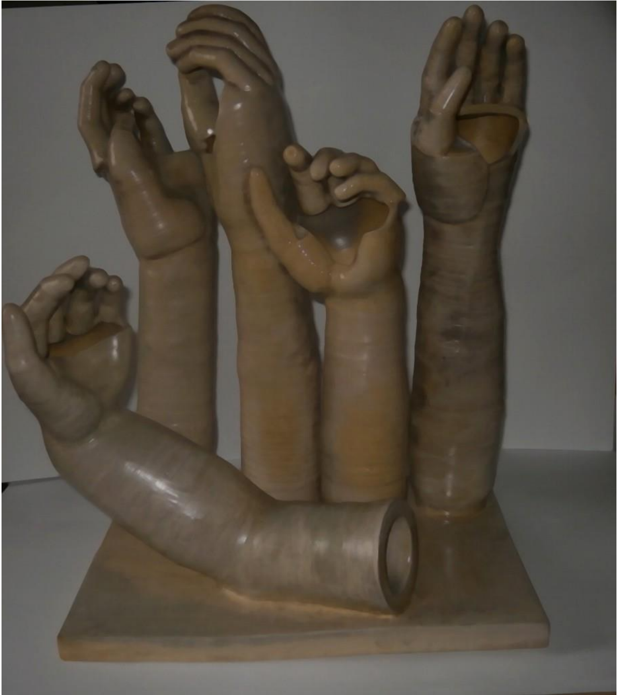
Obr. 33 Hotová práce 1