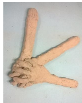
Obr. 23-25 Ruce vytvořené dětmi, 23- Vlastní ruka, 24- Mávající ruce, 25- Ruce rodiny