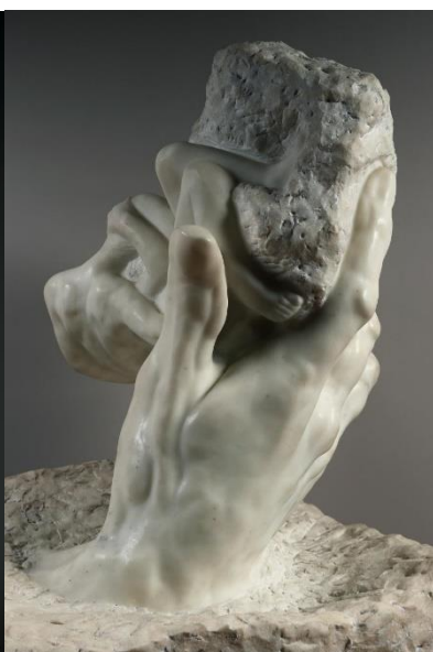
Obr. 5 The Hand of God