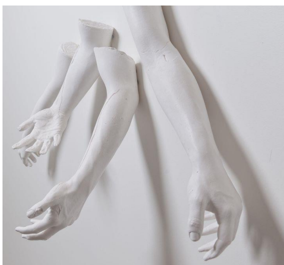
Obr. 16 Ingression

Umělkyně, narozena roku 1980 v Anchorage na Aljašce, v současné době pobývající v New Yorku. Využívá mnoho druhů materiálů, je významná umělkyně, autorka básní a tanečnice. Její tvorba kombinuje hmotnou realitu, stejně tak jako úryvky vzpomínek a představ uvnitř mysli a těla. Experimentování s námětem tělesného prostoru a vyjádření emocí skrze řeč těla odhaluje pravdu ležící v našich každodenních interakcích. Její tvorba obsahuje vnitřní sebereflexi, pomocí které je divákovi předkládán zřejmý paradox mezi nekončícím a stále se měnícím vědomím a pevnými fyzickými zákonitostmi těla. Výsledkem se tak stává přímá konfrontace se zranitelností a izolovaností lidských zážitků. 11