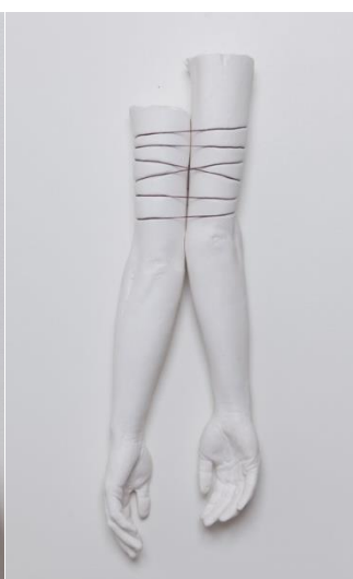
Obr. 17 Hidebound