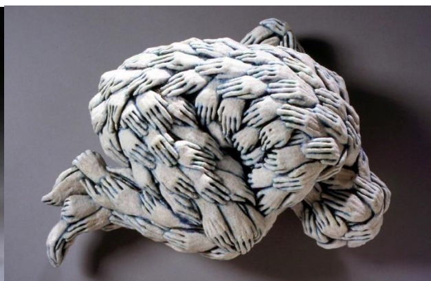
Obr. 22 Small Figure, rozměry: 6×11,5×11 rok 2008-2009