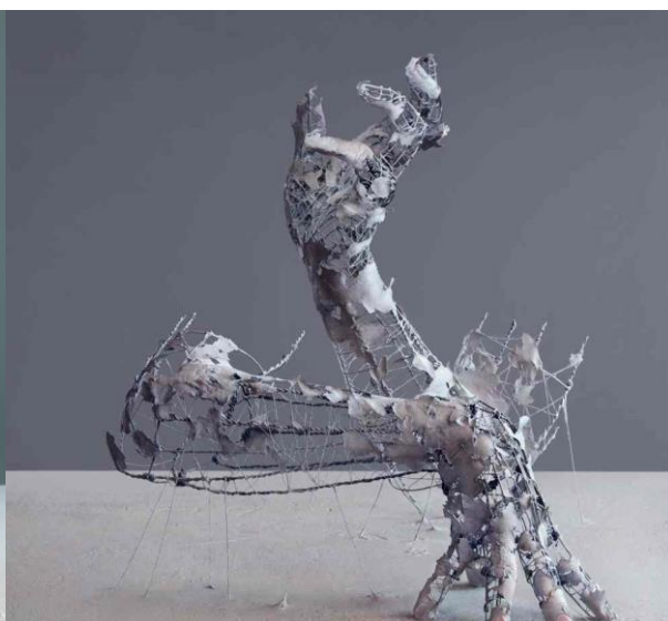
Obr. 15 Fragment of Long Term Memory 2