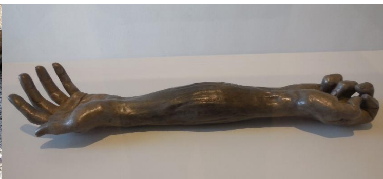
Obr. 8 Give or take