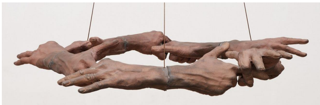
Obr. 13 Hand Circle

Hand Circle – Naumanova prezentace rukou, jakožto základního nástroje pro veškerou sochařskou tvorbu. V 60. letech autor pracoval na počtu voskových odlitek jeho vlastního těla, jejichž názvy představovaly určitou hru se slovy. Příkladem může být dílo Hand to mouth (Z ruky do huby), vytvořeno doslova jako odlitek části těla začínající od ruky a končící u úst. Autor často nechává díla bez názvu, tak aby ruce mohly mluvit samy za sebe. Gesta jsou pak otevřena interpretaci a mohou působit jako znaková řeč ale také jako mírně obscénní. 9