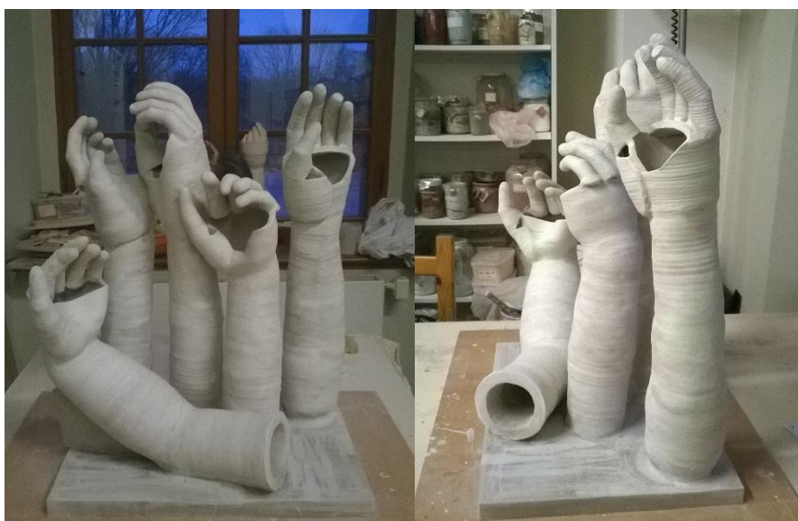
Obr. 30 a 31 Engobování

Až je celé sousoší pohromadě, přichází na řadu engobování. Engoby jsou barevné hlinky, které se používají k dekoraci, nebo zakrytí původního střepe. Jsou to jemně mleté směsi, zpravidla bílé se pálicího jílu, taviva a barvicí složky. Nanášejí se pod glazuru stříkáním, štětcem, kukačkou a poléváním. Použití engob nachází uplatnění jako povrchová úprava keramiky, kde není vyžadován slinutý skelný povrch. Použila jsem směs engoby bílé, zelené a bílé s mědí.