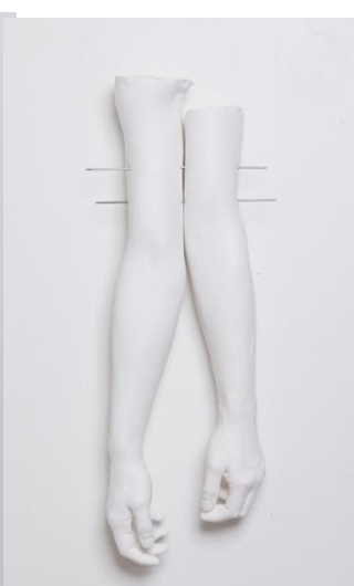
Obr. 18 Linchpins