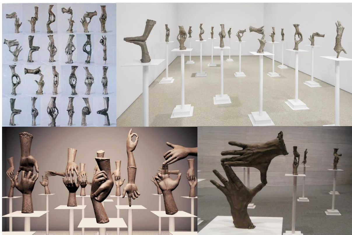
Obr. 9-12 Fifteen Pairs of Hands

Fifteen Pairs of Hands (15 párů rukou) je sochařská instalace vytvořená umělcem Bruce Naumanem, zobrazující 15 bronzových plastik rukou strnulých v různých pozicích. Každá část díla je pak prezentována jednotlivě, na vrcholku vlastního kovového podkladu natřeného na bílo. Je zde také možné pozorovat, jak spolu soubor odtělesněných rukou komunikuje. Skrze celou instalaci je viditelná autorova očividná fascinace lidskou rukou a nespočtem gest či forem, kterých může nabýt. Toto zaujetí je podpořeno faktem, že každý pár předvádí jiné gesto. V některých případech se zdá, že jsou ruce v páru zrcadlovým odrazem, zatímco jinde jsou tvarovány zcela jinak a to tak, aby se tvarem doplňovaly. Je zde tedy možné pozorovat souzvuk tvořící zřetelný útvar, stejně tak jako gesta surreálně protažena od zápěstí v opačném směru. Výsledkem je kolekce figurálních plastik působících téměř abstraktním dojmem. Zřetelná asociace se dokonce nachází mezi Naumanovým dílem a praxí v komunikaci gesty rukou. I beze slov a zvuků se zdá, jakoby vystavené ruce pomocí těchto gest mezi sebou komunikovaly.