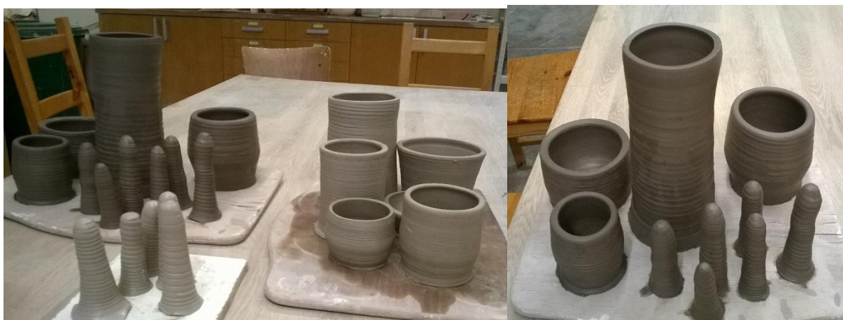
Obr. 26 a 27 Vytočené části

Každou ruku jsem točila nejprve od loktu do půlky předloktí a na to jsem následně vytočila zbylou část předloktí. V následujícím kroku jsem si vytočila dlaň a jednotlivé prsty. Vždy jsem udělala pár částí navíc pro dotvoření realističtější ruky, nebo pro podlepení prstů při lepení.