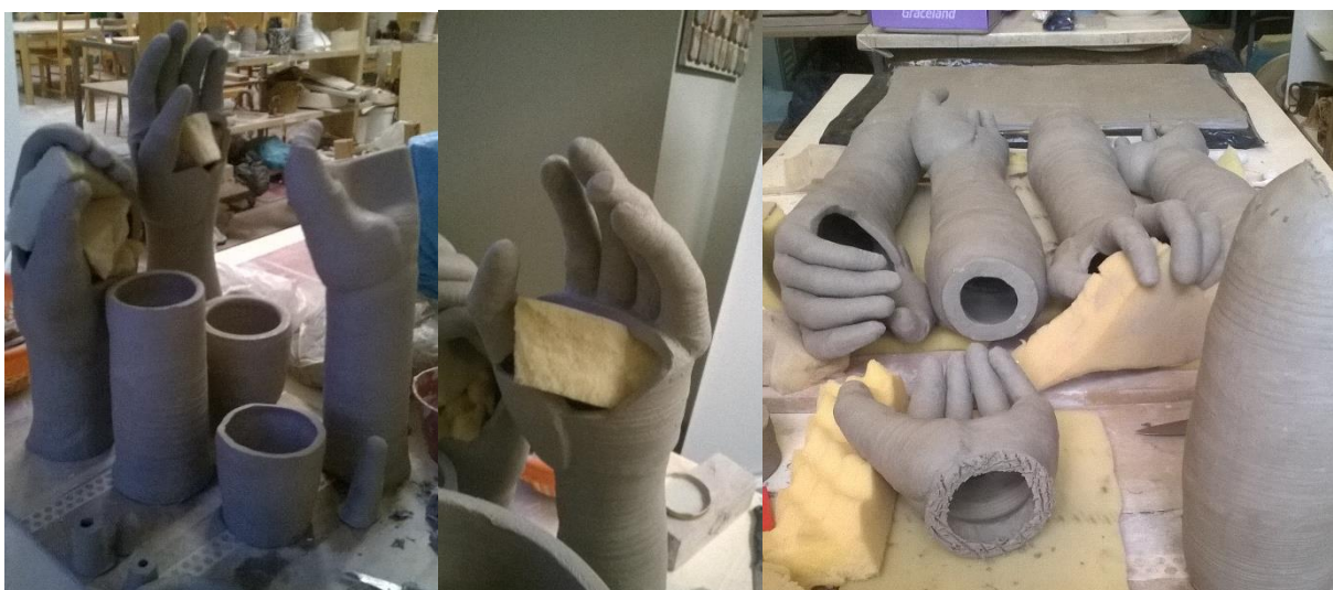
Obr. 28-29 Lepení

Po mírném zatuhnutí točených rukou jsem jednotlivé části naškrabala a pomocí šlikru (hlína s vodou), jsem slepila dohromady paži. Zaříznutím okraje dlaně a jejím nalepením na paži jsem dosáhla přirozeného ohnutí. Na některé dlaně jsem připevnila část, která vytváří sval palce, a v místě hlubokých svalů dlaně jsem výrobek mírně protlačila. Některé části rukou jsou i prořezávané namísto protlačování pro získání svého autentického vzhledu. Každý spoj je pečlivě špachtlí zapravený, aby nedošlo k jejímu následnému popraskání. Prsty jsou původně točeny z jednoho kusu. Aby vznikl jejich přirozený ohyb, nařezala jsem je na tři části a po otočení částí o 90° jsem je znovu naškrabala a slepila šlikrem. Některé prsty jsem lepila přímo na vrchní okraj dlaně a u některých jsem si pod prsty namodelovala plochu pro lepší posazení a tvarování. K ležící ruce jsem vytočila navíc paži. Jako jediná ruka je zde i s půlkou paže, ostatní jsou zakončeny tam, kde se nachází loket.