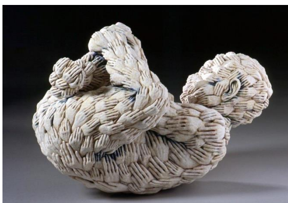
Obr. 21 Held Baby