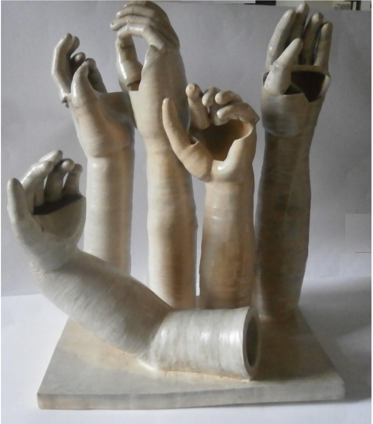
Obr. 32 Hotová práce, podstavec 36× 34 cm, výška sousoší cca 55 cm