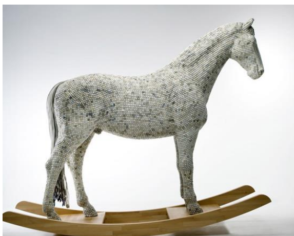
Obr. 19 Hedonism Trojaner

Tento německý umělec je znám mimo jiné díky jeho soše, kterou vytvořil z velkého počtu starých klávesových tlačítek. Dílo nese název Hedonism(y) Trojaner a jedná se o velkého houpacího koně, zpodobňující koně trojského, známého z řecké mytologie. Notoricky známá báje vypráví o dřevěném koni, sestaveném Řeky, za účelem vplížení se za nepřátelskou linii do Tróje. Použitím počítačových kláves autor odkazuje na nebezpečí ukrývající se v internetové komunikaci a současnou posedlostí technologiemi. Název díla, je mimo výše zmíněné báje, inspirován také počítačovým virem „Trojský kůň,“ čímž je symbolizována požitkářská a konzumní povaha moderní komunikace. Varuje také před nebezpečím narušení soukromí, příznačné právě pro internetovou komunikaci. 12