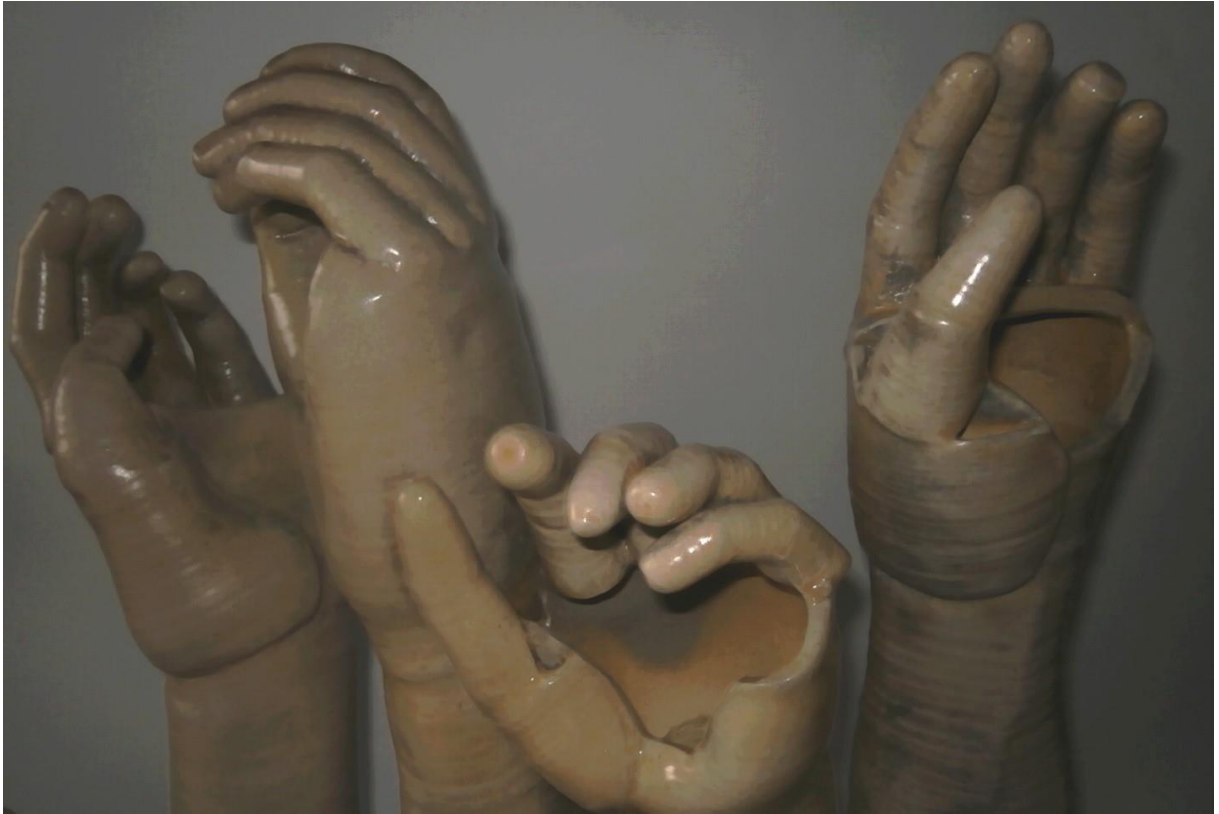
Obr. 35 Hotová práce- detail 2