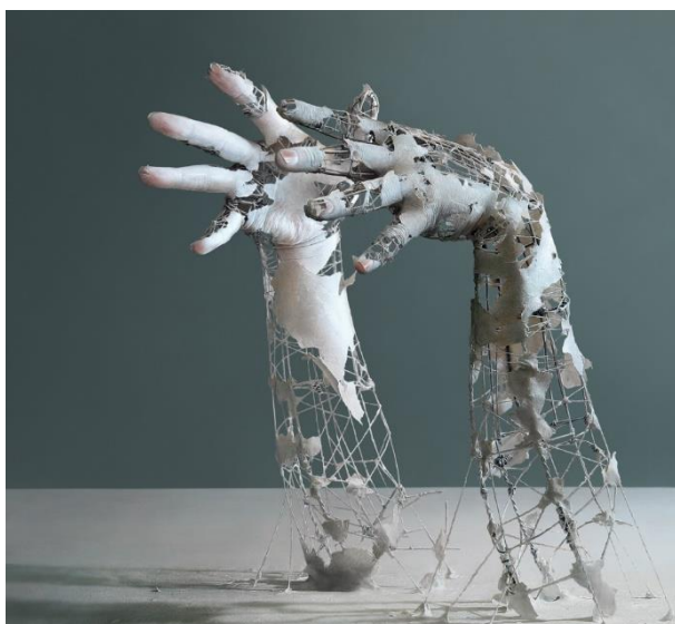
Obr. 14 Fragment of Long Term Memory 1

V Yuichiho tvorbě můžeme nalézt fotografie krajin, stejně tak jako autoportréty na nichž se autor natírá na bílo. Snaží se ukázat velmi důvěrné spojení fiktivního, skutečného a fakt, že hranice mezi těmito dvěma světy není vždy úplně jasná. Realita je pro Ikehata klíčem k neskutečnému a naopak. 10