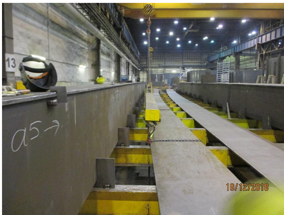
Obrázek 1: Pracovní prostor vztahující se k pracovnímu úrazu