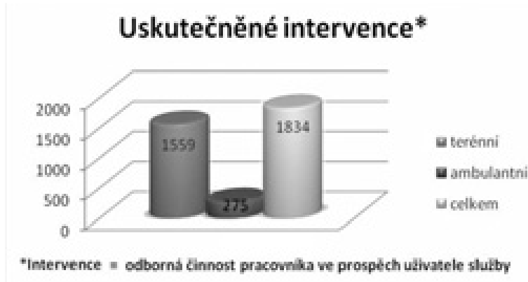
Obrázek č. 5

Z níže uvedeného obrázku můžeme vyčíst, že počet poskytnutých intervencí byl za rok 2012 1834, z toho většině klientů byla poskytnuta terénní forma této služby.