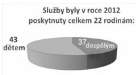
Obrázek č. 4 ( www.hodonin.charita.cz )

Počet ohrožených rodin, kterým byla v roce 2012 poskytnuta sociálně aktivizační služba, je 22. Z toho bylo 37 dospělých osob a 43 dětí. Ze zmíněných informací lze tedy konstatovat, že jestliže kapacita klientů, tedy rodin, je 18, tak během roku měly možnost tuto službu využít další 4 nové rodiny.