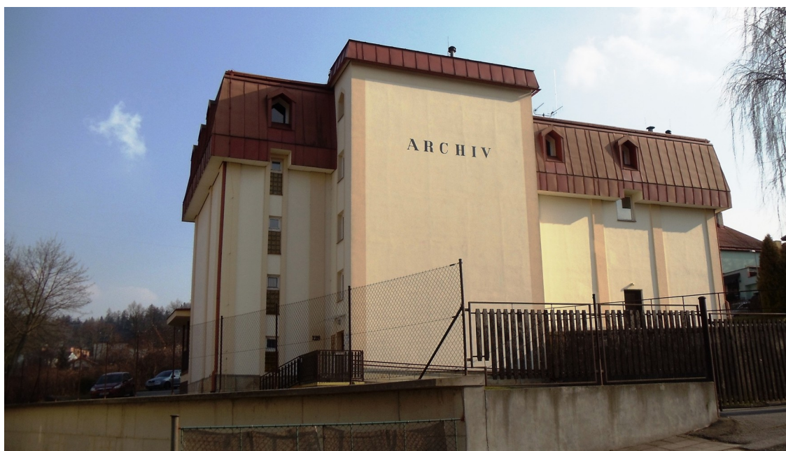
Obr. 2 Budova SOkA Trutnov.