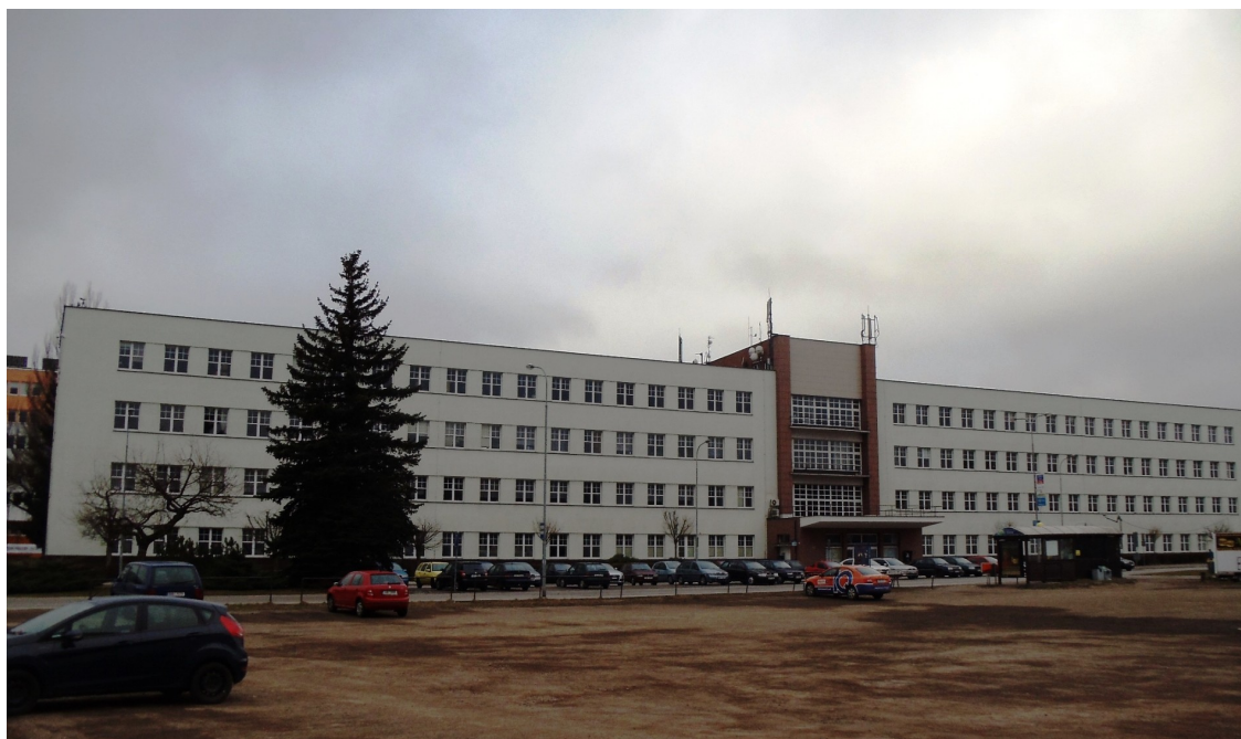
Obr. 1 Budova OkÚ Trutnov.