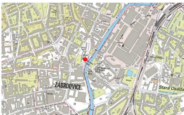
Obr.2 – Mapa poddolovaných území lokality

Řešené území se nachází v blízkosti stávající řeky. Záplavové území Q100 ale nedosahuje na pozemek investora, tudíž nejsou třeba provádět žádná opatření (objekt se nachází mimo záplavové území).