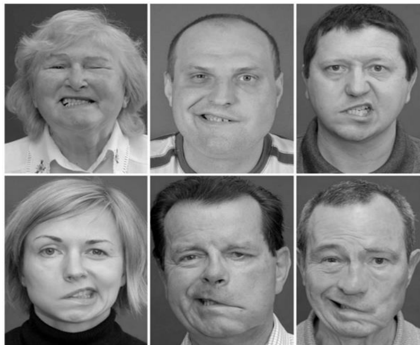
Obrázok 2 Pacienti s akútnou obrnou lícneho nervu – horný rad a chronickou obrnou lícneho nervu – dolný rad (prevzaté z: Dobel et al., 2012, s. 13)

Obojstranná paréza tvárového nervu je neobvyklá, ktorá sa vyskytuje u 0,3 až 2 % všetkých obrn. Obojstranná obrna je dôležitá, pretože je oveľa pravdepodobnejšie, že predstavuje systémový prejav ochorenia, pričom menej ako 20 % prípadov je idiopatických. Lymská borelióza tvorí významnú časť obojstranných obrn lícneho nervu, čo predstavuje približne 35 % prípadov. Medzi ďalšie dôležité diferenciálne úvahy patrí Guillain-Barreov syndróm, cukrovka a sarkoidóza. Neurologické príčiny bilaterálnej obrny lícneho nervu zahŕňajú Parkinsonovu chorobu, roztrúsenú sklerózu a pseudobulbárnu alebo bulbárnu obrnu (Walker, Mistry, Mazzoni, 2021).