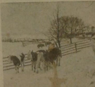
Vzdutný odchov telat na farmě Voškové duží. I v zimě poskyt chovatel telátka na krátký čas do výběhu.

lečné záhumenky značnou výhodu, odpadly starosti ze shánění potaha, nemuseli se loupit v nešlách a po večerech Tyto výhody společných záhumenek vedly k tomu, že dalších šestnáct družstevníků se rozhodlo pro společné záhumenky.