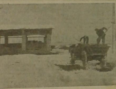
Komposty byly a budou vždy významným hnojivem na louky. Je proto třeba využít zimního období k jejich skládání, tak jak to dělají na našem snímku na Hluboké.

Vedení Státního statku Protivín rozebralo směrná čísla pátiletého plánu na všechna oddělení. V plánu se počítá s postupným zvyšováním výroby podle vyvíjejících podmínek. Tak oddělení Bor má v roce 1961 dosáhnout průměrný hektarový výnos žita 26 centů a v roce 1965 již 30 centů, u pšenice z 29,98 centu na 35 centů, dovojit z 6,53 litru mléka na 7,18 litru. V současné době probíhá na provozovněch provádění tohoto směrných čísel se všemi zaměstnanci. Zároveň jsou projednávány úkoly letošního roku, které jsou rozepsány v živočišné výrobě na jednotlivce a v rostlinné výrobě na skupiny a čety. Zaměstnanci dávají k návrhu pátiletky své připomínky. Tak v provozovně Mirovice pracovníci poukázali na nutnost více využívat levné Mývaté píče k výkrmu prasat. K výkrmu se doposud používalo pševážně obilí, kterého bylo převezeno ze sklád v minulém roce 25 vagonů, čímž vznikali zbytečné náklady. Do 15. ledna budou na podkladě připomínek zaměstnanců na odděleních vypracovány návrhy plánu třetí pětiletky.