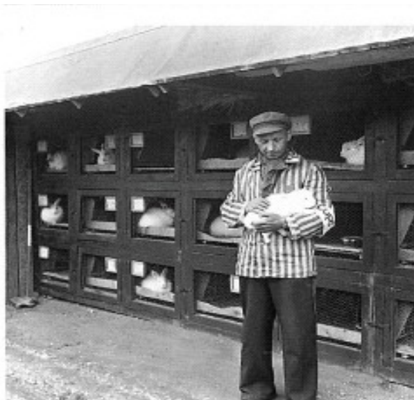
Králíčí farma v Dachau