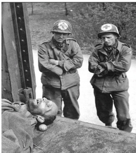
Zdravotníci z Rainbow Company