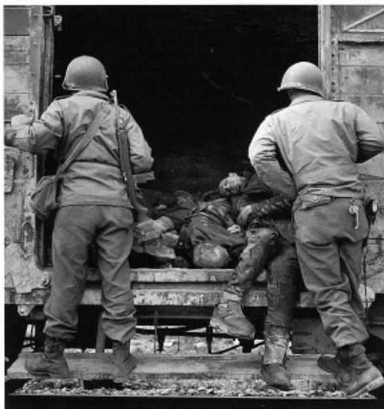
Vojáci a vagón plný mrtvých těl vězňů