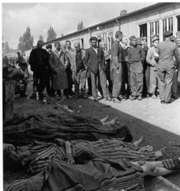
Těla před ubikací, čeká se na jejich pohřbení