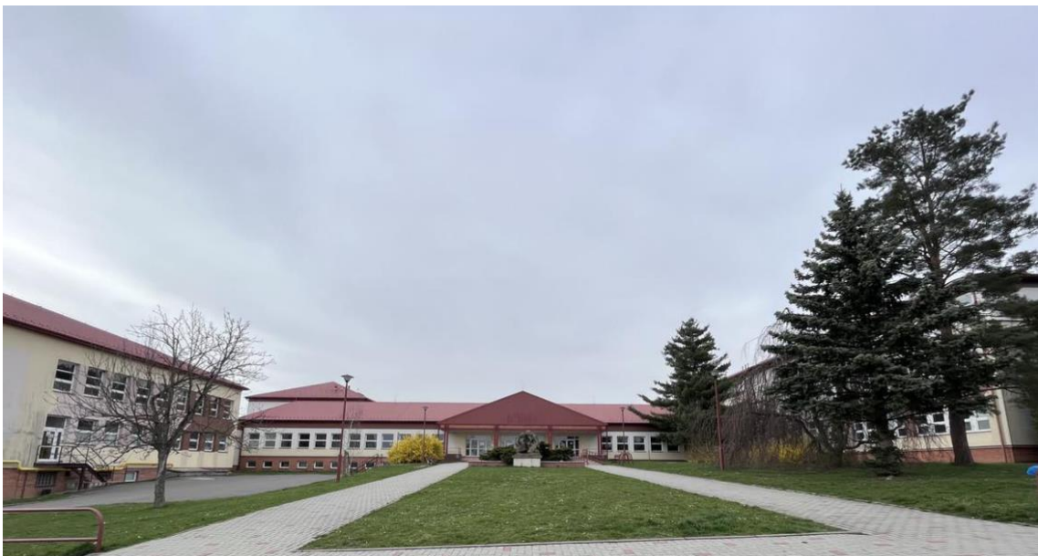
Obrázek č. 8: Budova Základní školy a gymnázia města Konice, současnost