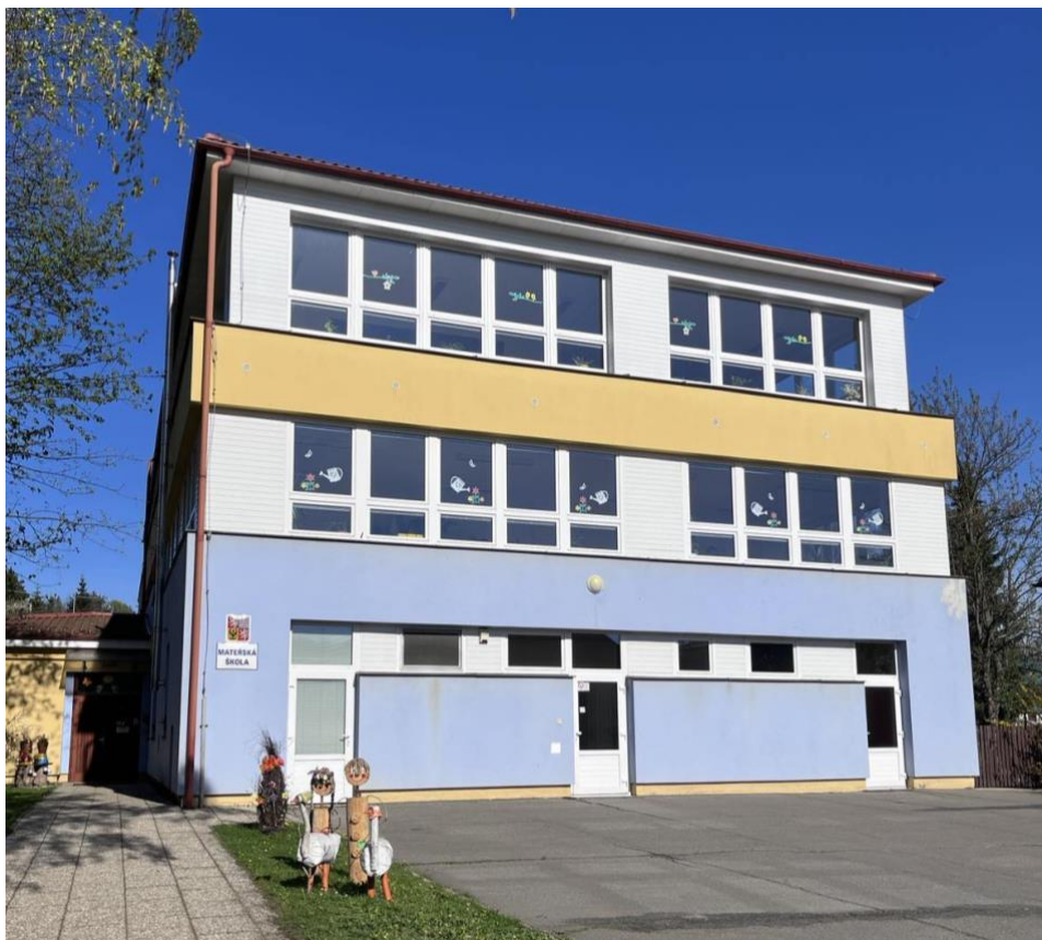
Obrázek č. 10: Budova mateřské školy v Konici, současnost