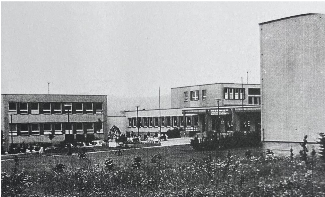
Obrázek č. 6: Škola v roce 1978 (SCHÖN, Jaromír. Z dějin vzdělávání & Základní škola a gymnázium města Konice . Konice: ZŠ a G města Konice a SPŠ, 2000, s. 26)