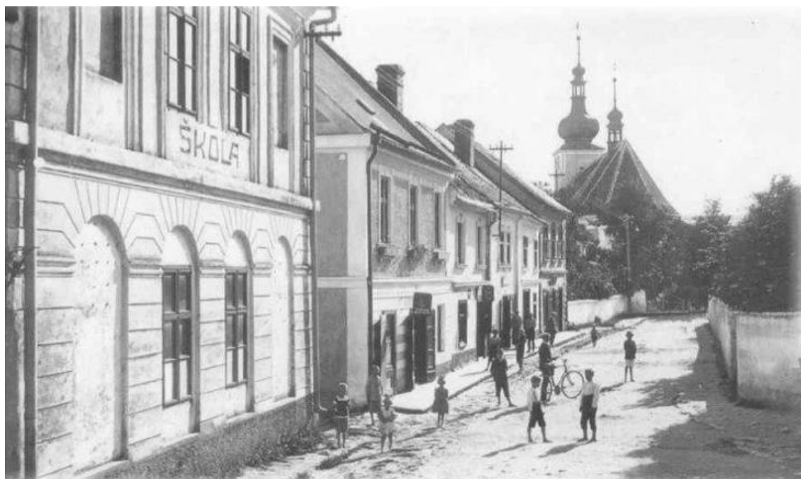
Obrázekč. 2: Škola v Kostelní ulici (SCHÖN, Jaromír. Z dějin vzdělávání & Základní škola a gymnázium města Konice . Konice: ZŠ a G města Konice a SPŠ, 2000, s. 18)