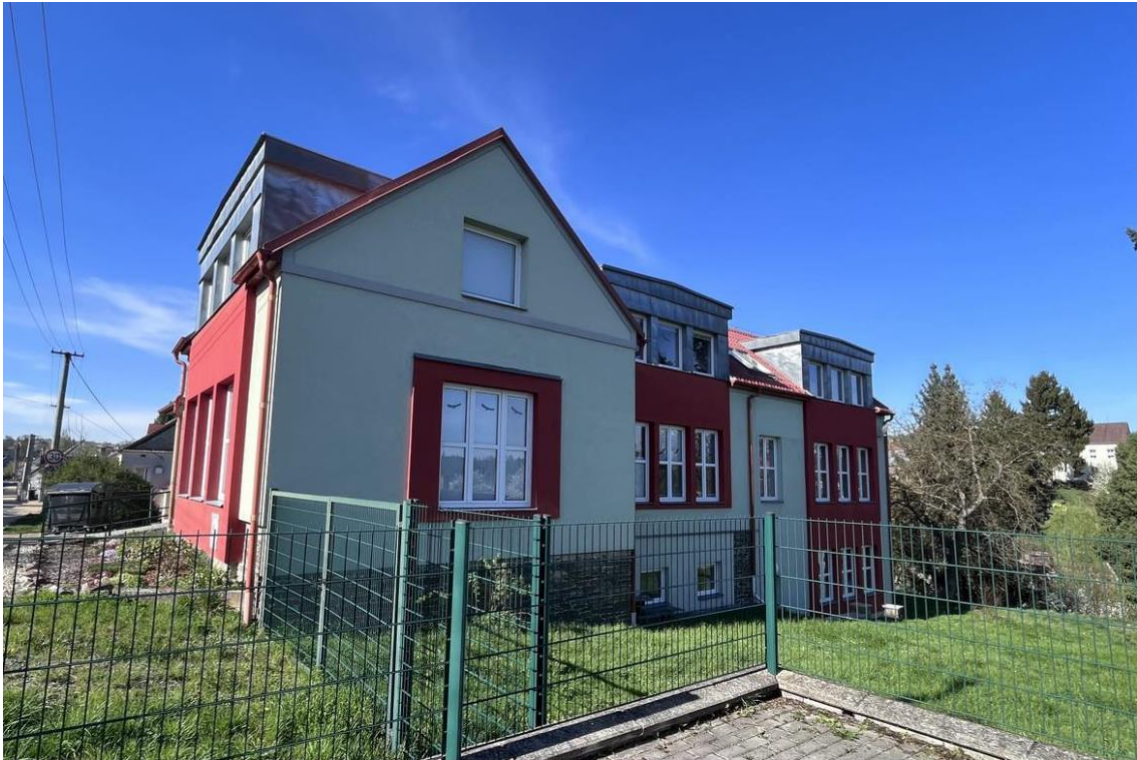
Obrázek č. 9: Budova základní umělecké školy v Konici, současnost