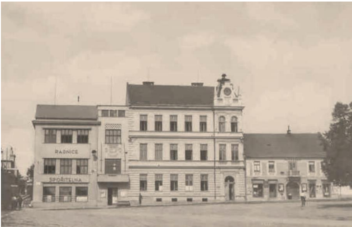
Obrázek č. 4: Měšťanská škola, vedle zrekonstruovaná radnice, rok 1935 (KUČEROVÁ, Anna. Konice v letech 1200–1989 . Konice: město Konice, 2017, s.18)