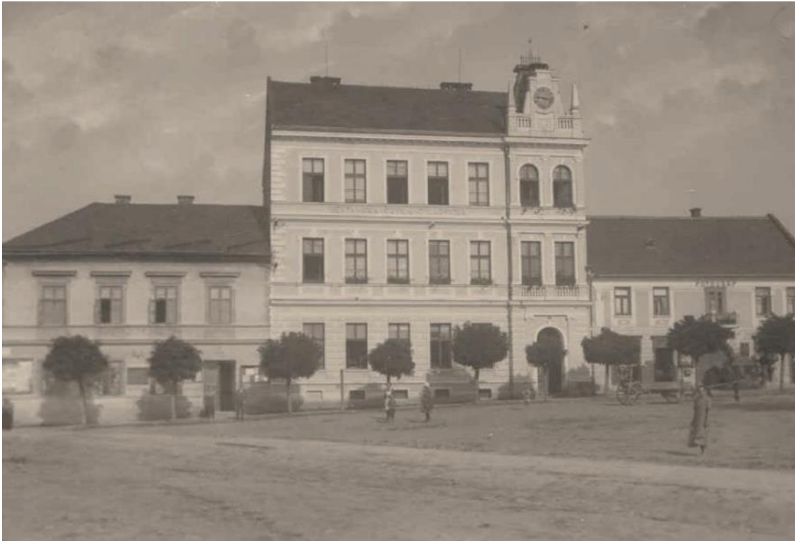
Obrázek č. 3: Měšťanská škola chlapecká (KUČEROVÁ, Anna. Konice v letech 1200–1989 . Konice: město Konice, 2017, s. 10)