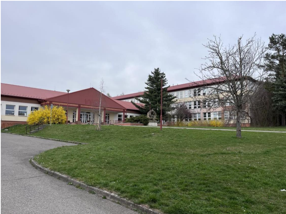
Obrázek č. 7: Budova Základní školy a gymnázia města Konice, současnost