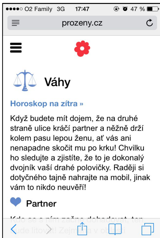
Obrázek 3: Snímek obrazovky 9. 5. 2016 Váhy, prozeny.cz