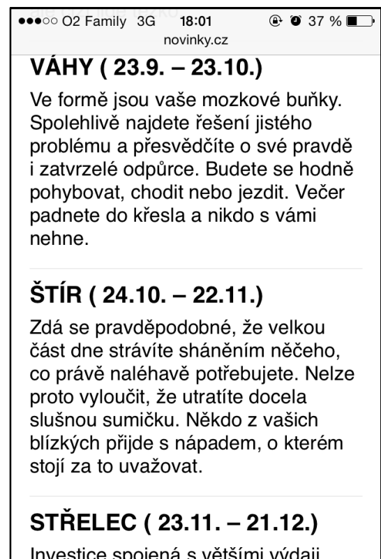
Obrázek 5: Snímek obrazovky 9. 5. 2016 Váhy, novinky.cz