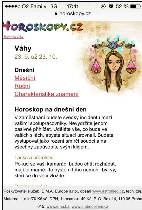
Obrázek 2: Snímek obrazovky 9. 5. 2016 Váhy, horoskopy.cz