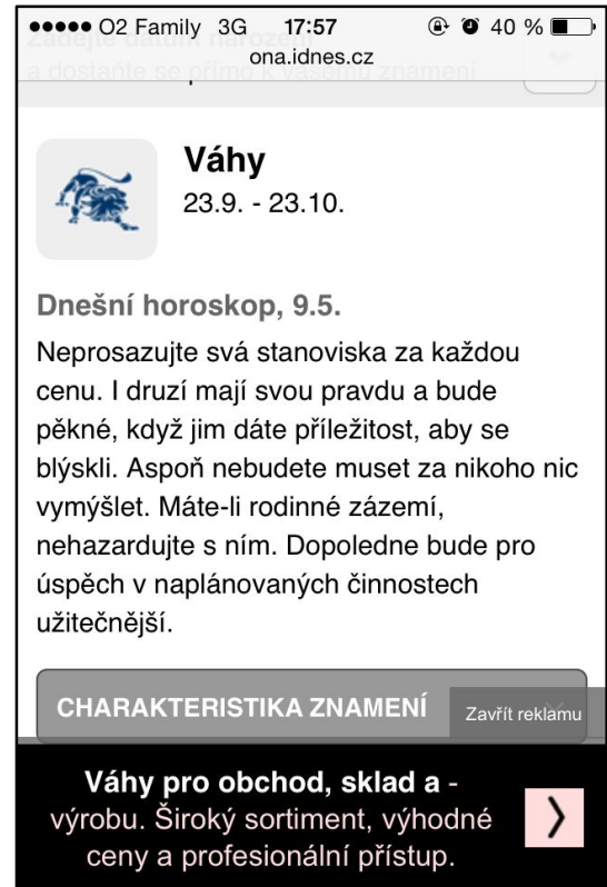
Obrázek 4: Snímek obrazovky 9. 5. 2016 Váhy, ona.idnes.cz