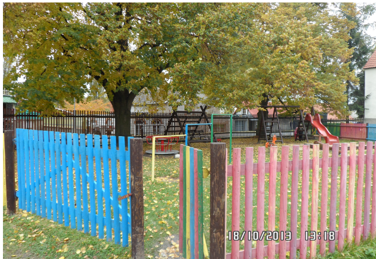
Obrázek č. 4: Dětské hřiště