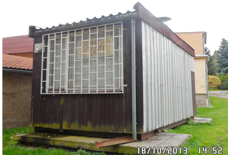
Obrázek č. 3: Obchod