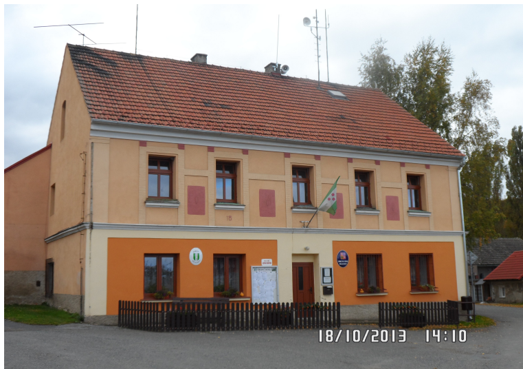
Obrázek č. 8: Obecní úřad