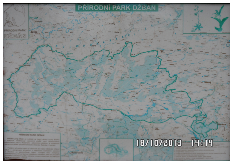
Obrázek č. 6: Přírodní park Džbán