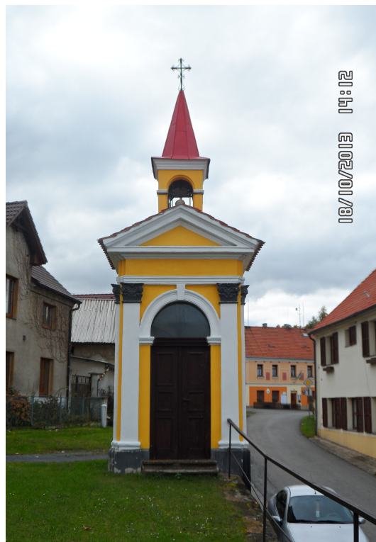
Obrázek č. 5: Bílichovská kaplička