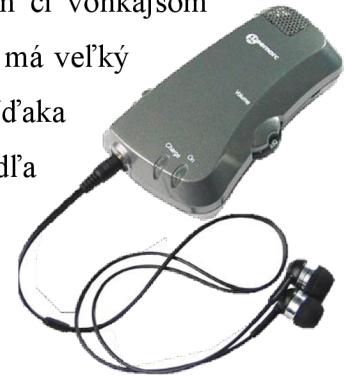
Obr. 11: Osobný zosilňovač

Pre takých sú tu iné pomôcky, ktoré je možné kúpiť z vlastného vrečka či s pomocou úradu práce. Medzi to patrí napríklad osobní zosilňovač . Táto pomôcka je jednoduchá na ovládanie a zosilňuje zvuk z okolia. Je vhodná pre konverzáciu v domácom či vonkajšom prostredí. Niekomu vyhovuje i na počúvanie televízora. Pomôcka má veľký mikrofón, častokrát i prídavný mikrofón, ktorý lepšie sníma zvuk. Vďaka univerzálnemu konektoru je možné si k nej dať slúchadlá podľa vlastného výberu. Ovládanie hlasitosti je jednoduché. Nevýhodou tejto pomôcky je to, že naozaj zaberá všetky zvuky, nedokáže ako načúvací prístroj odfiltrovať nadbytočný zvuk z okolia. (Osobní zesilovač zvuku, 2024)