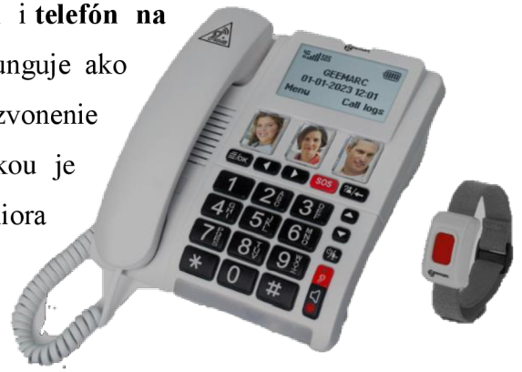
Obr. 14: Telefón na SIM kartu

Medzi ďalšími kompenzačnými pomôckami patrí i telefón na pevnú linku so zosilneným zvukom. Tento telefón funguje ako klasický telefón na pevnú linku, len má hlasitejšie zvonenie a hlasitejší zvuk hovoriacej osoby z telefónu. Novinkou je telefón na SIM kartu, ktorý vypadá ako pevná linka. Seniora nie je potrebné učiť na nový typ telefónu. Tento telefón je i vhodný pre seniorov, často majú veľké tlačidlá i s možnosťou vlastných obrázkov, rodiny či priateľov alebo aj SOS tlačidlá. Niektoré telefóny majú i možnosť