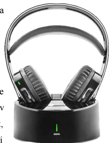
Obr. 13: Slúchadlá k TV

počúvanie sú bezdrôtovo spárované so základňou. Osoba si teda vezme slúchadlá na počúvanie a v kľude na gauči môže počúvať priamo do uší film či televízne správy. Zvuk z televízora nejde cez vzduch od reproduktora televízora, zvuk je teda cez slúchadlá k televízoru kvalitnejší. Niektoré slúchadlá majú i v sebe zabudovaný mikrofón. Vďaka tomu je možné ich používať aj ako osobný zosilňovač. Užívateľ môže počúvať televízor a v prípade osoby v miestnosti, môže slúchadlá prepnúť na funkciu mikrofónu a počúvať, čo daná osoba hovorí. Jediným úskalím tejto pomôcky sú možnosti pripojenia k televízoru. Na to je treba si dať pozor, hlavne nové televízory nemusia mať ani Jack konektor. Prípadne ak chce osoba so slúchadlami, aby zvuk išiel aj z reproduktorov televízora, musí zvoliť inú možnosť pripojenia, a to kábel Toslink, RCA kábel či SCART. Niekedy je nutné sa pozrieť aj do nastavení televízora a zvoliť správny formát zvuku. (Zesilovač zvuku, 2024)