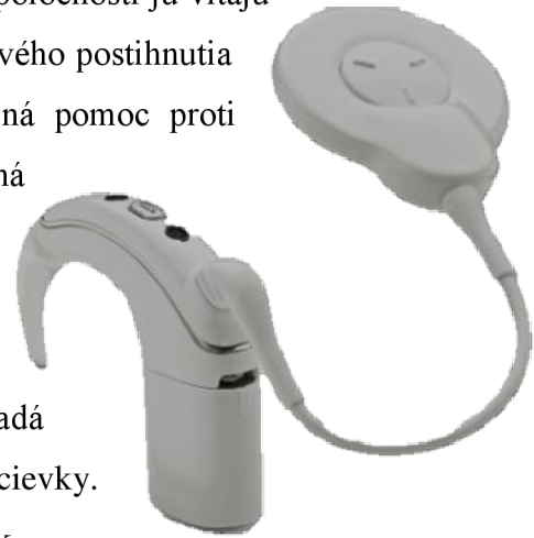
Obr. 5: Kochleárny implantát

Posledná pomôcka v tejto podkapitole bude kochleárny implantát . Táto pomôcka je sporná v komunite Nepočujúcich, pritom v majoritnej spoločnosti ju vítajú a považujú za záchranu. V medicínskom modeli sluchového postihnutia je kochleárny implantát podľa WHO braná ako jediná pomoc proti hluchote. (Hradilová et al., 2023, s. 76) Pomôcka je určená pre osoby s úplnou stratou sluchu, ktoré ale majú funkčné sluchové nervy a centrum sluchu v mozgu. Táto pomôcka sa skladá z dvoch častí, z vonkajšej a vnútornej časti. Vonkajšia časť sa skladá z mikrofónu, zvukového procesoru a vysielacej cievky.