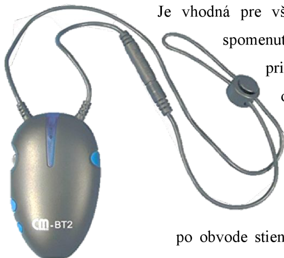
Obr. 9: Osobná indukčná slučka

Indukčná slučka je zariadenie, ktoré umožňuje počúvanie z reproduktora, hudbu či napríklad i reč do mikrofónu. Veľkou výhodou je, že nie je určená pre jeden načúvací prístroj.