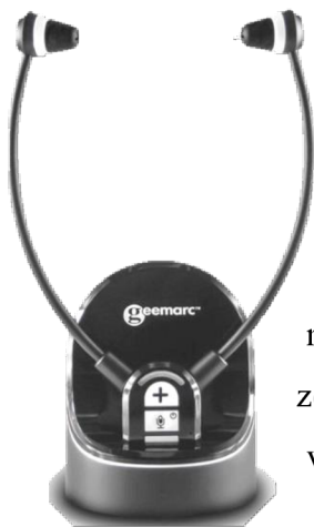
Obr. 12: Slúchadlá k TV – s mikrofónom

Keď niekomu na počúvanie televízora nevyhovuje osobní zosilňovač, dobrou alternatívou sú slúchadlá k televízoru . Táto pomôcka sa skladá zo základne a slúchadiel na počúvanie. Základňa sa spojí káblom s televízorom a slúchadlá na počúvanie sú bezdrôtovo spárované so základňou. Osoba si teda vezme slúchadlá na počúvanie a v kľude na gauči môže počúvať priamo do uší film či televízne správy. Zvuk z televízora nejde cez vzduch od reproduktora televízora, zvuk je teda cez slúchadlá k televízoru kvalitnejší. Niektoré slúchadlá majú i v sebe zabudovaný mikrofón. Vďaka tomu je možné ich používať aj ako osobný zosilňovač. Užívateľ môže počúvať televízor a v prípade osoby v miestnosti, môže slúchadlá prepnúť na funkciu mikrofónu a počúvať, čo daná osoba hovorí. Jediným úskalím tejto pomôcky sú možnosti pripojenia k televízoru. Na to je treba si dať pozor, hlavne nové televízory nemusia mať ani Jack konektor. Prípadne ak chce osoba so slúchadlami, aby zvuk išiel aj z reproduktorov televízora, musí zvoliť inú možnosť pripojenia, a to kábel Toslink, RCA kábel či SCART. Niekedy je nutné sa pozrieť aj do nastavení televízora a zvoliť správny formát zvuku. (Zesilovač zvuku, 2024)