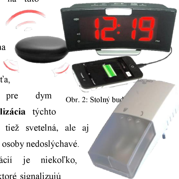
Obr. 2: Stolný budík