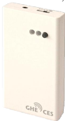
Obr. 3: Vysielač k svetelnej signalizácii

V domácnosti sú podnety založené na zvuku, zvonček, zvonenie telefónu, plač dieťaťa, varovný signál pre dym v domácnosti. Signalizácia týchto podnetov môže byť tiež svetelná, ale aj zvuková, vhodná i pre osoby nedoslýchavé. Svetelných signalizácií je niekoľko, základné podnety, ktoré signalizujú