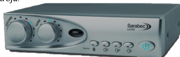
Obr. 10: zosilňovač k priestorovej indukčnej slučky

(Indukční smyčky, 2024) Načúvací prístroj je vtedy nápomocný a užitočný, keď je nastavený dobre a užívateľovi s prvými načúvacími prístrojmi je venovaná dostatočná starostlivosť. Podľa zoznamu