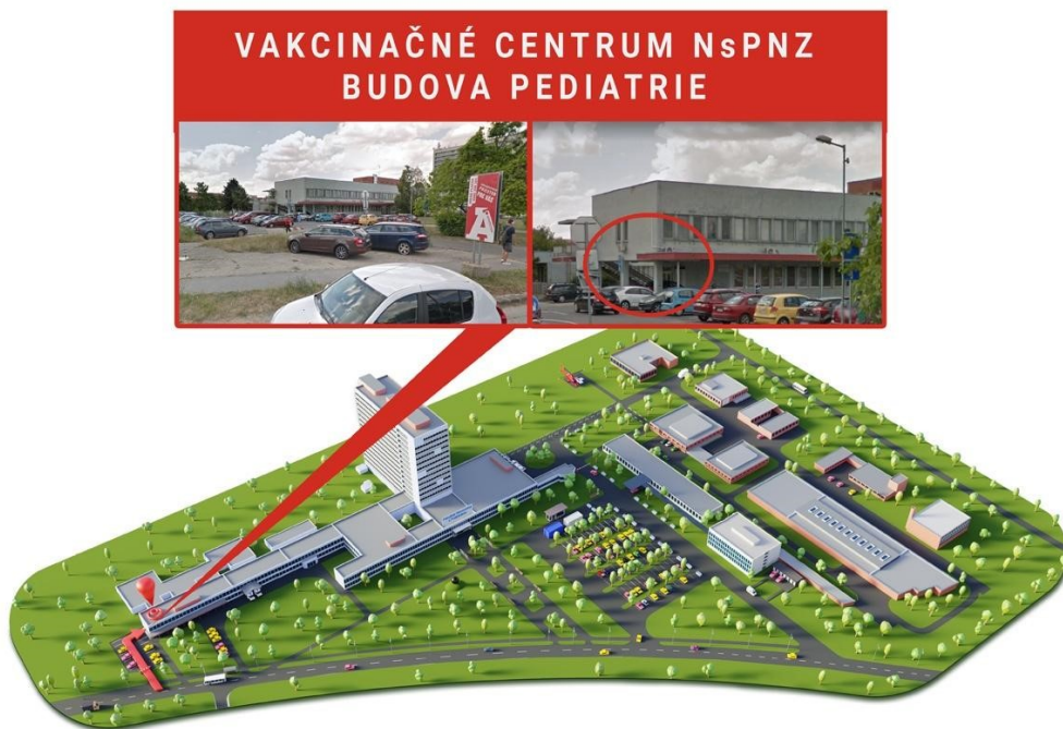
Obr. 2.2 Vakcinačné centrum NsPNZ

spadajúcich do kategórie v zmysle národnej očkovacej stratégie Ministerstva zdravotníctva SR. FNŠP NZ vďaka dvom darcom mohla okamžite zakúpiť tri mrazničky potrebné na uskladnenie vakcín. Týmto spôsobom sa výrazne urýchlil proces ich dodania. Mrazničky vo FNŠP NZ umožnili naskladniť viac vakcín naraz a spustiť očkovanie vo takpovediac veľkom. [18]