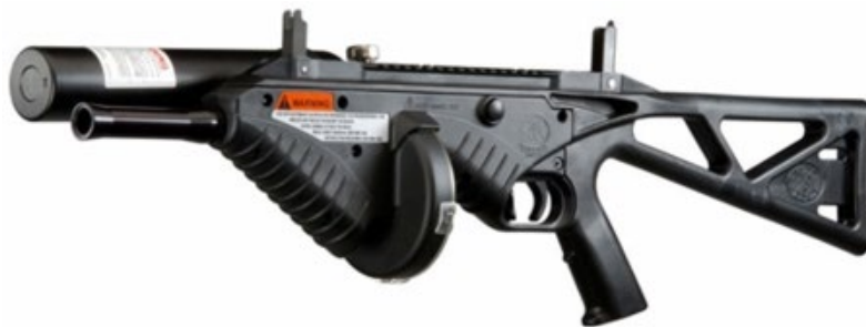
Obrázek 4 FN 303

FN 303 je soubor dvou méně než smrticích donucovacích prostředků fungujících na stlačený plyn. Jeho účelem je jednak obrana před pachateli jakéhokoliv násilí, s 99% jistotou, že přežijí zásah ruky zákona, a dále značkování, tedy označování agresivních jedinců nebo organizátorů nepokojů v davu, pro pozdější zadržení. V praxi se jedná o velmi prověřené prostředky, jež by zdravému jedinci neměly vážněji ublížit, ale i tak mu ušetří úder postačující ke zklidnění nebo alespoň přibrzdí násilné chování 10 .