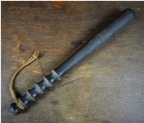
Obrázek 1 Truncheon

Za první neletální zbraň se považuje policejní obušek s názvem truncheon, byl používán strážníky Policie Spojeného království. Původní obušek byl vyráběn ze dřeva, které bylo obarveno na černo. Byl 12 palců dlouhý, což v naší metrické soustavě vychází na 30,48 cm. Měl tvar válce a konce byly zaobleny.