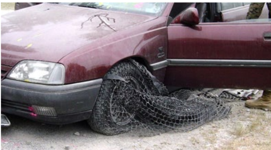
Obrázek 25 Arrest Net

Arrest Net vyvinut firmou Pacsci EMC je systém, který slouží k zastavení vozidla. Jedná se o kufr, ve kterém se nachází pás s hřebíky, na které je připevněna síť. Při dálkové aktivaci ovladačem z kufru, který je umístěn vedle silnice, nádržka se stlačeným plynem rozbálí pás s hřebíky. V momentě, kdy vozidlo projede přes pás, se hřebíky zapíchnou do pneumatiky vozidla, čímž díky jeho pohybu následně obalí nápravu pevnou sítí, která ho znehybní a po pár desítkách metrů zastaví, bez další možnosti ujíždění.