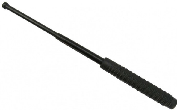
Obrázek 3 Teleskopický obušek