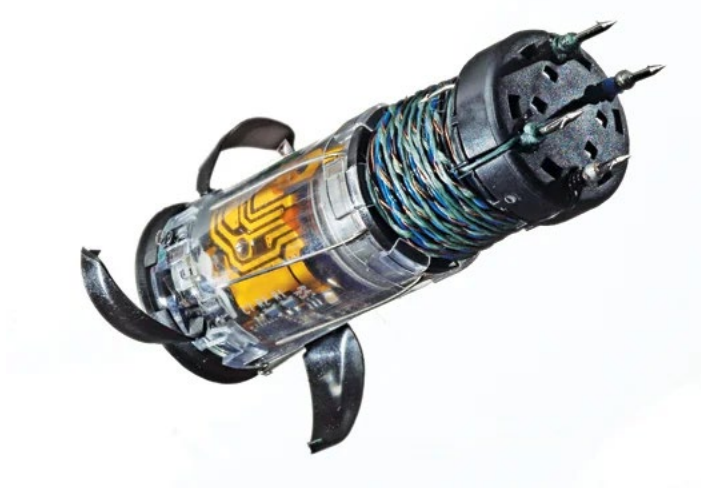
Obrázek 10 Taser XREP

Tento speciální náboj má dostřel až 30 metrů a může být využit k zpacifikování cíle, aniž by policisté museli opustit svou bezpečnou zónu. Nicméně, použití XREP může být stále kontroverzní a může být považováno za příliš agresivní způsob zpacifikování nebezpečného jedince, a může vést k vážným zraněním nebo dokonce smrti v některých případech. Proto je důležité, aby policie a jiné orgány používaly XREP a jiné neletální zbraně s opatrností a v souladu s platnými zákony a předpisy.