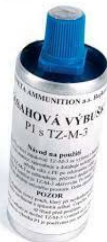
Obrázek 19 P1 s TZ