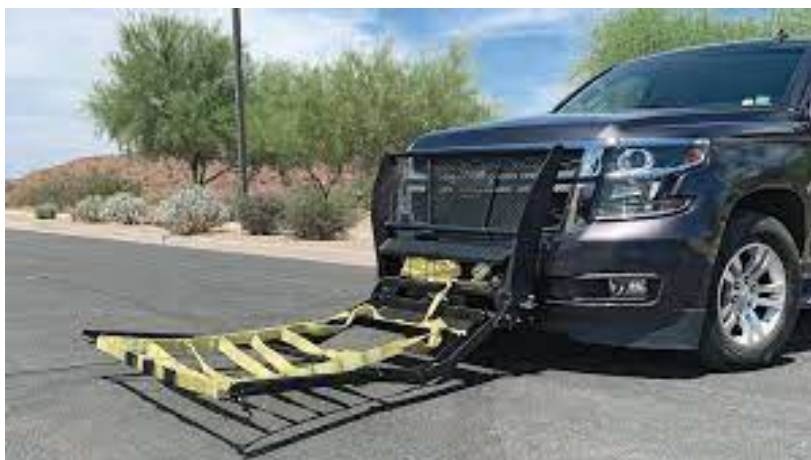
Obrázek 27 Grappler police bumper

Jedním z nejmodernějších zařízení sloužících k zastavení vozidla je grappler police bumper. Toto zařízení je namontováno na náraznících vozidel ozbrojených složek v mnoha státech USA. Osoba z osádky vozu při jízdě za unikajícím vozidlem aktivuje zařízení, čímž se sklopí část ocelového nárazníku směrem před vozidlo, vodorovně se silnicí. Po sklopení zařízení zaujmají nosníky polohu písmene V, mezi nimiž se nachází síť. Poté, co se zařízení nachází ve finální poloze, řidič vozidla musí dojet pronásledované vozidlo a zacílit síť na kolo pronásledovaného vozidla. Při kontaktu s kolem se uvolní síť a omotá se kolem kola, načež je pevně spojena s nárazníkem vozidla ozbrojených složek. Dalším krokem po úspěšném chycení je sešlápnutí brzdového pedálu, čímž efektivně zastaví pronásledované vozidlo. Tento systém byl od zařazení do výzbroje efektivně použit při 600 zastavení ujíždějících vozidel. Hlavní nevýhodou je nutnost přiblížit se na kontaktní vzdálenost od vozidla, což není v současné době vždy možné kvůli výkonným automobilům.