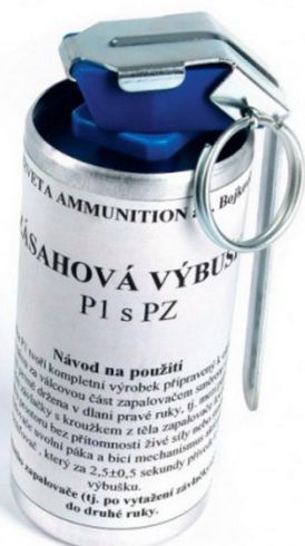
Obrázek 20 P1 s PZ