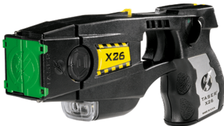
Obrázek 9 Taser X26

„Model X26 se liší od verze M26 tím, že má větší účinnost s menším výkonem, a to 7 W.“ 15