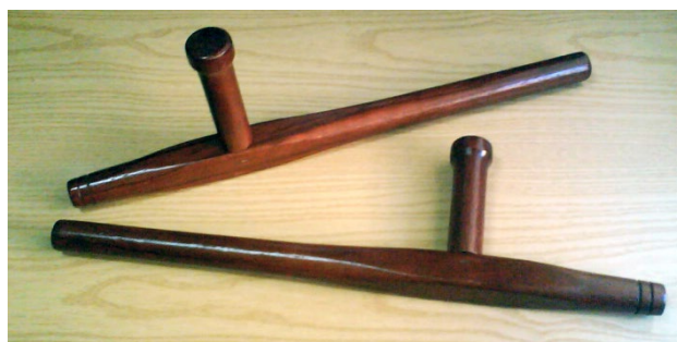
Obrázek 2 Tonfa

Postupem let se konstrukce obušku, až na malé odchylky, nezměnila. Jeho nejdůležitější změna proběhla v roce 1958, kdy se staly hlavními konstrukčními materiály guma a plast a byla přidána příčná rukojeť, která dovoľovala snadnější uchopení a použití. V současnosti se tento tvar s příčnou rukojetí nazývá tonfa.