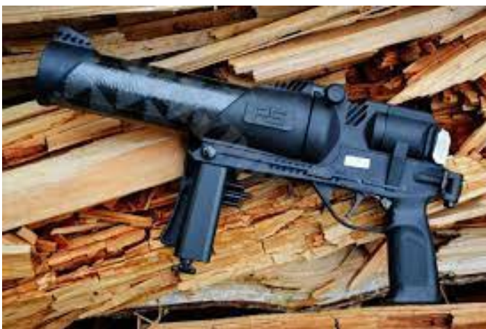
Obrázek 8 Kraken SF1

Tato zbraň původem z České republiky, přesněji vyráběná v poličských strojírnách. Díky pestré paletě střel má velmi široké spektrum využití. Je velmi často ve výzbroji vězeňské služby. Díky ráži 59 mm je schopen střílet i tenisové míčky. Do zbraně lze použít pouze originální nábojku ráže .357 KRAKEN. Kromě tenisových míčků dokáže vrhat kouřové a slzotvorné granáty, výbušky typu P1 a P2 nebo také dokáže vystřelit brokový náboj s dvaceti pryžovými projektily.