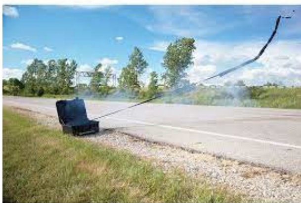
Obrázek 22 Night Hawk Remote spike systém

Pro použití se systém umístí na krajnici silnice. Poté se musí nasměrovat šipkou, která se na něm nachází. Po otevření je nutné systém zaktivovat. Na kufříku se nachází aktivační přepínač. Po aktivaci je nutné uchopit dálkový ovladač, který funguje na principu radiových vln. Ovladač disponuje pouze dvěma tlačítky, proto je manipulace se systémem velmi jednoduchá a intuitivní. Při stisknutí tlačítka na spuštění systému kufr vystřelí za pomoci plynu trnové segmenty do vzdálenosti 7,5 metru, přičemž začátek prvního segmentu se nachází ve vzdálenosti 3,5 metru. Po projetí cílového vozidla osoba, která ovládá systém, zmáčkne druhé tlačítko, jímž systém odstraní stáhnutím k sobě trnové segmenty ze silnice a umožní bezpečný průjezd ozbrojeným složkám.