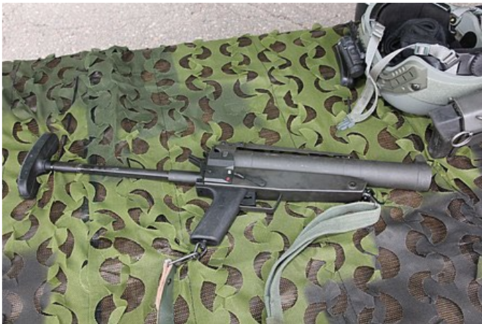
Obrázek 7 Granátomet HK69A1