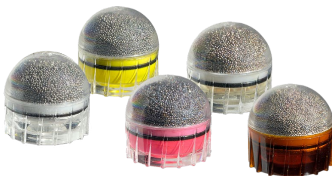
Obrázek 5 Projektily FN 303

V současné době belgická zbrojovka dodává pět druhů projektilů. První na fotce, transparentní, je určený k tréninku a neobsahuje žádnou látku. Další druh obsahuje dráždivou látku PAVA/OC (na fotce hnědý projektil). Další dva druhy obsahují barvu. Hlavní rozdíl v použití jsou vlastnosti barev. Omyvatelná (růžová barva) a neomyvatelná (žlutá barva). Poslední druh je určen k výcviku a obsahuje bílý prášek. Aktuální uživatelé tohoto systému jsou: Spojené státy americké, Argentina, Finsko, Turecko, Bulharsko, Gruzie, Belgie a další.