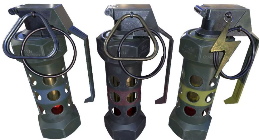
Obrázek 14 Zábleskový granát M84

Hlavní předností daného granátu je záblesk při detonaci, který dosahuje 6-8 milionů cd a také velmi silný zvukový efekt v rozpětí 170-180 dB. Pro porovnání uvedu příklad startu tryskového letadla a dále také iniciaci ohňostroje, které dosahují hodnot okolo 140 dB.