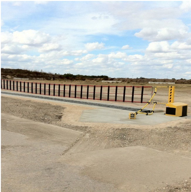
Obrázek 26 Net Barrier

Jedná se o moderní systém k zastavení vozidla za použití vysokopevnostní sítě. Výše zmíněný systém obdržel certifikaci od instituce Department of Defense. Jedná se o pevně zabudovaný systém, který je v případě potřeby ve funkční pozici do 6 vteřin. Zařízení je schopno zastavit vozidlo o váze 6,8 tun při rychlosti 80 km/h. Při nízkých rychlostech síť auto odpruží. V případě vysoké rychlosti, v kombinaci s vysokou váhou vozidla, dochází k jeho deformaci. Síť je uchycena mezi ocelovými nosníky a může disponovat šířkou 7–24 metrů.