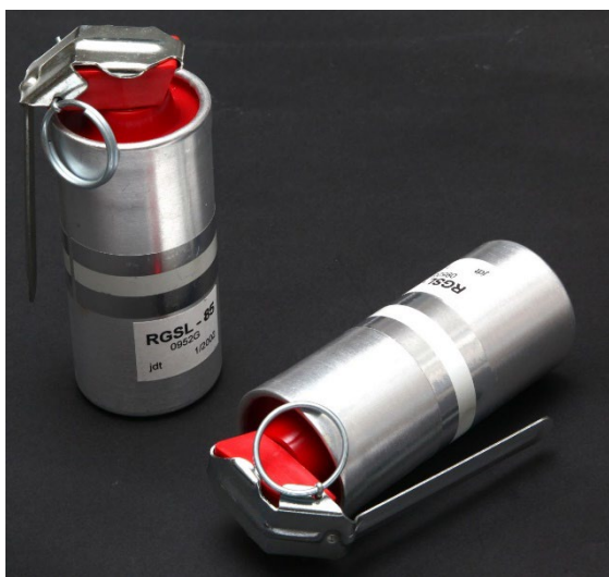
Obrázek 11 Slzotvorný granát RGSL 85

„Granát tvoří kovové tělo s plastovým uzávěrem, ve kterém je trvale našroubován palník s vrhovou a přepravní pojistkou. Na těle jsou výfukové otvory, v nepoužitém stavu přelepené páskou.“ 18