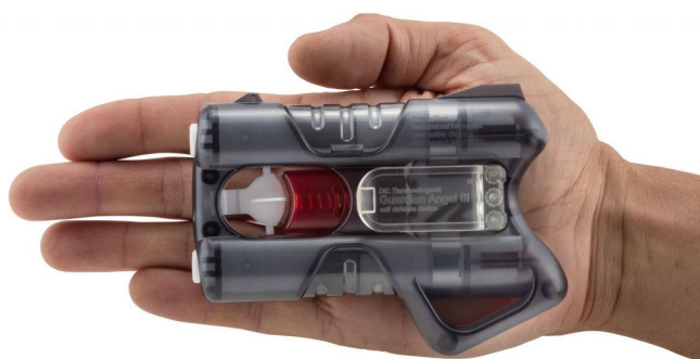
Obrázek 13 Guardian Angel III

Scovilleova stupnice pálivosti je stupnice, která se používá k určení pálivosti chilli papriček a jiných koření a látek. Byla vytvořena americkým farmakologem Wilbur Scovillem v roce 1912 a od té doby se stala standardem v této oblasti. Stupnice je založena na množství kapsaicinu, chemické látky způsobující pálivost. Kapsaicin se měří v jednotkách Scovilleových stupňů (SHU).