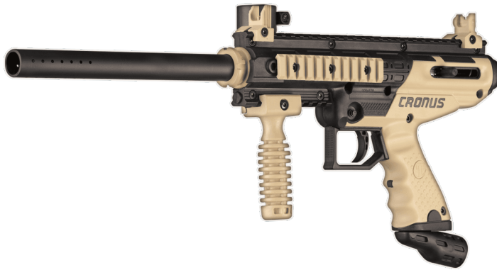
Obrázek 6 Tippmann A5