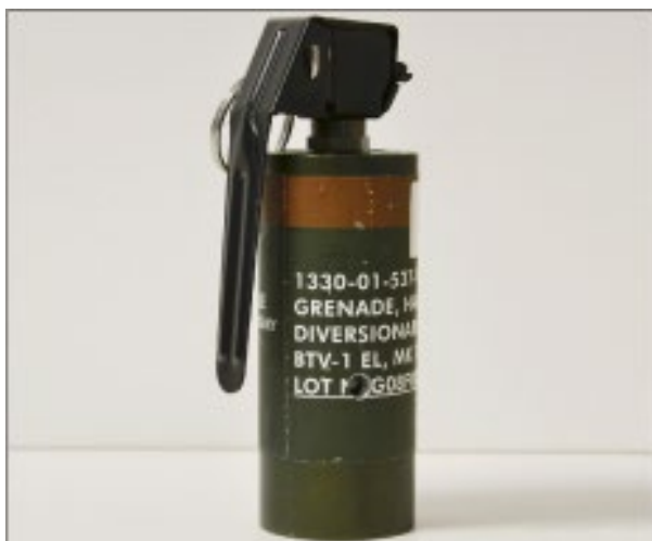
Obrázek 21 Zásahová výbuška NICO

Další druh výbušky, který je označen shodně zelenou barvou jako NICO 1,2,9 je granát s označením NICO 6 a NICO 7. Hlavní rozdíl se nachází na konstrukci výbušky a na následném účinku. NICO 6 a NICO 7 mají pyrotechnickou slož umístěnou na dně těla granátu. Při detonaci vznikne šest nebo sedm světelných záblesků podle označení výbušky. Hlavní rozdíl je v produkci zvukového efektu. Na rozdíl od předchozí skupiny tento druh doprovází světelné záblesky pouze jednou ránou o hodnotě okolo 170 dB.