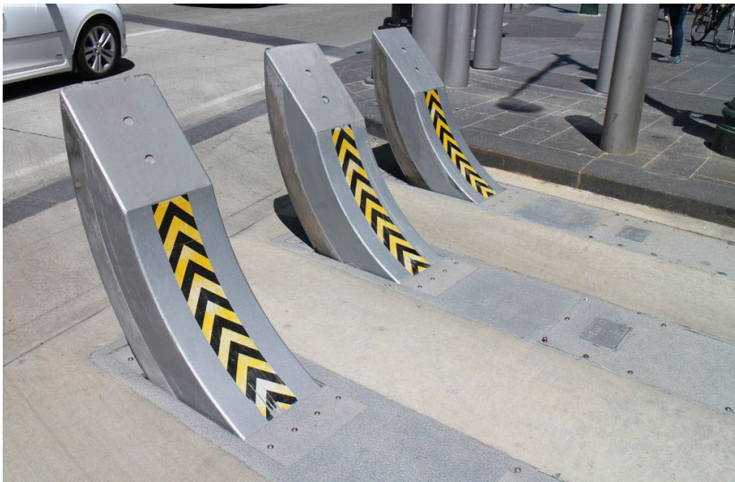
Obrázek 24 HT1 Raptor