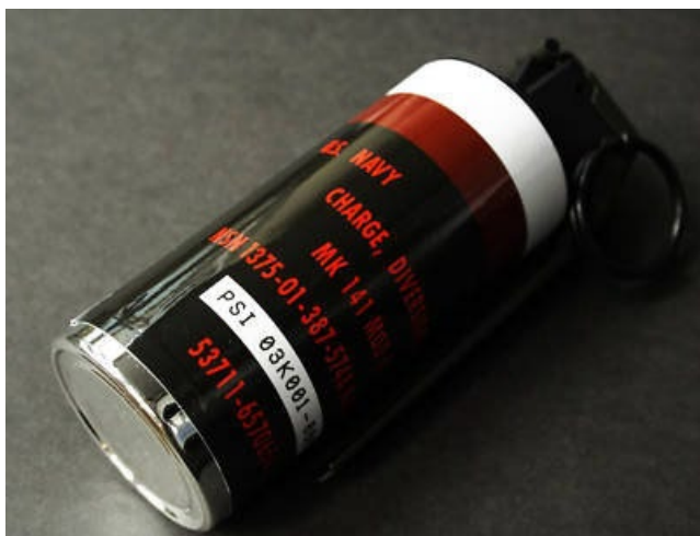
Obrázek 15 MK 141 Mod 0