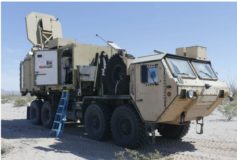
Obrázek 18 Active Denial Systems

Systém je velmi efektivní z důvodu svých fyzikálních vlastností. Působí stejně i na osoby pod vlivem omamných a psychotropních látek a alkoholu.