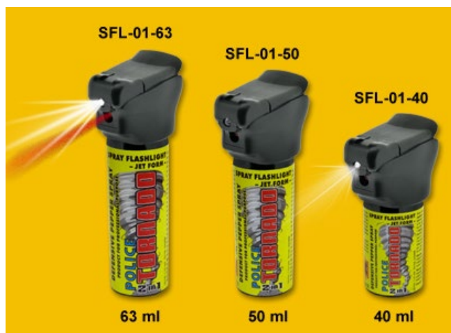
Obrázek 12 Sprejová svítidla police tornado

Je důležité mít na paměti, že Police Tornado a podobné typy přístrojů by měly být používány s maximální opatrností a v souladu s příslušnými zákony a předpisy. Použití těchto přístrojů by mělo být vždy oprávněné a mělo by být v souladu s danou situací. Použití Police Tornado by mělo být vždy poslední možností po využití všech jiných dostupných prostředků.