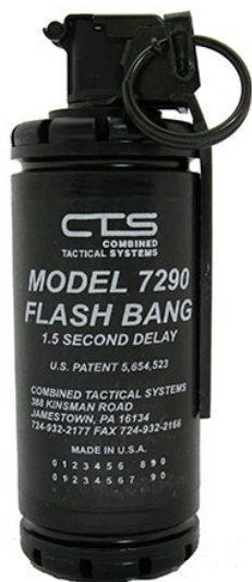
Obrázek 16 CTS 7290