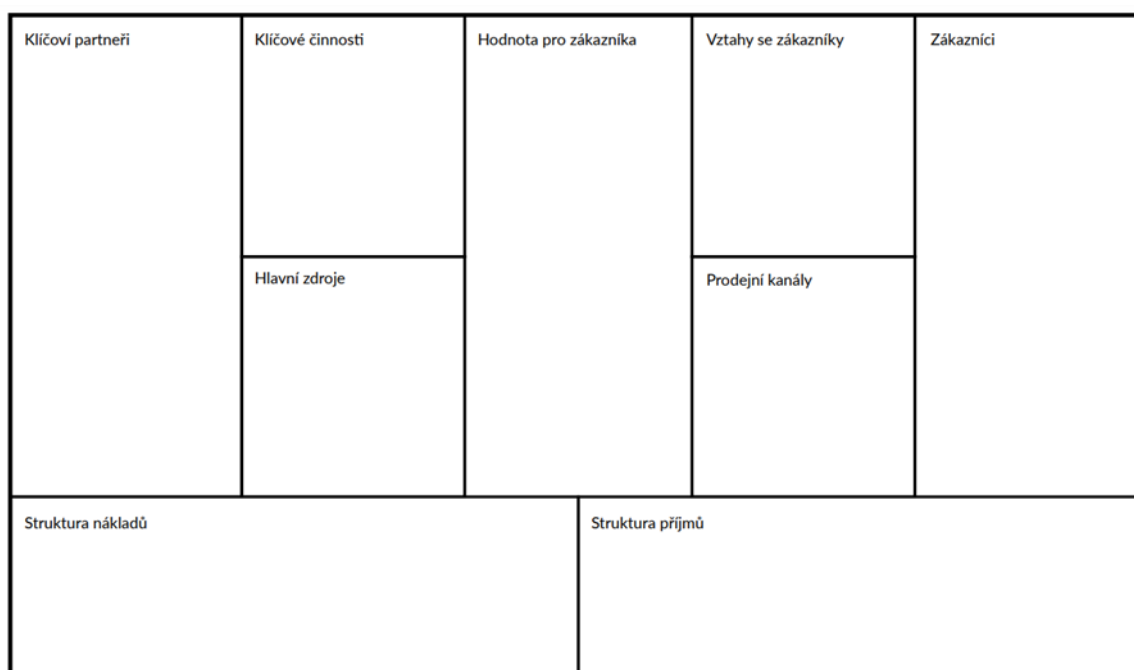
Obrázek 1: Diagram Business Model Canvas

Osterwalder proto navrhl jednostránkový diagram, který obsahuje všechny podstatné oblasti a dělí je do jednotlivých okének. Do šablony je pak možné nejen zapisovat, ale také kreslit či vlepovat lepící papírky s obsahem toho nejpodstatnějšího dle jednotlivých oblastí. Výstupem je přehledný, stručný dokument, který je možné vytvořit do 20 minut. (Svobodová a Andera 2017). Obrázek č. 1 představuje českou verzi diagramu Business Model Canvas.