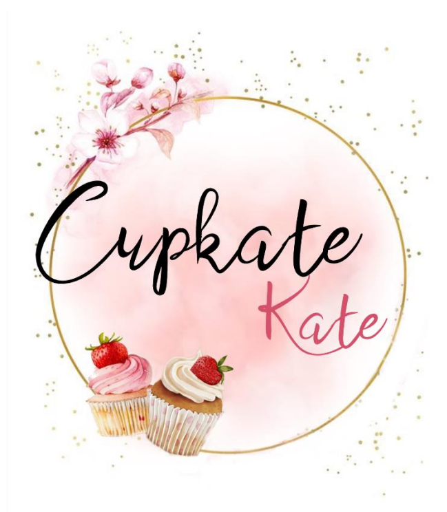
Obrázek 4: Logo pro Cupkate Kate

písmem za použití dvou barev – slovo Cupkate černou a slovo Kate tmavě růžovou, aby byl text na světle růžovém pozadí dobře viditelný. Celé logo uzavírá kruh, který symbolizuje podstavu kulatého dortu a zároveň tvoří rámeček celého loga a tím mu dodává celistvý dojem. Celé logo je laděné do růžové barvy s prvky zlaté, doplněné tmavšími nápisy. Jemné tóny základu symbolizují něžnost a lehkost, se kterou podnik rezonuje. Dezerty samotné jsou často vyobrazovány v těchto barvách, jelikož navozují pocit sladkosti a pohody. Výsledné logo má za úkol navodit příjemnou atmosféru, kterou zákazník bude po zhotovení objednávky mít. Výsledné logo znázorňuje následující obrázek: