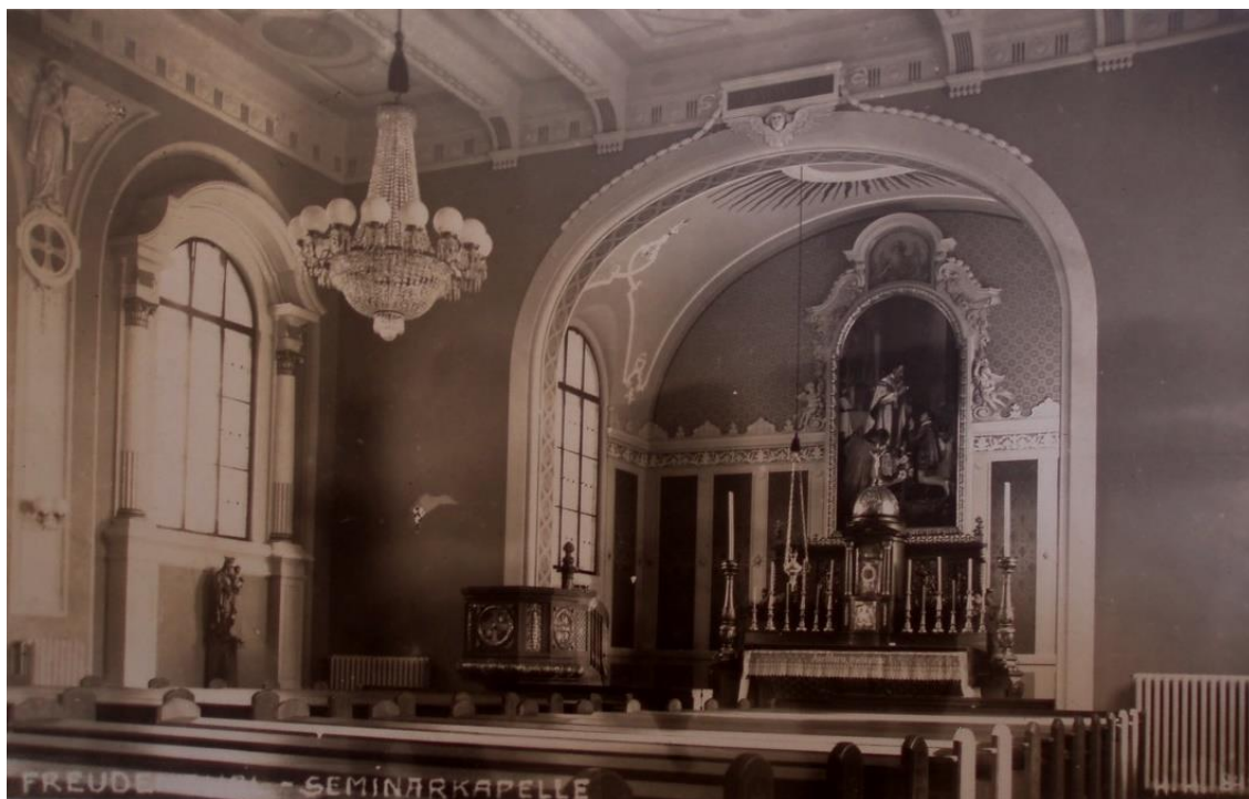
Kaple v chlapeckém semináři v Bruntále.