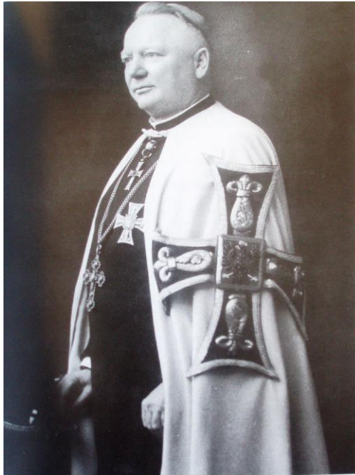
Die Hochmeister des Deutschen Ordens 1190 – 1994, s. 319.