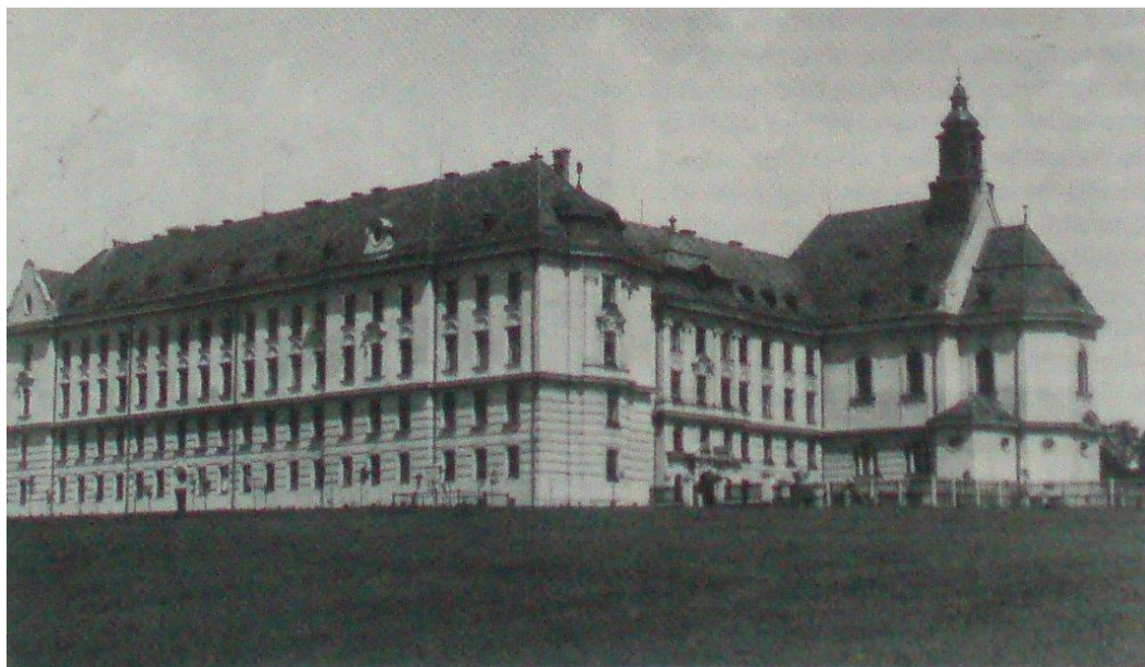
Katolický chlapecký seminář v Bruntále (DOZA, Hochmeister , kart. 549.)