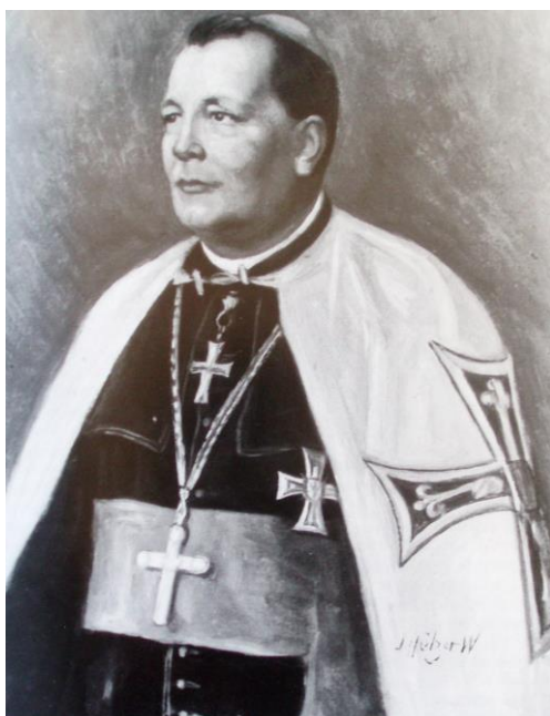
Die Hochmeister des Deutschen Ordens 1190 – 1994, s. 299.