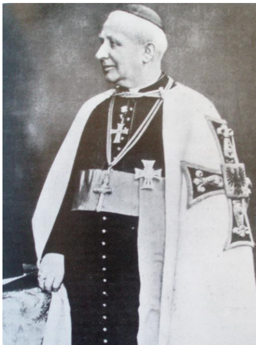
Die Hochmeister des Deutschen Ordens 1190 – 1994, s. 313.