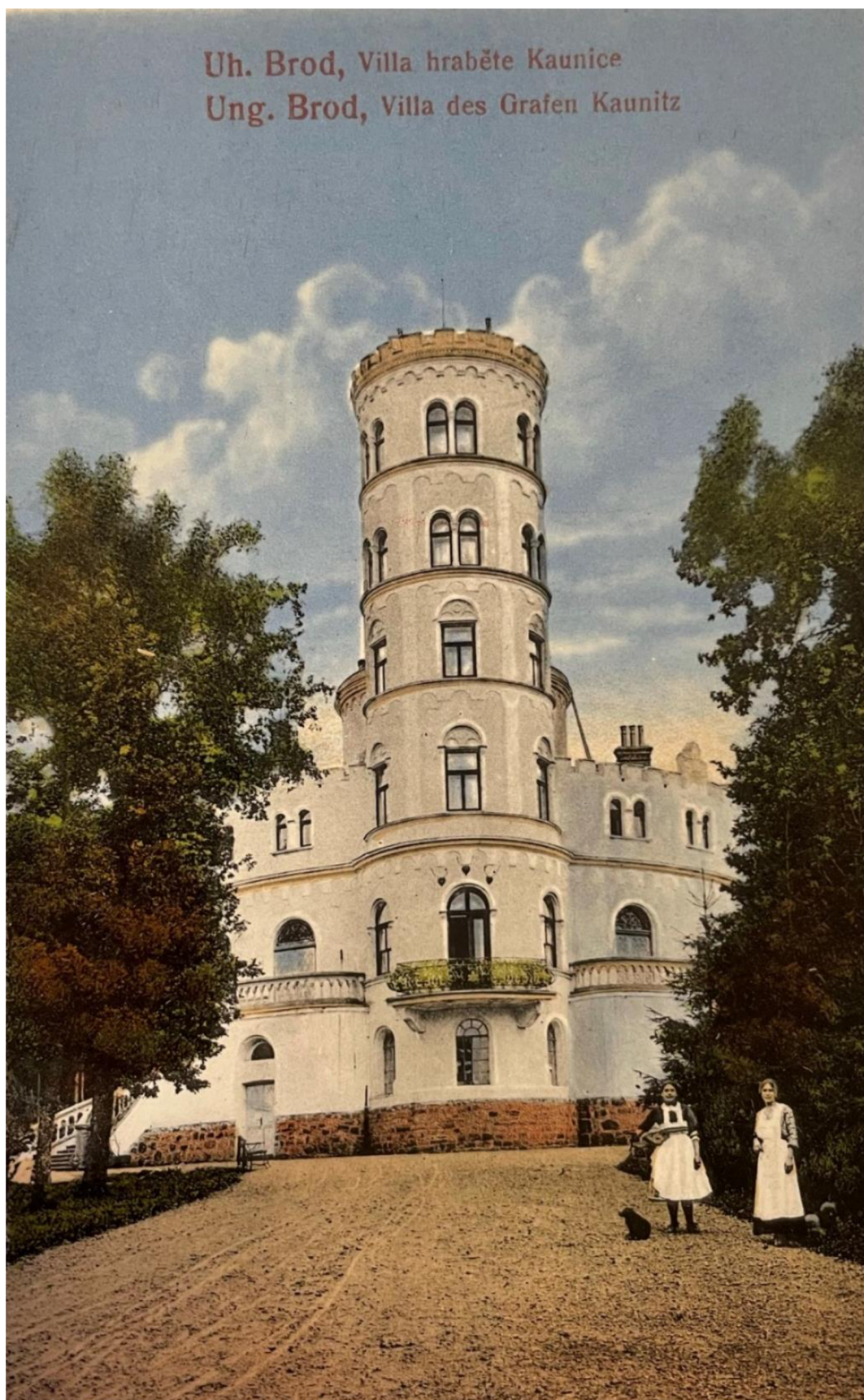
Příloha č. 6: Zámeček Obora na pohlednici z doby kolem roku 1910 ( Pozůstalost JUDr. Václava Kounice. Zámek Slavkov – Austerzlitz )