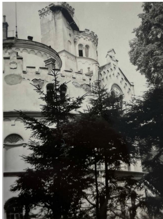
Příloha č. 8: Série fotografií zámku Obora pořizená konzervátorem Památkového ústavu v 50. letech 20.století ( NPÚ Brno )