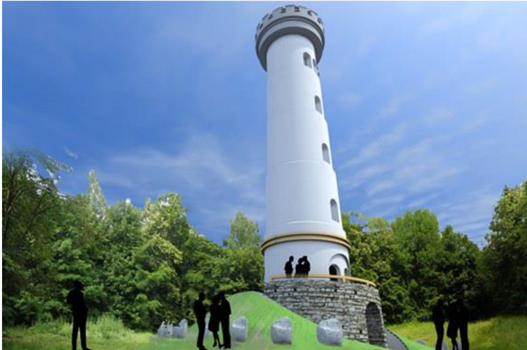
Příloha č. 9: Návrh rozhledny, která měla vzniknout na místě bývalého záměčku, 2011 ( https://www.idnes.cz/zlin/zpravy/slovacko-se-stane-bastou-rozhleden-na-tu-nejvetsi-vsak-nema-penize.A110201_1524726_zlin-zpravy_kol )