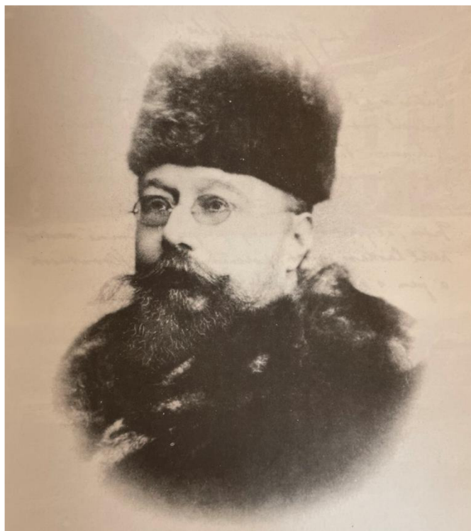
Příloha č. 1: Hrabě JUDr. Václav Kounic v roce 1887 jako mladočeský poslanec ( Pozůstalost JUDr. Václava Kounice. Zámek Slavkov – Austerzlitz )